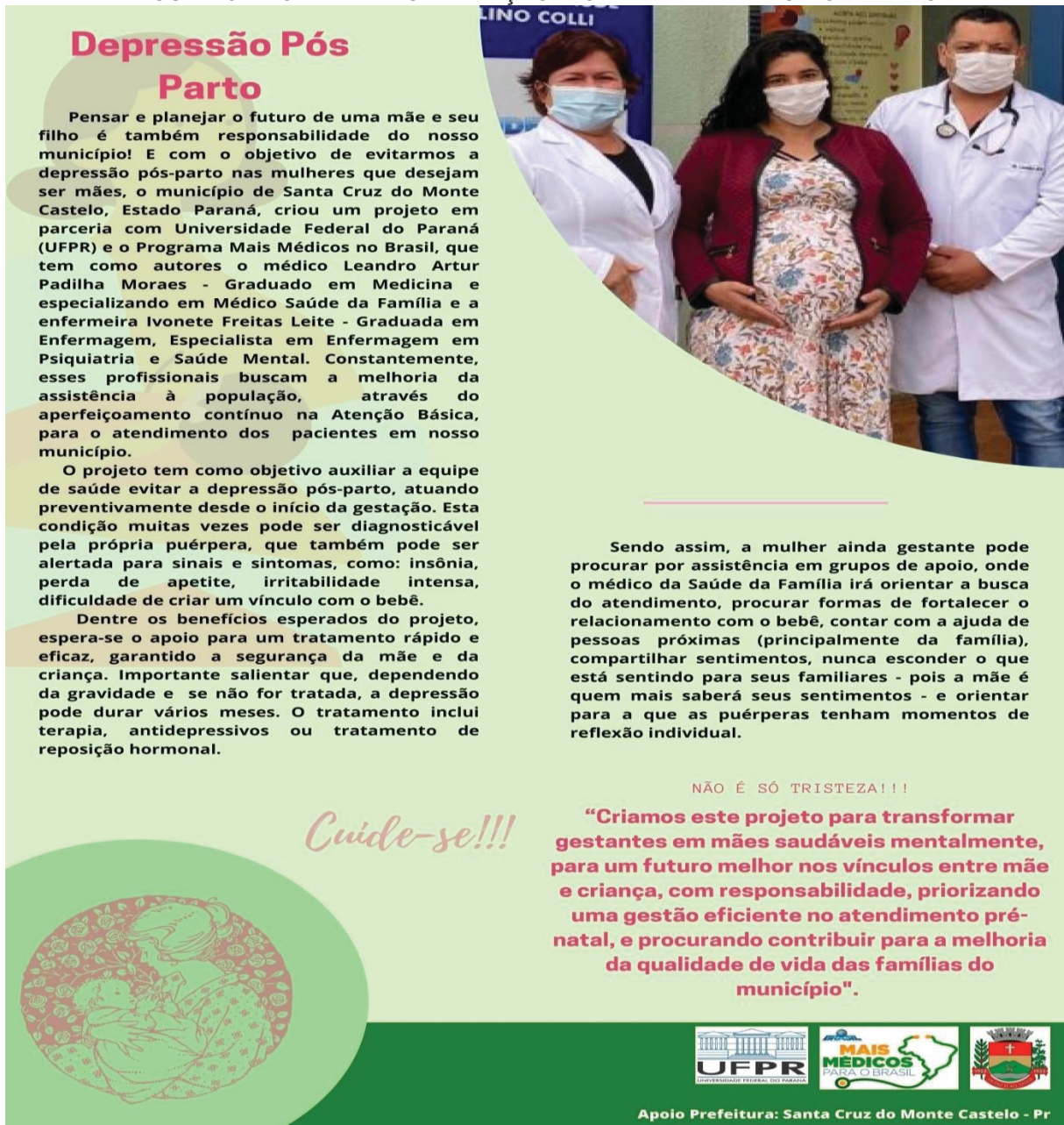
FIGURA 3 – FOLDER DE ORIENTAÇÃO SOBRE DEPRESSÃO PÓS-PARTO

As rodas de conversa ocorreram no primeiro semestre de 2021, na UBS, contou com a participação de três gestantes, e foi desenvolvida com base da discussão e socialização de conhecimentos científicos, apresentados no folder de orientação (figura 3).