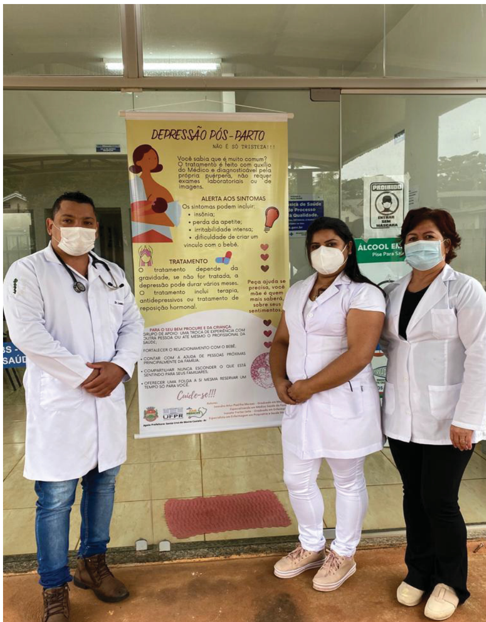
FIGURA 1 – EQUIPE DE SAÚDE

As ações foram realizadas após uma reunião de sensibilização e compartilhamento dos objetivos com a equipe de saúde. Na figura 1, tem-se o registro fotográfico do autor da iniciativa, juntamente com a Enfermeira da Atenção Básica do município de Santa Cruz de Monte Castelo, e a Técnica de Enfermagem da Unidade de Saúde Central: