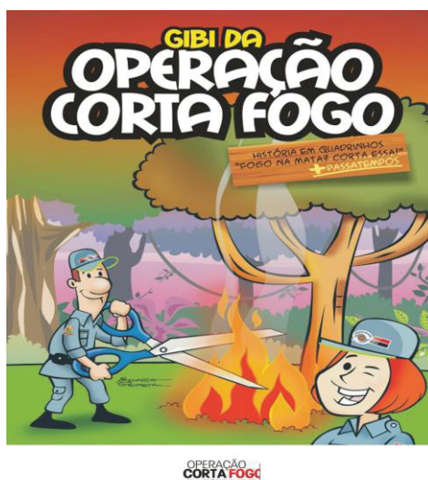
FIGURA 2- HQ "FUNÇÃO DAS HQS"