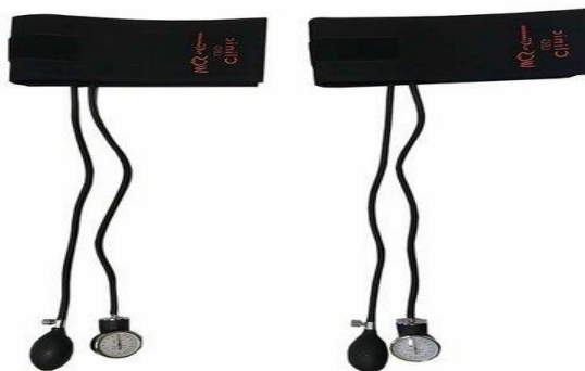
FIGURA 2 - EQUIPAMENTO PARA OCLUSÃO VASCULAR: MARCA WCS CARDIOMED

O modelo mais frequentemente utilizado na grande maioria das pesquisas e prática do treinamento com oclusão vascular fora do Japão, utiliza-se um manguito inflável acoplado a um manômetro analógico, com funcionamento semelhante ao de um esfigmomanômetro para aferição da pressão arterial (TEIXEIRA, 2018).