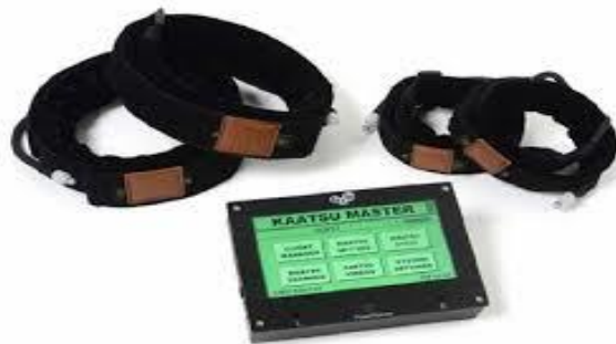
FIGURA 1 - EQUIPAMENTO PARA RESTRIÇÃO DO FLUXO SANGUÍNEO, MARCA KAATSU

O equipamento desenvolvido pelo criador do método Yoshiaki Sato utiliza um sistema computadorizado para controlar a pressão exercida pelos manguitos durante o treinamento, a partir de duas mangueiras, um computador infla os manguitos posicionados na região proximal de membros superiores e inferiores, objetivando promover uma pressão externa sobre os membros, acarretando na restrição parcial do fluxo sanguíneo para o segmento corporal.