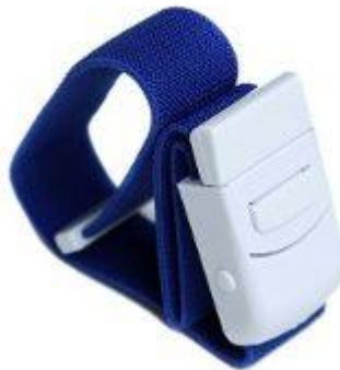
FIGURA 3 - FAIXA ELÁSTICA ADAPTADA PARA TREINAMENTO COM OCLUSÃO VASCULAR

Outra possibilidade encontrada na literatura para o treinamento com oclusão vascular é o uso de torniquetes feitos com faixas elásticas. Devido a impossibilidade de identificar a pressão de forma objetiva, esse tipo de material tem sido utilizado em algumas pesquisas utilizando escalas de percepção de pressão (de 0 a 10) para controle da pressão de oclusão vascular.