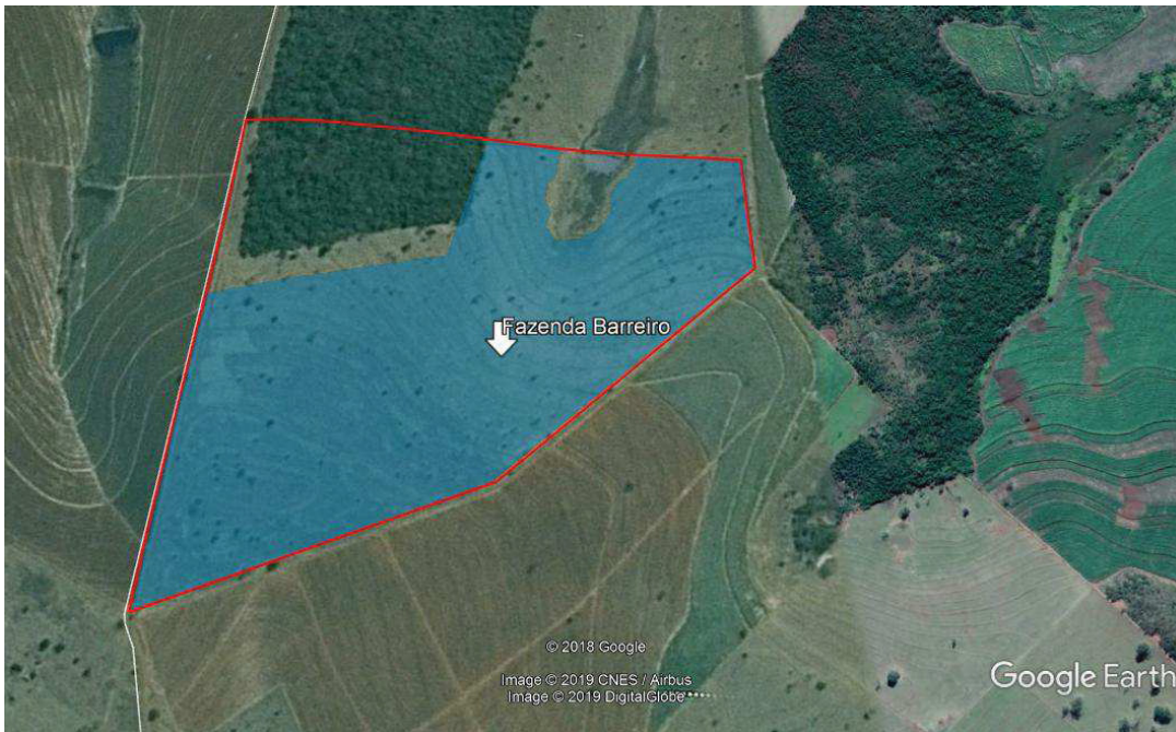
FIGURA 2. Área de supressão da vegetação arbórea (destacada em azul), na Fazenda Barreiro, município de Limeira do Oeste, MG.

O estudo foi realizado através da aplicação de um censo florestal, com levantamento de todos os indivíduos isolados presentes na área alvo da intervenção ambiental, que totaliza 57,20 hectares (Figura 2).