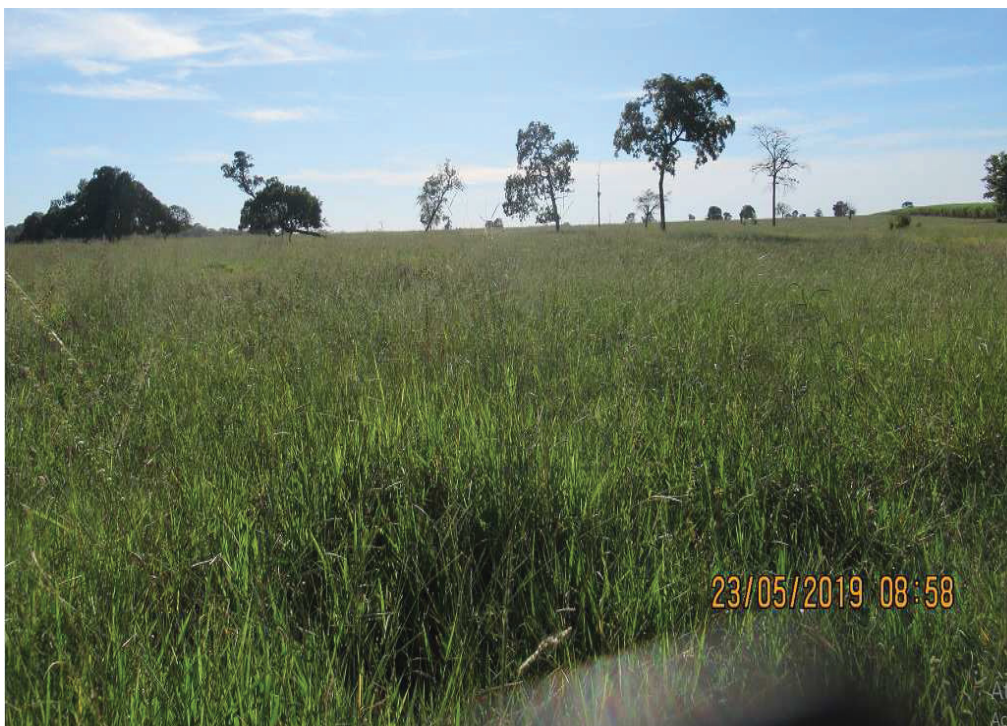
FIGURA 3. Inventário florestal realizado no local do corte de árvores isoladas na Fazenda Barreiro, município de Limeira do Oeste, MG.

Para medir a altura comercial (Hc) foi utilizada uma trena fita Métrica Ponta Imantada.