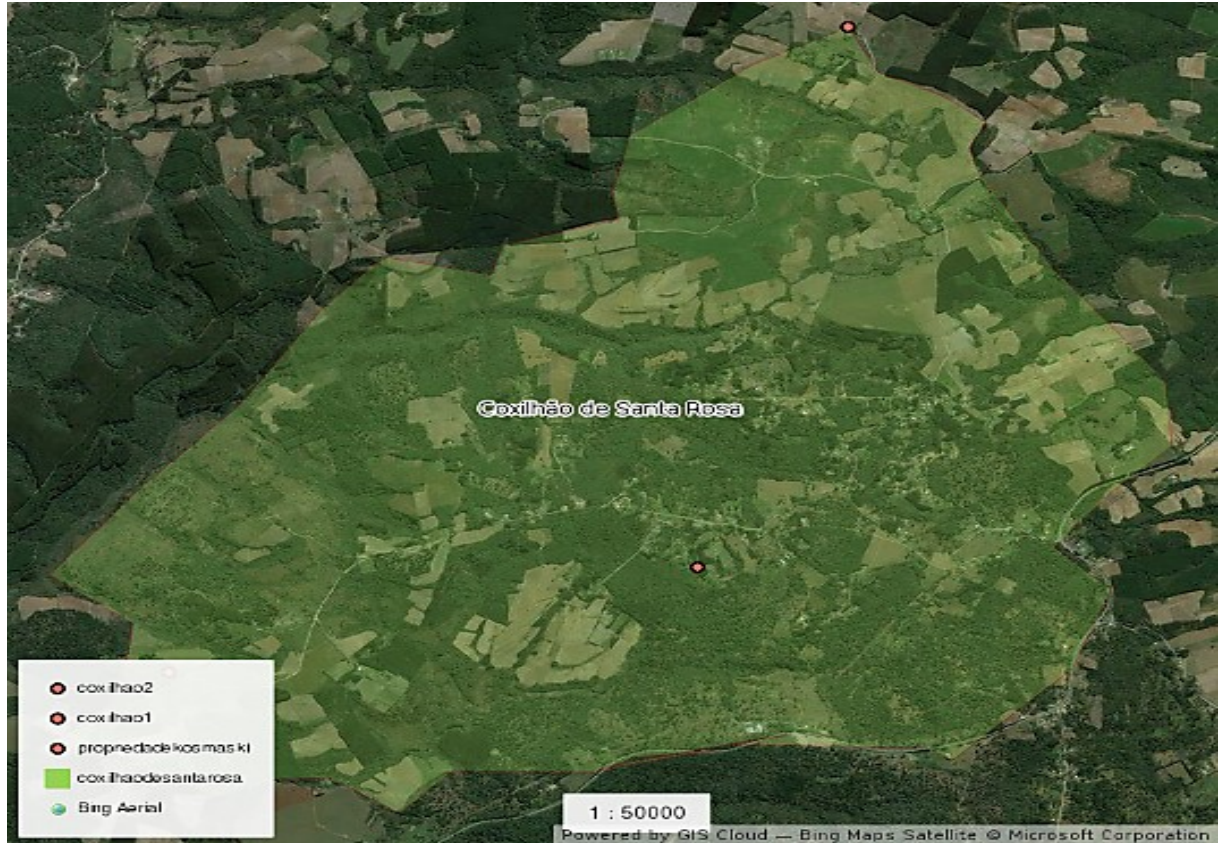
Figura 1-FONTE: Lindolfo Kosmaski, 2018. Bing Satélite, fotointerpretação.

A seguir apresentaremos as entrevistas e as discussões que delas tiramos: