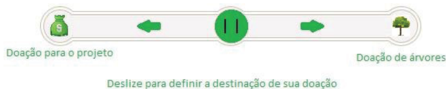
FIGURA 2 - ESQUEMA DE DOAÇÕES NO APLICATIVO E SITE

Para introdução e popularização do aplicativo, optou-se por não cobrar pela utilização do mesmo, uma vez que o aplicativo pago não tem boa receptividade no país. Optou-se por trabalhar com o AdSense , da Google, ou com patrocinadores do projeto que desejarem veicular suas marcas nas plataformas digitais do Vamos Plantar. Estipulou-se também um valor de 10 reais por árvore plantada, ou seja, a cada 10 reais recebido, uma árvore seria plantada em algum lugar. O usuário deve optar pela destinação do dinheiro, escolhendo a porcentagem do recurso a ser empregado para o projeto e a quantidade a ser destinada especificamente para o plantio de árvores (FIGURA 2).