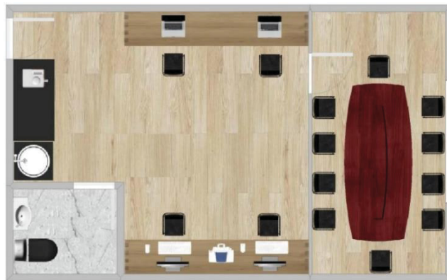
FIGURA 3 - LAYOUT DA VAMOS PLANTAR

O layout da Vamos Plantar, foi pensado para facilitar o trabalho coletivo e proporcionar um ambiente onde os colaboradores possam trocar ideias, sem salas particulares. O local do escritório terá aproximadamente 25 m 2 , com um banheiro funcional, uma área maior para trabalho e uma sala para reuniões, que será usada para apresentar o projeto para novos colaboradores e interessados em conhecer melhor a proposta da empresa (FIGURA 3).