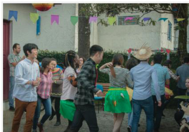
Decoração, quadrilha e comidas típicas: não faltou nada para animar os alunos