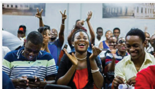
Turma de acolhimento a haitianos de 2015.

Esses projetos envolvem os cursos de Direito, Informática, Psicologia, Sociologia, Letras e o Centro de Línguas e Interculturalidade (Celin), além do Programa de Educação Tutorial (PET) História da UFPR. Participam do Pmub professores, servidores, pesquisadores e estudantes de graduação e pós-graduação. De acordo com a coordenadora, entre 2014 e 2018 cerca de 5 mil pessoas foram beneficiadas pelo Programa.