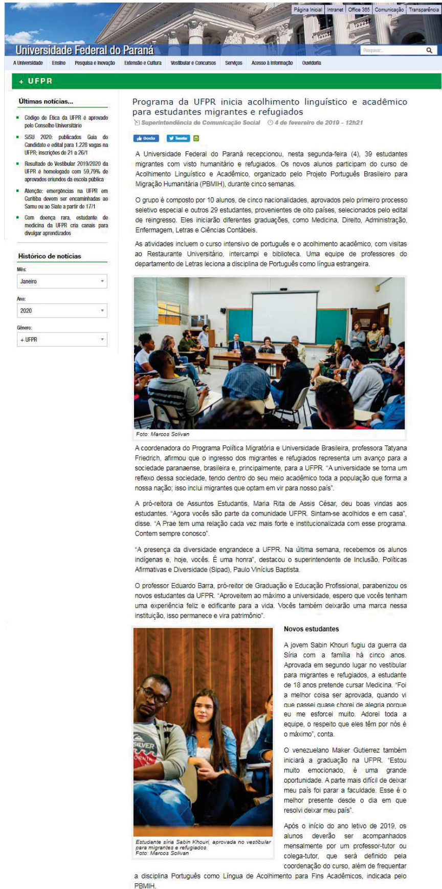
FIGURA 5 - PUBLICAÇÃO DO DIA 04 DE FEVEREIRO DE 2019 (PARTE 1)