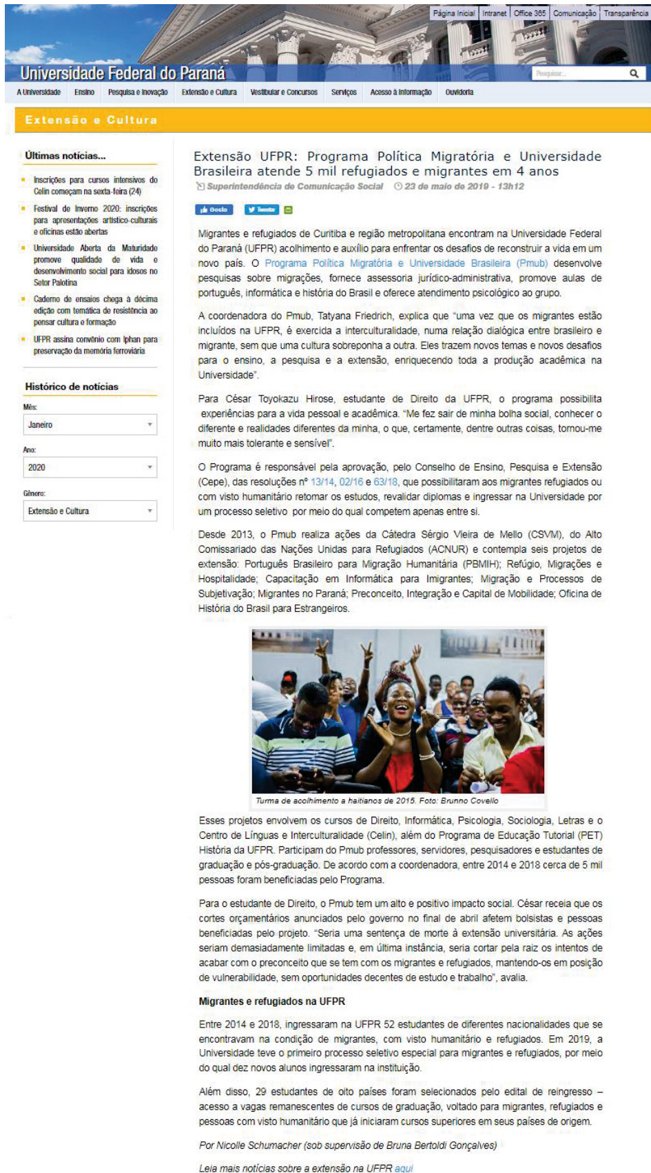
FIGURA 8 - PUBLICAÇÃO DO DIA 23 DE MAIO DE 2019