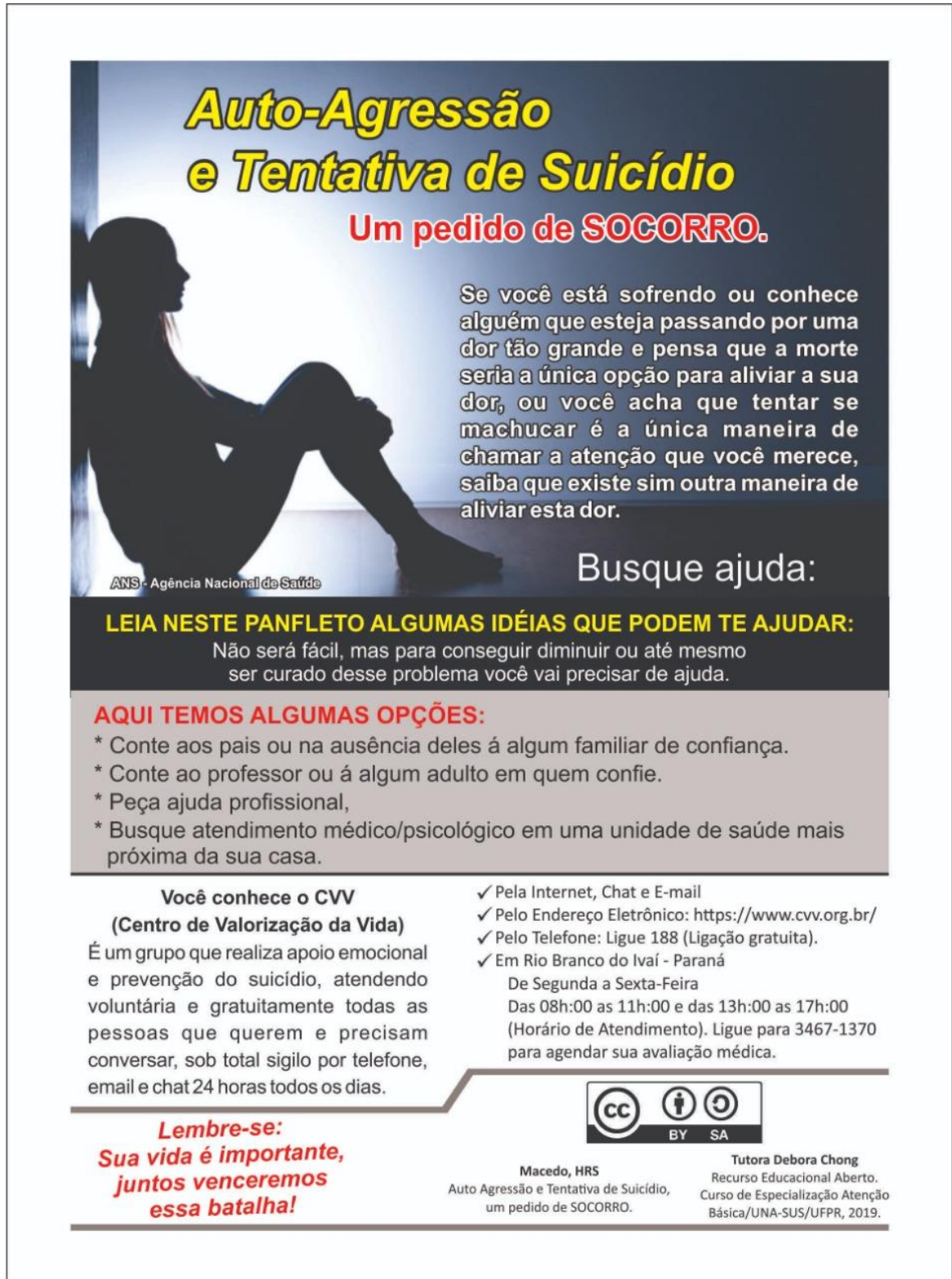
4.1.1 FIGURA 1

FONTE: O autor (2019). – Autoagressão e Tentativa de suicídio um pedido de SOCORRO.