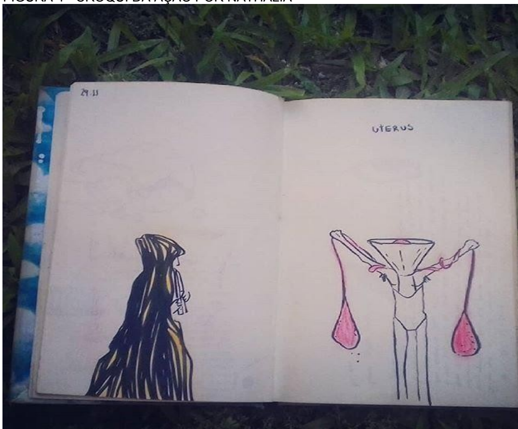
FIGURA 4 - CROQUI DA AÇÃO POR NATHALIA