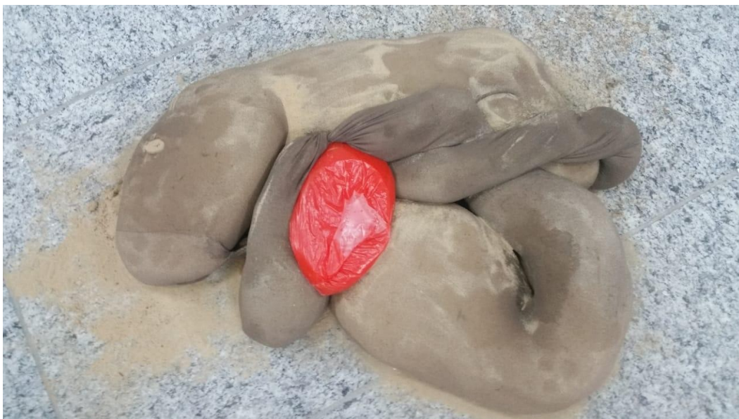
FIGURA 6 - Parte da instalação Sobre Carregada . O que você carrega está envolto em que?