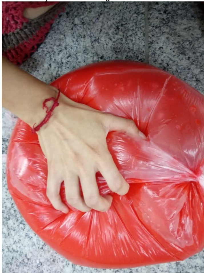
FIGURA 7 - Parte da Instalação Sobre Carregada . Sentir a materialidade do que está dentro/fora.