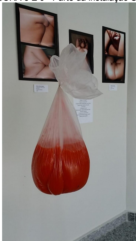
FIGURA 8 E 9 - Parte da instalação Sobre Carregada . Coágulos e seu peso suspenso.