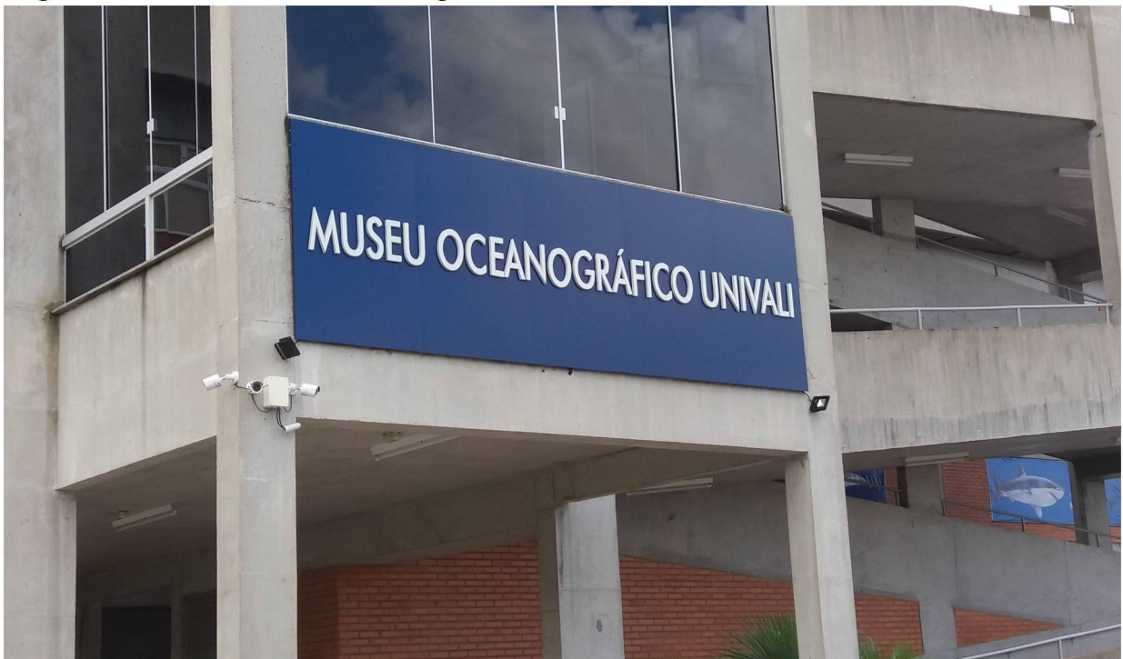
Figura 1. Faixada do Museu Oceanográfico.

Esse roteiro propõe uma atividade investigativa adicional para complementar e reforçar o aprendizado a partir do acervo do museu.