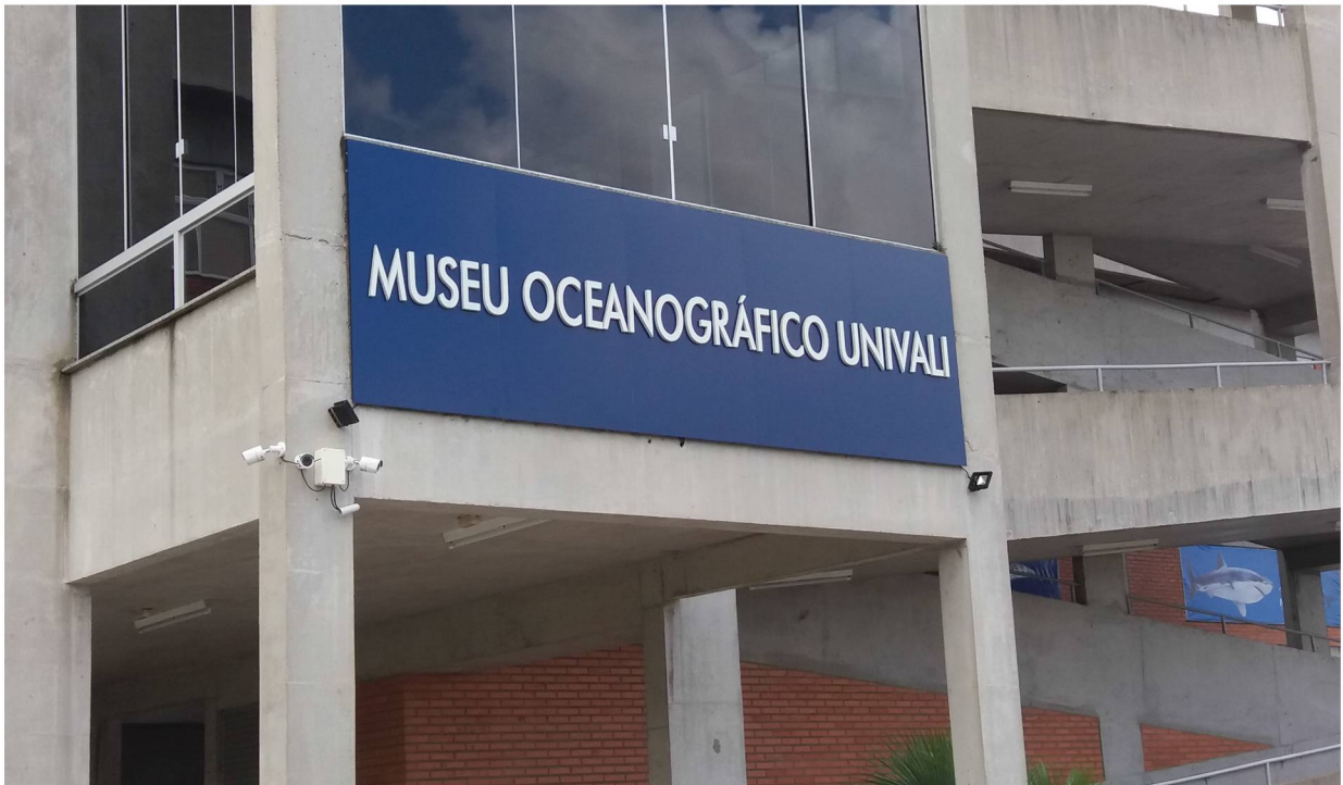
Figura 1. Faixada do Museu Oceanográfico.

O Museu Oceanográfico da Univali (MOVI) está instalado no campus da Universidade do Vale do Itajaí na cidade de Balneário Piçarras localizada no litoral norte catarinense. Conta com uma área construída de 4.000 m 2 , distribuídos em 4 andares. Classificado como museu de ciências e história natural possui um acervo que reúne coleções de conchas, mamíferos marinhos, tartarugas marinhas e elasmobrânquios (tubarões e raias), dispostos em salas por critérios taxonômicos (UNIVALI, 2020). Por ser um museu universitário, dentre os objetivos destaca-se o desenvolvimento de coleções de referência que representem o maior número de táxons e possibilitem pesquisas sobre a fauna marinha. É um espaço propício ao ensino de evolução biológica, história natural, arqueologia, história do Brasil com ênfase em Grandes Navegações e na história de Santa Catarina, biologia de invertebrados e de vertebrados. Nessa categoria inserem-se atividades educativas que possibilitam aos visitantes conhecimentos científicos e culturais relacionados ao acervo. O museu conta ainda com exposições temporárias temáticas que incluem, dentre outros, a formação de oceanos, evolução dos seres vivos, história da oceanografia e seres vivos marinhos, com programação que pode ser aproveitada pelos professores dependendo do cronograma do museu. As visitas são realizadas em grupos de estudantes que devem seguir um percurso guiado pelas diferentes áreas do museu.