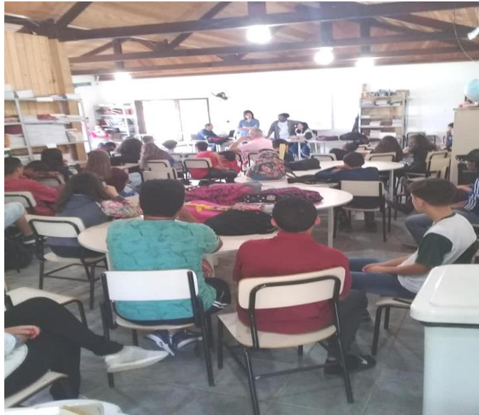
FIGURA 2 – ASSEMBLEIA ESTUDANTIL