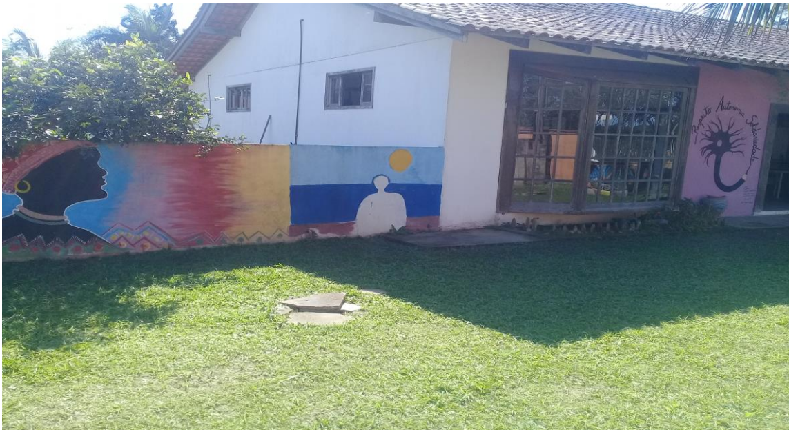
FIGURA 1 – ESCOLA MUNICIPAL JOÃO GERMANO MACHADO