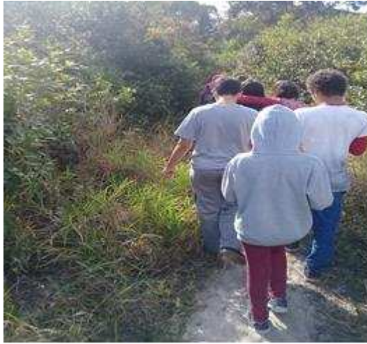
FIGURA 3 – SENSIBILIZAÇÃO E HUMANIZAÇÃO AMBIENTAL