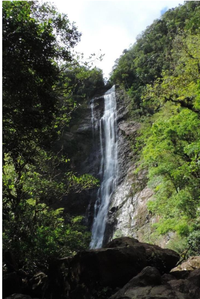
Figura 1: Cachoeira do Salto Morato.