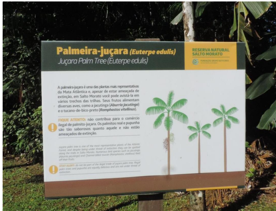
Figura 4: Pannel com informações sobre a palmeira-juçara ( Euterpe edulis ). Fonte: O Autor, 2017.