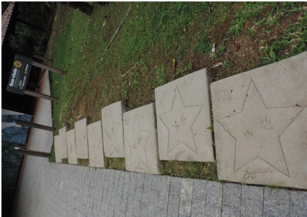
Figura 5: Exemplares da Calçada da Fauna que guiam até a entrada do Centro de Visitantes.