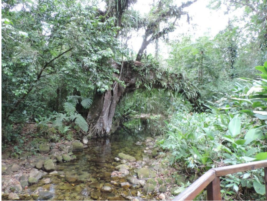
Figura 3: Figueira do rio do Engenho.