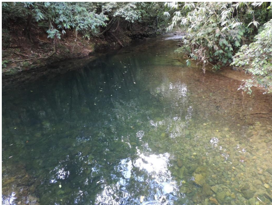
Figura 2: Aquário Natural.