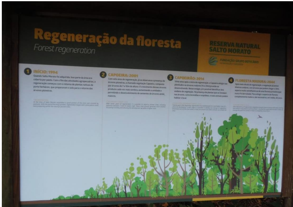
Figura 11: Painel interpretativo referente à regeneração florestal na RNSM.

demais paradas marcadas abordam temas como ecossistema, pesquisas realizadas na RNSM, ciclo da água, decompositores, informações sobre o Aquário Natural e a importância das epífitas.