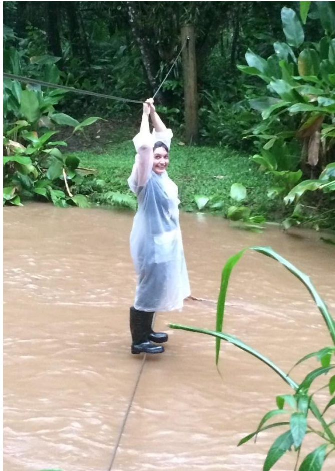
Figura 10: Passagem do rio pela falsa-baiana durante a cheia.

A Trilha do Salto tem início no Centro de Visitantes e termina na chegada à cachoeira. De acordo com o Plano de Manejo, esta trilha destina-se à recreação contemplativa, observação e fotografia (FGBPN, 2012).