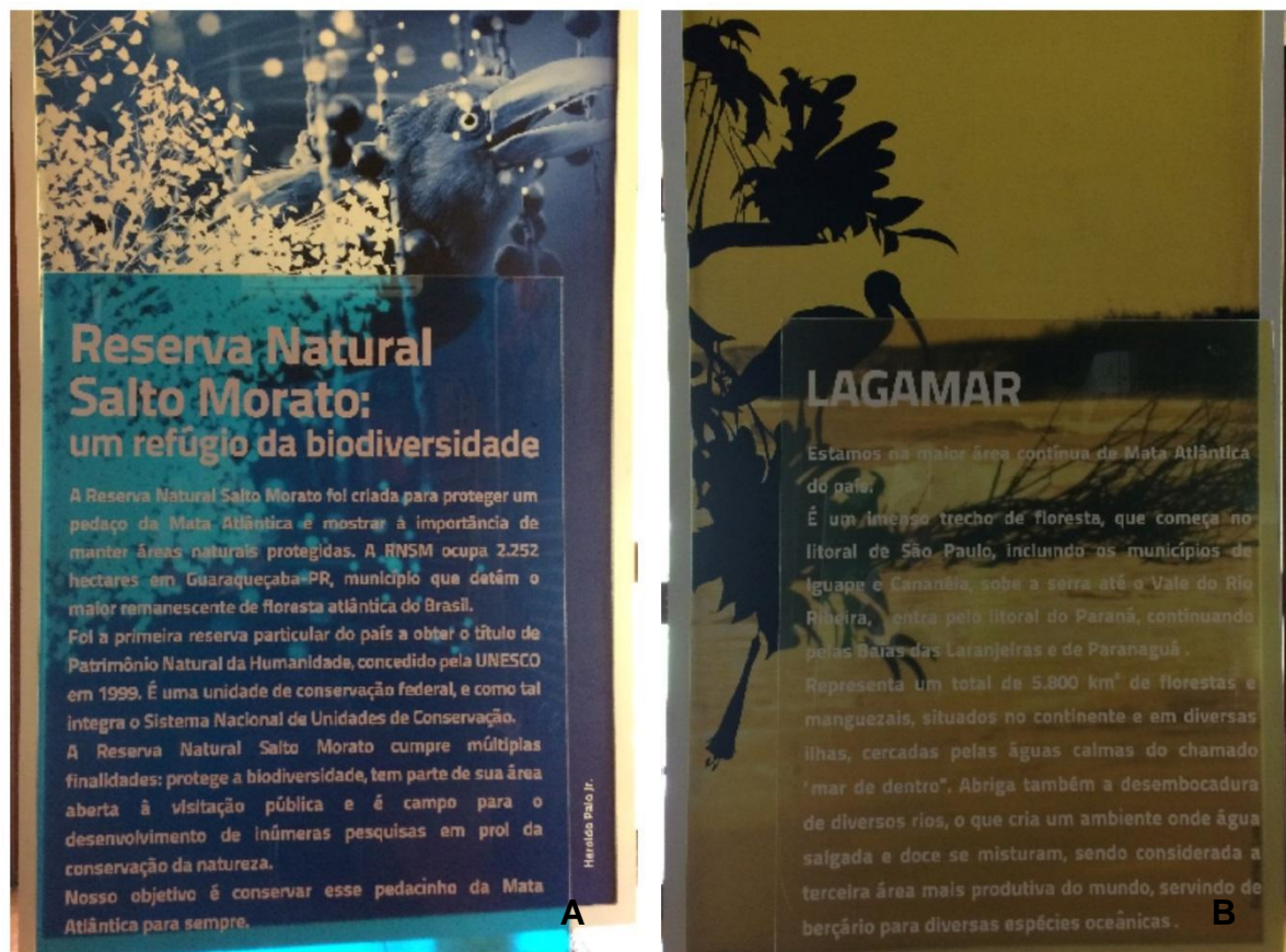
Figura 9: Exemplos de painéis informativos presentes no Centro de Visitantes A) Sobre a RNSM e B) Sobre a região do Lagamar.

Assim como as maquetes não interagem com os visitantes, uma vez que não são capazes de sanar todas as suas dúvidas só com o olhar, pois proporcionam apenas uma visão ampla da unidade e do local em que está inserida.