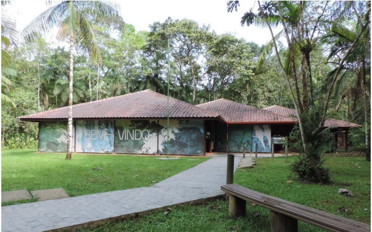
Figura 7: Vista geral do Centro de Visitantes.