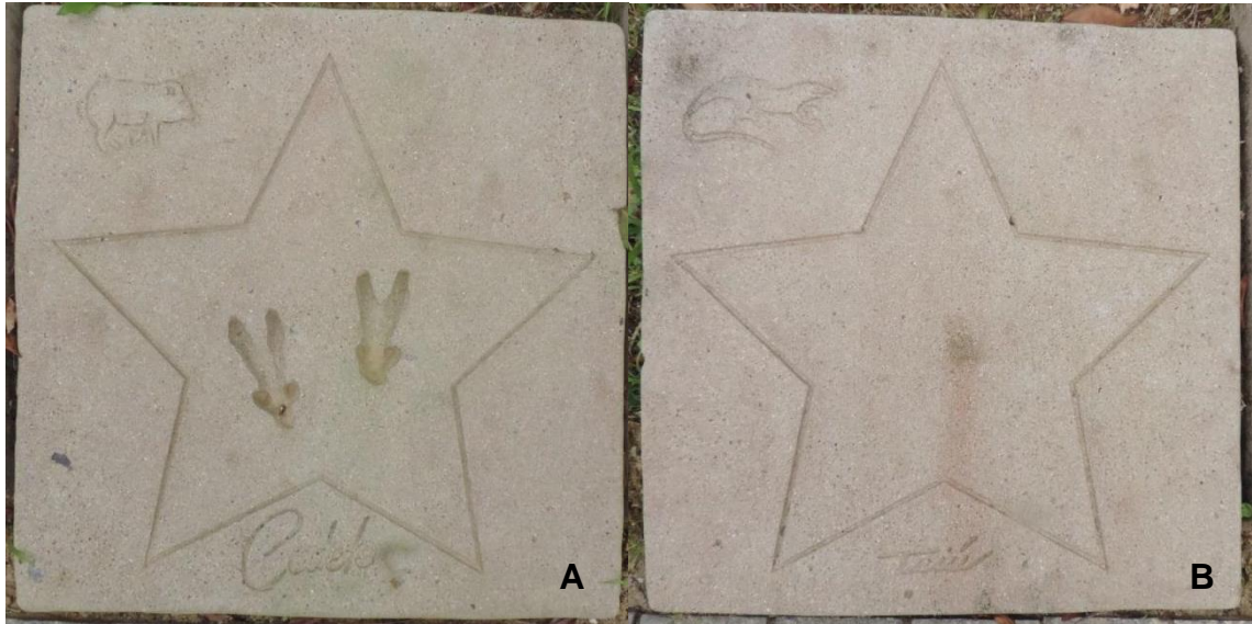
Figura 6: A) Exemplar de rastro de cateto ( Pecari tajacu ) em perfeito estado e B) Exemplar de rastro de teiú ( Tupinambis merianae ) que sofreu com o desgaste do tempo.