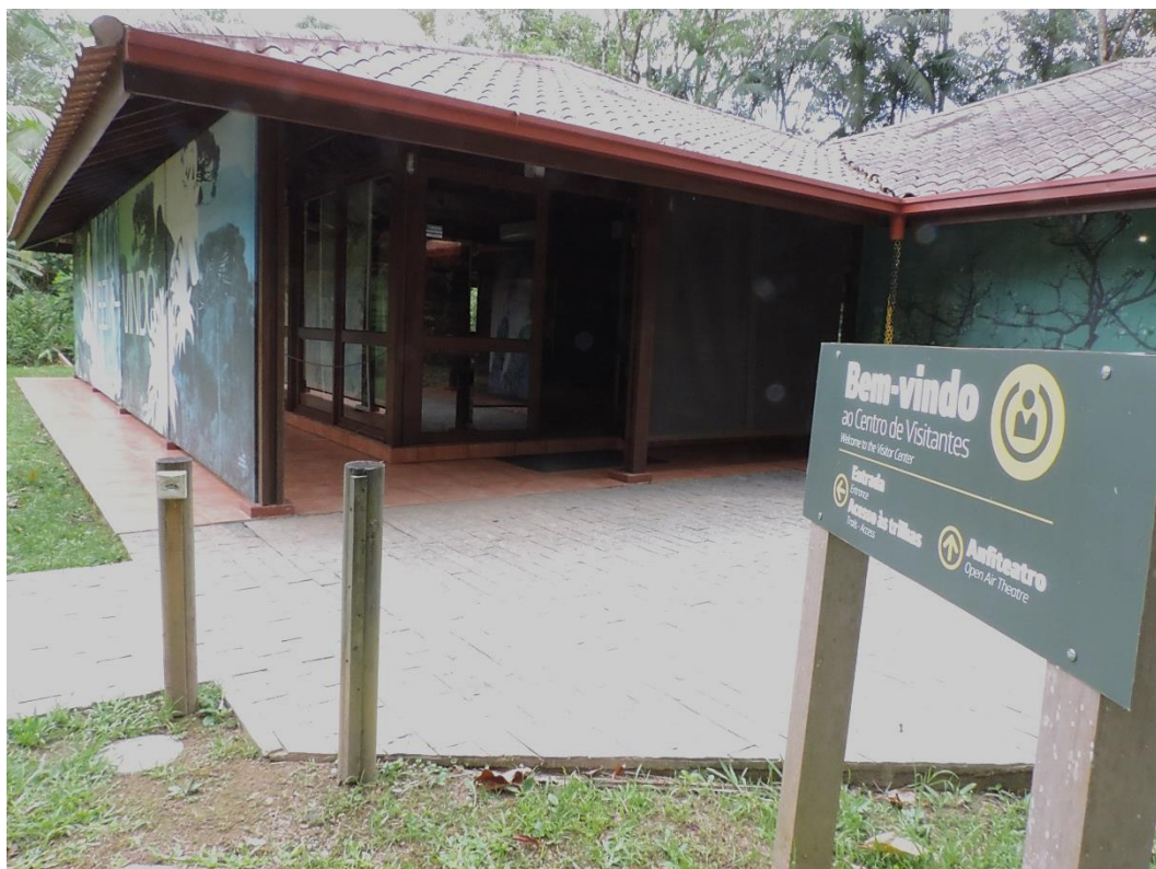
Figura 8: Vista da entrada do Centro de Visitantes.