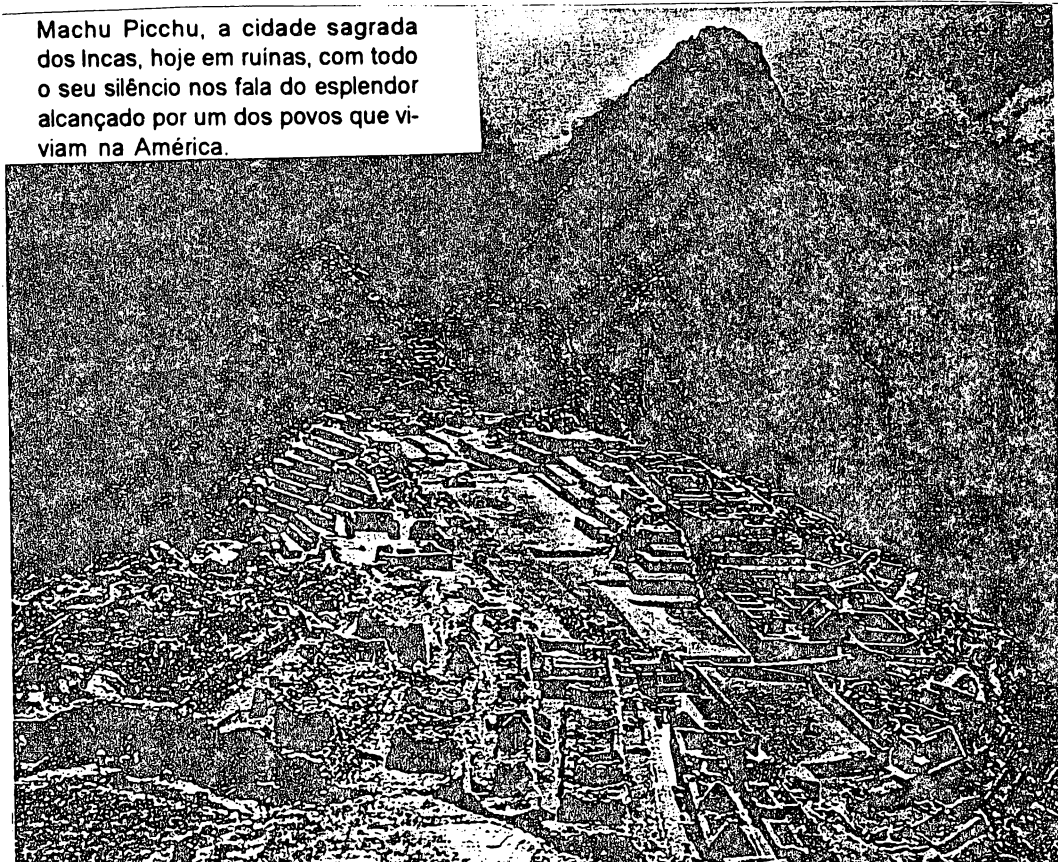
Machu Picchu, a cidade sagrada dos Incas, hoje em ruínas, com todo o seu silêncio nos fala do esplendor alcançado por um dos povos que viviam na América.

Médicos do Império dos Inca chegaram a fazer cirurgias, e os maias elaboraram calendários precisos, além de ter uma escrita em forma de hieróglifos. Com a invasão espanhola, muita coisa se perdeu e outro tanto está por conhecer. A escrita maia, por exemplo, somente agora começa a ser decifrada.