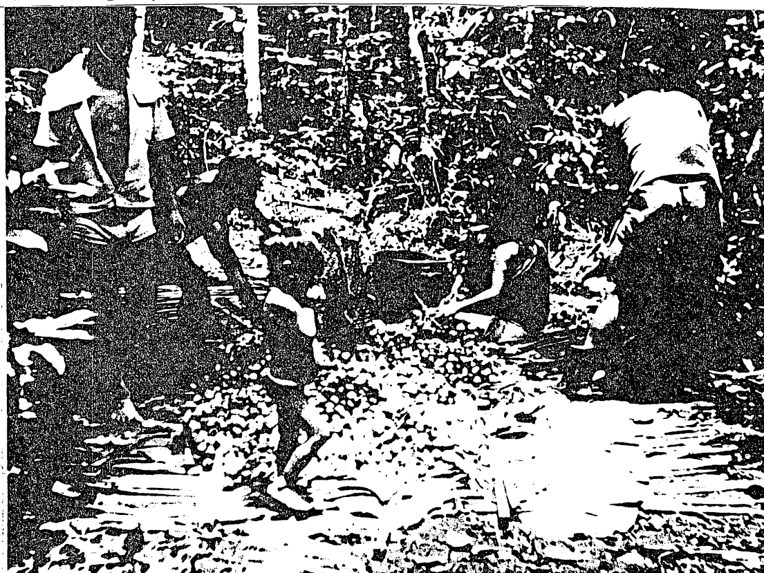
Colheita de pupunha por índios Marúbo (sudeste do Amazonas). Foto de J. C. Melatti, 1975.

Não se sabe quantos grupos indígenas existiam no Brasil quando se iniciou a conquista européia. Sabe-se entretanto que a população aborígine decresceu desde então rapidamente e não deixou de diminuir até hoje. Basta dizer que no ano de 1900 o número de grupos tribais no Brasil era de duzentos e trinta; entretanto, em 1957 era somente de cento e quarenta e três. Em apenas 57 anos, portanto, desapareceram 87 grupos tribais. (Ribeiro, 1957, p.18).