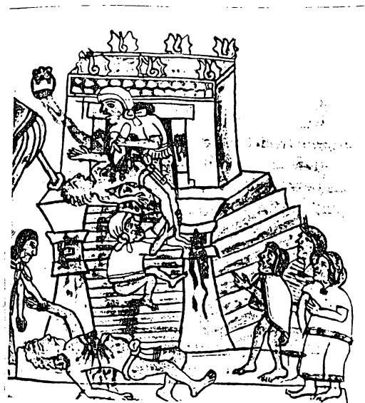
A íntima relação entre a religião e o militarismo asteca: o sacrifício de inimigos aos deuses.