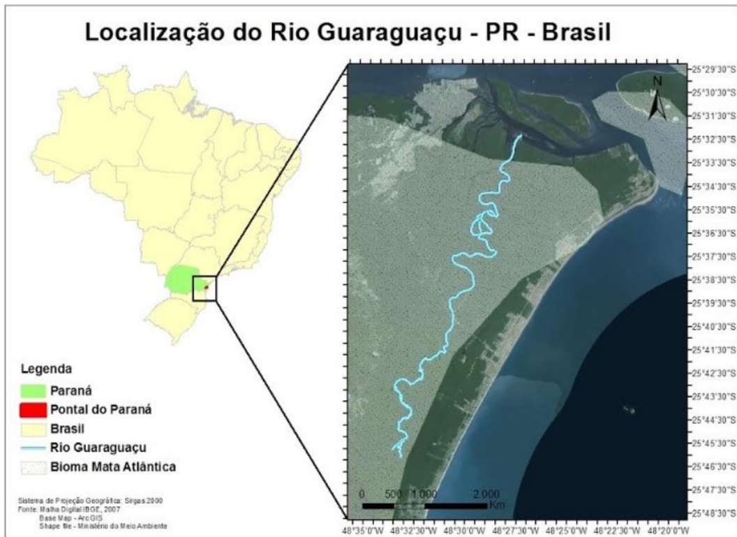
Figura 1: Localização do Rio Guaraguaçu.