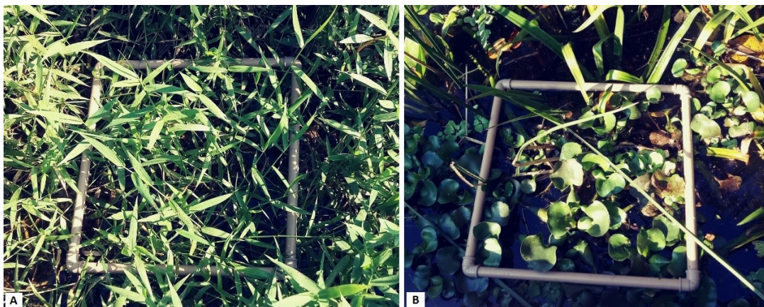
Figura 3: A) Parcela no banco com U. arrecta . B) Parcela no banco sem U. arrecta .