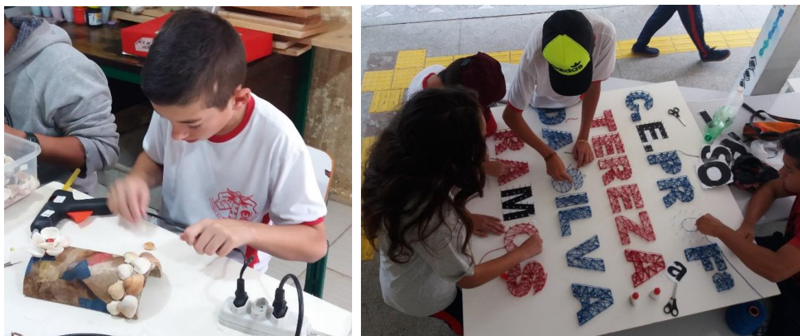
FIGURA 3 – PROJETO PIBID DE ARTESANATO CONTRATURNO COLÉGIO Prof. a TEREZA DA SILVA RAMOS – MATINHOS – PR, 2017.

A experiência acima se transformou em um projeto que foi apresentado na conclusão do meu PA 10 (Projeto de Aprendizagem), com o tema “ARTESANATO NA ESCOLA – Conhecer, criar e usufruir da arte a partir do Artesanato”.