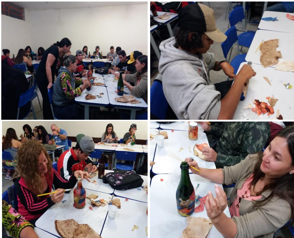
FIGURA 4 – OFICINA DE REUTILIZAÇÃO DE GARRAFAS E FILTRO DE CAFÉ – MATINHOS – PR, 2017.

Romão (2006) cita a proposta pedagógica freiriana, o educador como um animador cultural que cria condições para a aprendizagem dos seus educandos, desafiando-os na descoberta dos temas e desse modo, de novas palavras geradoras.