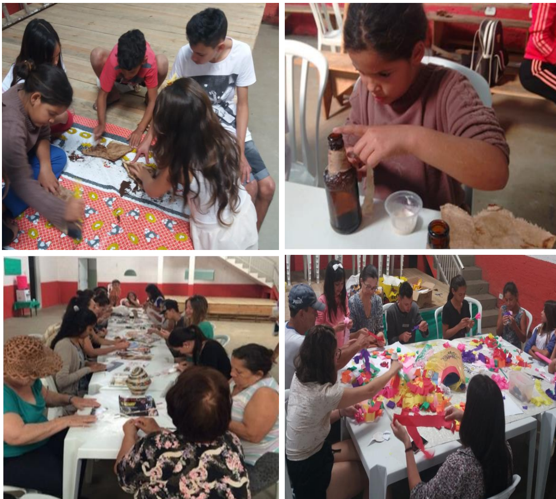
FIGURA 6 - PRODUÇÃO DE PEÇAS ARTESANAIS DA COMUNIDADE NA ASSOCIAÇÃO DA VILA NOVA CAIOBÁ – MATINHOS – PR, 2018.