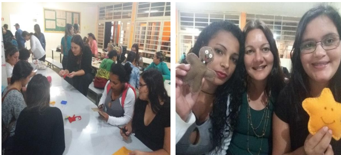
FIGURA 5 - OFICINA DE PEÇAS EM FELTRO – MATINHOS – PR, 2017.