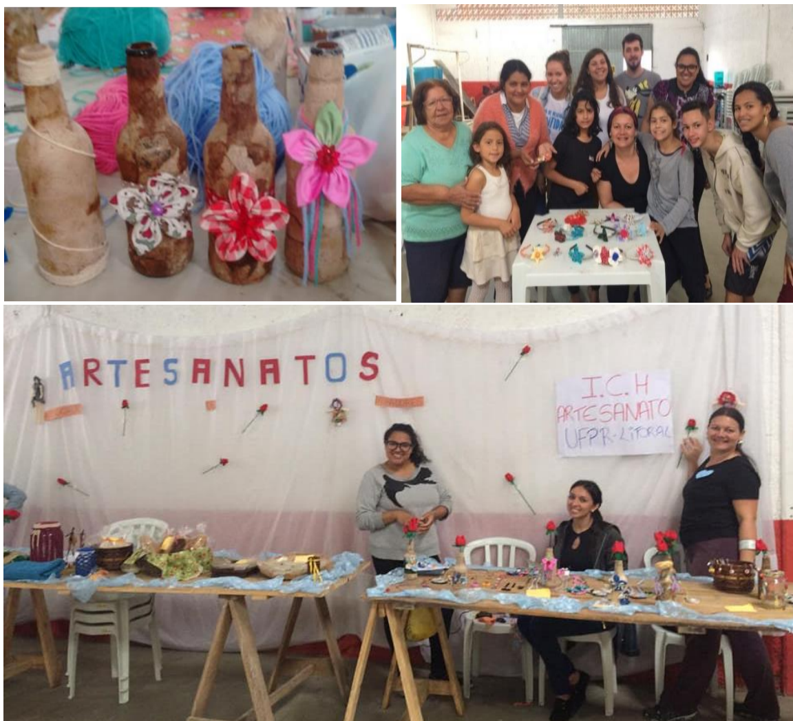
FIGURA 7 – PEÇAS ARTESANAIS PRONTAS E A FEIRA DA ASSOCIAÇÃO DA VILA NOVA CAIOBÁ – MATINHOS – PR, 2018.