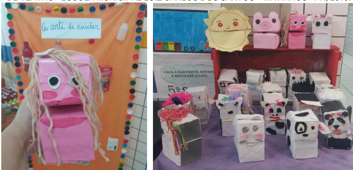
FIG.10 – FANTOCHES PRODUZIDOS PELOS ESTUDANTES NO ESTÁGIO OBRIGATÓRIO DE TEATRO– ESCOLA MUNICIPAL LUIZ CARLOS DOS SANTOS – MATINHOS –PR, 2019.

Esta artista me inspira principalmente na linguagem teatral, no qual reutilizo materiais para construção de fantoches para contação de histórias (FIG. 10).