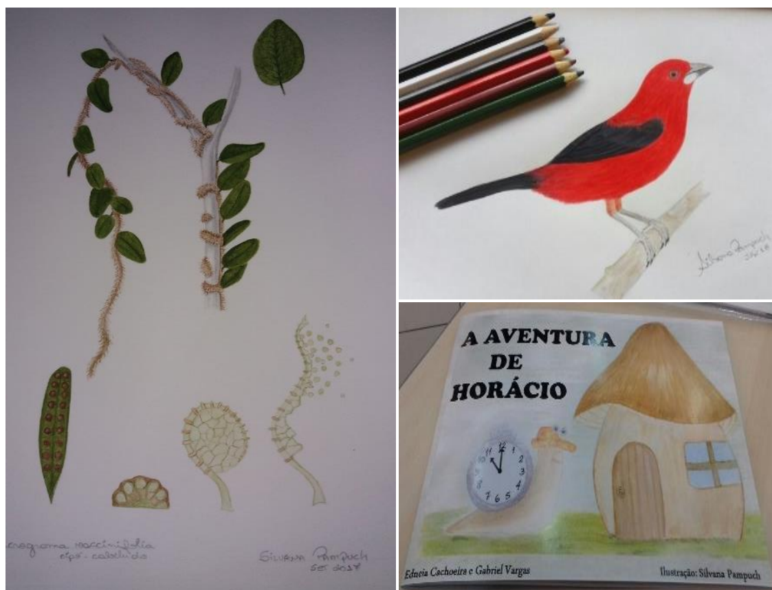
FIGURA 7 –1) ILUSTRAÇÃO CIENTÍFICA BOTÂNICA; 2) ILUSTRAÇÃO DE AVES; 3) LIVRO “A AVENTURA DE HORÁCIO”.

Todos os projetos que participei, durante minha vivência acadêmica, foram oferecidos pela UFPR – Setor Litoral. Os cursos e projetos fomentaram as minhas práticas artísticas na educação formal e não formal. Atualmente, reconheço os materiais do artesanato - barbantes, linhas, agulhas, etc. - como referências presentes em minhas práticas de arte e educação. As experiências com os projetos me fizeram pensar sobre as possibilidades de relação entre linguagens, elementos, suportes, estímulos e temas na elaboração das minhas práticas e ações educativas.