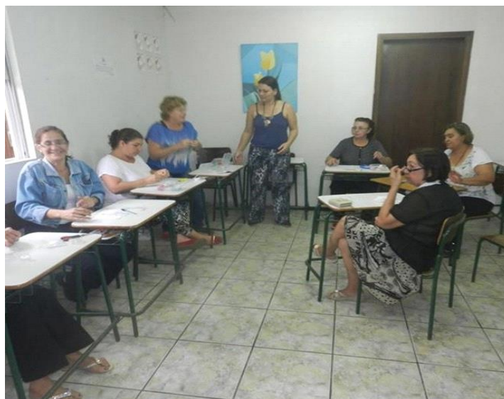
FIGURA 1 – CURSOS NA CASA DE CULTURA DE MATINHOS – PR, 2014.