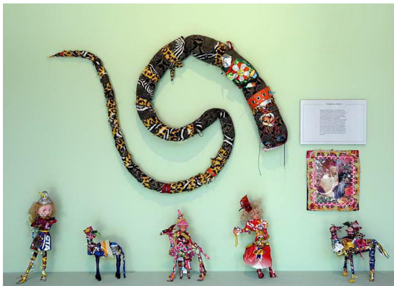
FIG.9 - OBRAS DA ARTISTA EFIGÊNIA ROLIN.