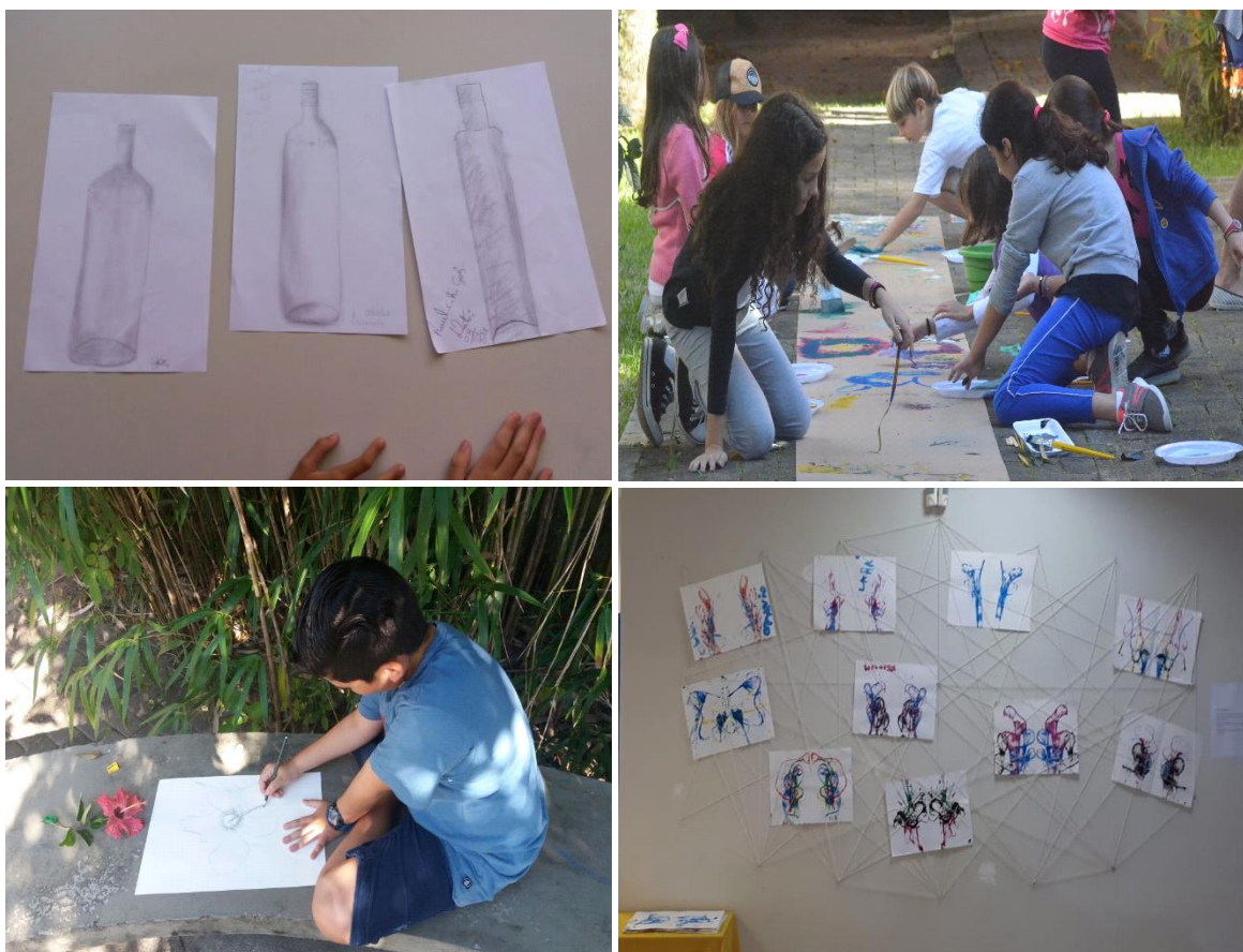
FIGURA 8 – PROJETO CONHECENDO E VIVENCIANDO AS ARTES VISUAIS – MATINHOS – PR, 2017/2018.