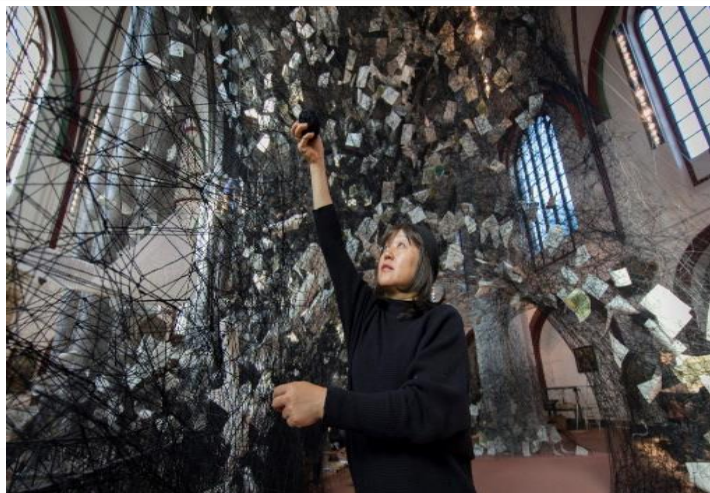
FIG. 11 – ARTISTA CHIHARU SHIOTA.

espécie de teia gigante, nas quais utiliza linhas (barbantes) e objetos como janelas, camas, sapatos velhos que são empilhados e/ou amarrados e pendurados no espaço expositivo (FIG.12). Suas obras têm como objetivo estimular o público a refletir sobre a relação entre os objetos, as possíveis conexões entre eles.