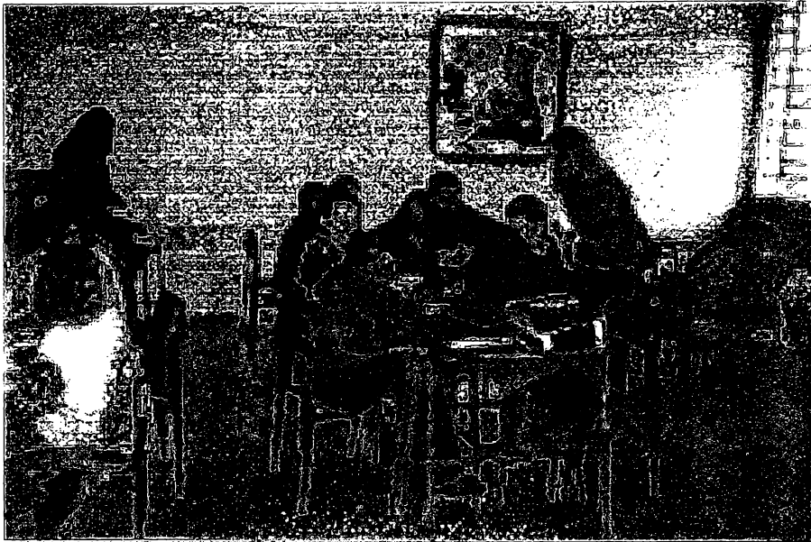
FIGURA 3 – CRIANÇAS EM ATIVIDADE

Em relação ao foco deste estudo, a questão da prática de avaliação da aprendizagem realizada nas classes envolvidas na pesquisa, foi solicitado a cada uma das professoras que respondesse a um questionário (anexo 2), buscando identificar o significado, os procedimentos e as finalidades de tal prática.