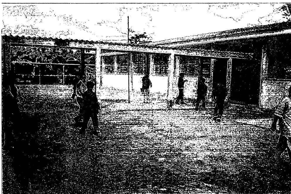
FIGURA 2 – ESCOLA MUNICIPAL JOAQUIM GABRIEL DE MIRANDA

Esta escola situa-se numa localidade chamada Cubatão, distante do centro de Guaratuba cerca de 70 km. Ali atuam oito professoras leigas, em todas as salas de primeira à quarta séries do ensino fundamental. O prédio, muito bem construído, possui toda a infra estrutura necessária e também direção e equipe pedagógica completa.