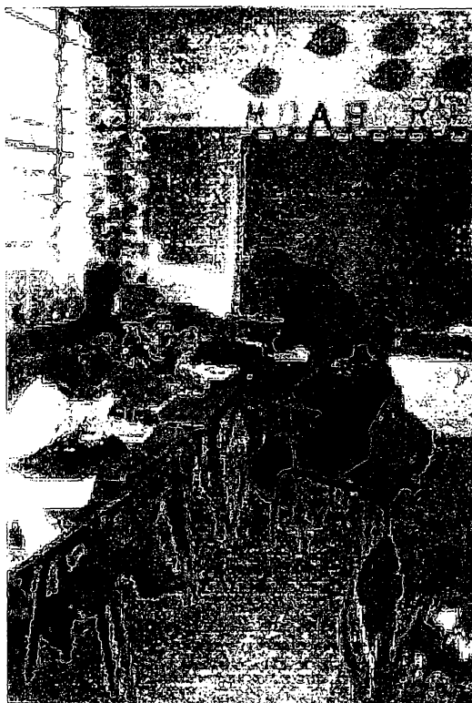
FIGURA 4 – SALA DE AULA

Segundo MARLI, 1996, citando PERRENOUD: “Trata-se de algo que vai romper com a indiferença às diferenças, rompendo um dos mecanismos mais eficazes de produção do fracasso escolar”.