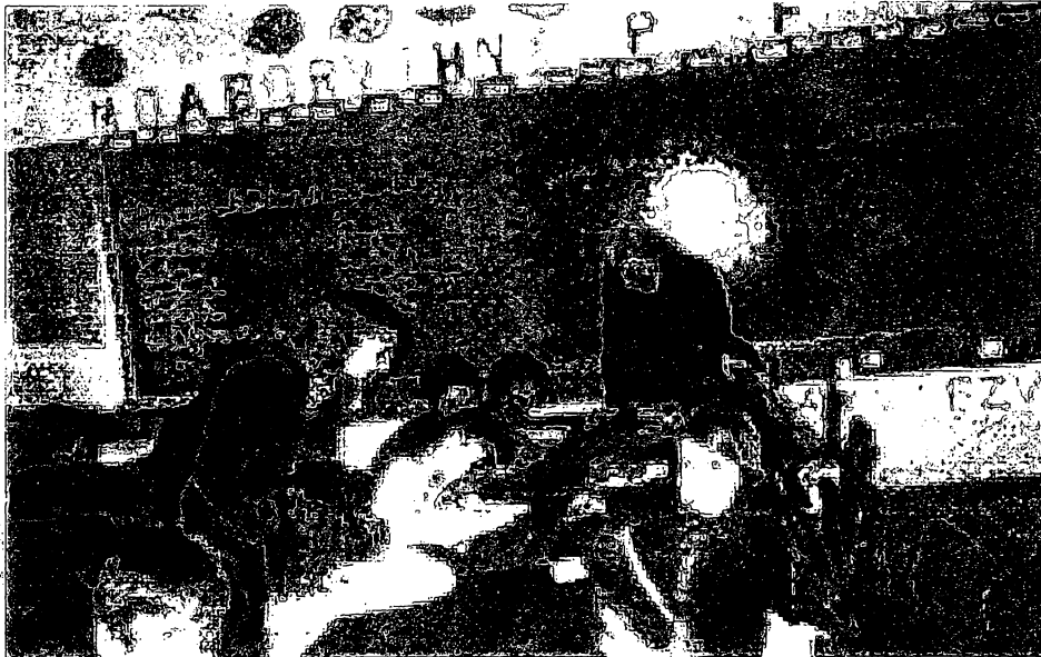
FIGURA 5 – CRIANÇAS EM ATIVIDADE n.º 2