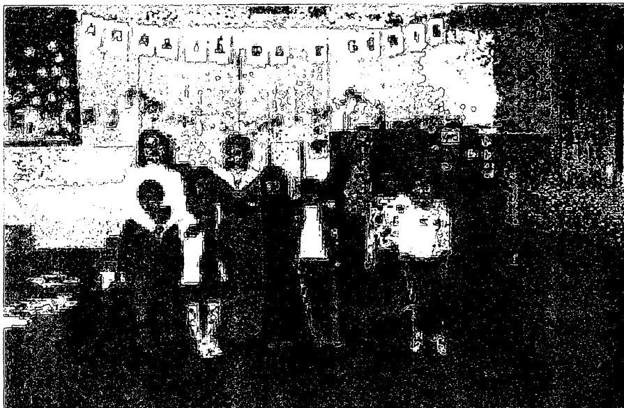
FIGURA 1 – ESCOLA MUNICIPAL MÁXIMO JAMUR

Trata-se de uma escola bem estruturada, tanto no seu espaço físico, como no pedagógico. Possui direção e coordenação pedagógica. Situa-se em um bairro próximo ao centro de Guaratuba, na localidade chamada Caieiras, que é uma aldeia de pescadores.