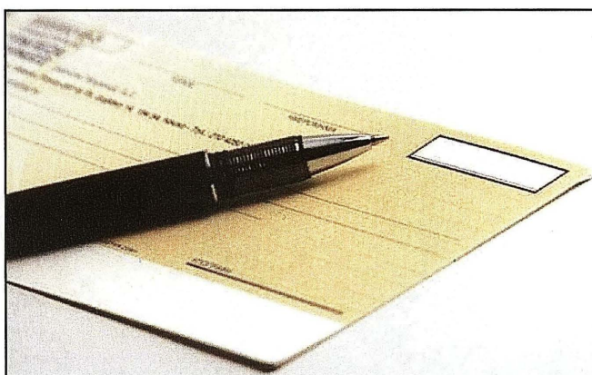
Figura 1 – Cheque Especial

A utilização está sujeita ao pagamento de juros proporcionais ao valor utilizado durante o mês. Os encargos como juros e IOF, são calculados diariamente e cobrados mensalmente. As condições de utilização, taxas, prazo, valor, garantias, vencimento antecipado, multas, renovação automática, são estabelecidas em contrato assinado entre o cliente e o banco. O banco poderá mudar unilateralmente essas condições, mediante aviso ao cliente. A utilização racional do cheque especial deve restringir-se a necessidades eventuais e de curtíssimo prazo, como pode ser visto na tabela acima.