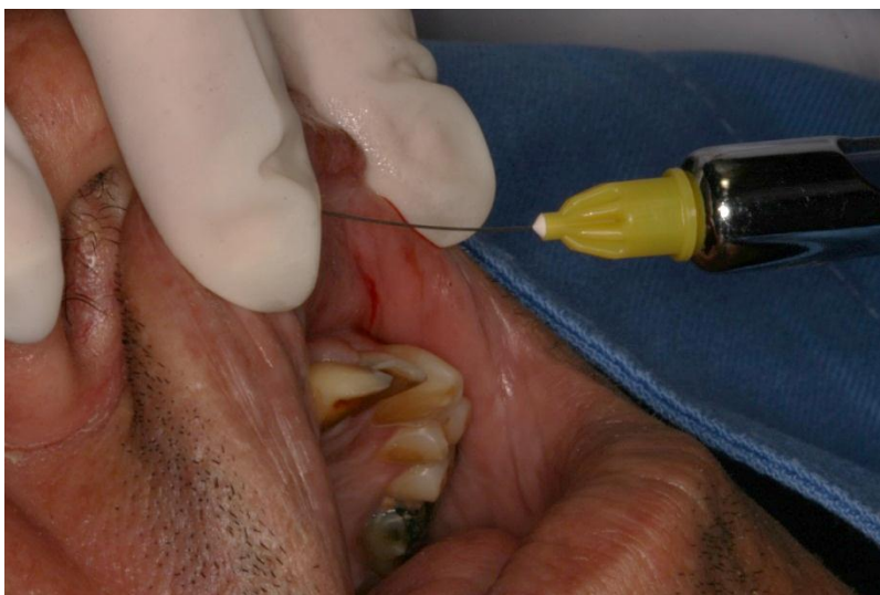
Figura 1 – Anestesia local no lábio superior.

O recurso da anestesia local evoluiu muito e, os anestésicos locais atualmente são fármacos seguros, com raros relatos de reações adversas graves. Estima-se que no Brasil sejam realizadas anualmente de 250 a 350 milhões de anestésias locais.