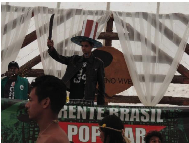
FIGURA 18 - 16º JORNADA DE AGROECOLOGIA: REPRESENTAÇÃO DA VIOLÊNCIA CONTRA OS POVOS TRADICIONAIS

A figura 17 mostra o chapéu com as cores da bandeira norte americana, representando a hegemonia de poder que os Estados Unidos exercem frente ao Brasil, que estava representado pelas cores verde e amarelo.