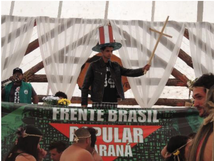
FIGURA 19 - 16º JORNADA DE AGROECOLOGIA: REPRESENTAÇÃO DA IGREJA E SEU PAPEL DE COLONIZAÇÃO IDEOLÓGICA

A figura 18 mostra a espada como símbolo da violência enfrentada pelas populações que aqui viviam e vivem, representam a força exercida pelos Estados Unidos perante o mundo e ao Brasil.