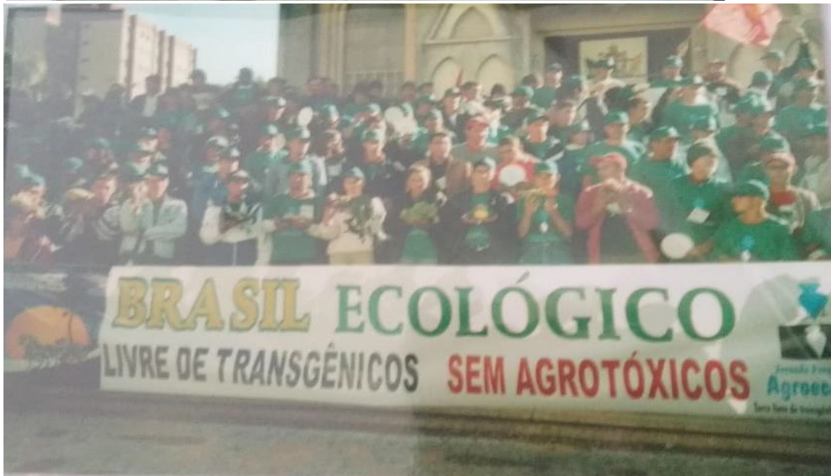
7º Jornada de Agroecologia