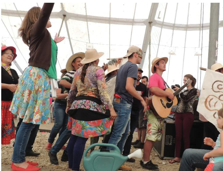
FIGURA 15 - 16º JORNADA DE AGROECOLOGIA: A DANÇA E A CULTURA COMO ELEMENTOS DO CAMPESINATO

Na Figura 14 aparece a madeira sendo utilizada como matéria primária da vida camponesa, à medida que ela é trabalhada, esculpida e transformada em ferramentas, casas, móveis e outros instrumentos importantes ao campesinato.