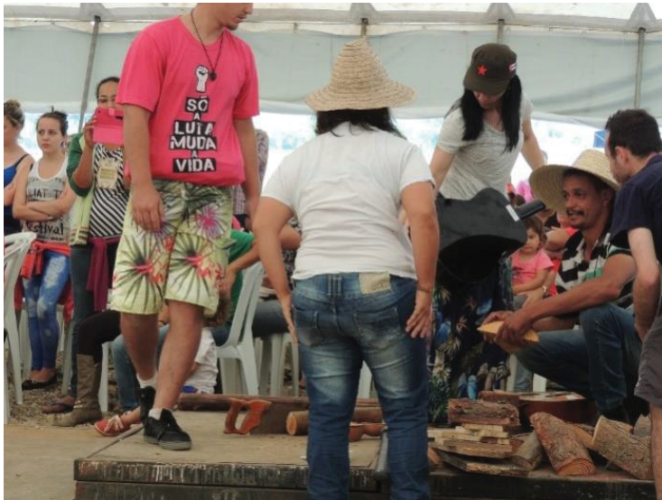
FIGURA 14 - 16º JORNADA DE AGROECOLOGIA: A MADEIRA COMO IMPORTANTE ELEMENTO PARA O CAMPESINATO