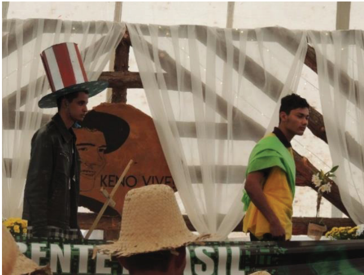
FIGURA 17 - 16º JORNADA DE AGROECOLOGIA: REPRESENTAÇÃO DO PODER NORTE AMERICANO FRENTE AO BRASIL