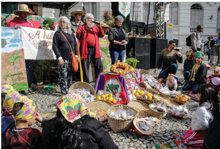
FIGURA 24 - BENÇÃO DAS SEMENTES E DO PÃO REALIZADO POR LEONARDO BOFF

A mística das sementes é a contribuição efetiva do camponês para o crescimento e o fortalecimento da agroecologia, é a afirmação de sua ideologia e projeto de mundo. Portanto, essa mística tem como sentido simbólico e político a conservação e valorização do saber tradicional e do modo de vida camponês e agroecológico. A mística das sementes é a partilha em seu sentido mais bonito, isso ficou evidente na 17ª Jornada de agroecologia, na qual houve a partilha das sementes, das mudas e do pão.