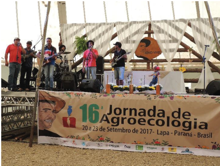
FIGURA 07 - PALCO DA 16ª JORNADA DE AGROECOLOGIA