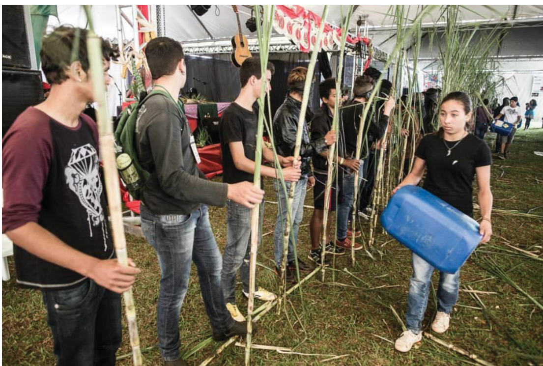
14º Jornada de Agroecologia