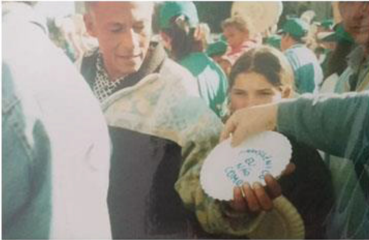
FIGURA 04 - 6° JORNADA DE AGROECOLOGIA: QUEIMA SIMBÓLICA DOS PRATOS DE TRANSGÊNICOS