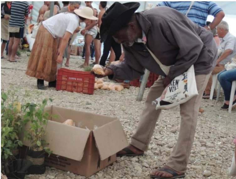
FIGURA 26 - AGRICULTOR OBSERVANDO A VARIEDADE DE SEMENTES PARA A TROCA