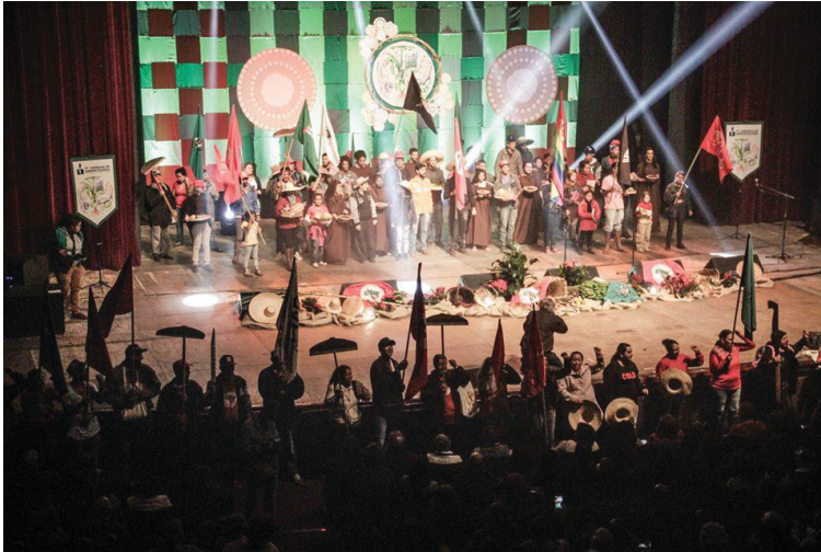
FIGURA 22 - 17° JORNADA DE AGROECOLOGIA