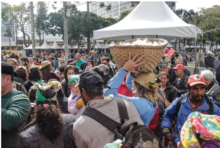
FIGURA 25 - DISTRIBUIÇÃO DAS SEMENTES NA PRAÇA SANTOS ANDRADE

A mística das sementes da 17ª Jornada foi um momento bastante forte, o pão e as sementes foram compartilhados entre pessoas que passavam pela praça e pararam para ver o que estava acontecendo, os camponeses, pessoas em situação de rua, crianças, adultos, idosos, homens, mulheres, etc. Ou seja, sem distinção de classe, cor ou gênero, apenas o pão sendo compartilhado, passando de mãos em mãos.