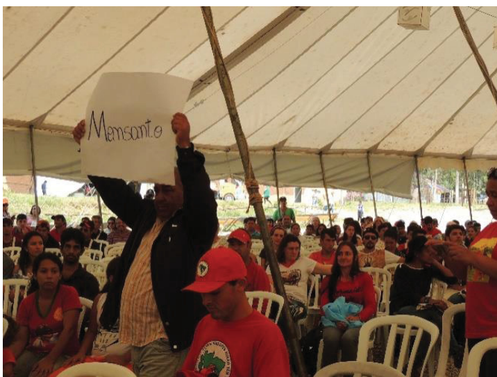
FIGURA 08 - 16ª JORNADA DE AGROECOLOGIA: CARTAZES REPRESENTANDO AS GRANDES EMPRESAS DO AGRONEGÓCIO

A figura 07 acima demonstra justamente o que a passagem do caderno de campo diz, onde o palco é todo construído para rememorar a imagem do Keno e a banda traz a animação, emoção, hino e gritos de ordem tão importantes para acionar as emoções. Esse palco de abertura faz a preparação do público para receber a mística, que se inicia com a entrada de diversos cartazes com o nome de grandes empresas do agronegócio como Monsanto, Syngenta, entre outros, como mostrado na figura 08 abaixo.