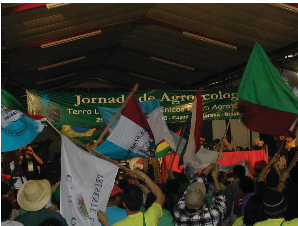
6° Jornada de Agroecologia