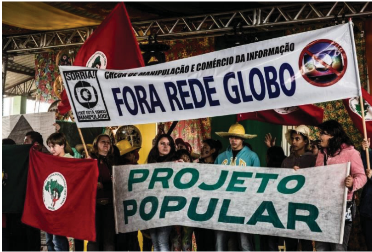
FIGURA 06 - 14° JORNADA DE AGROECOLOGIA: MÍSTICA QUESTIONANDO OS MEIOS DE COMUNICAÇÃO DE MASSA