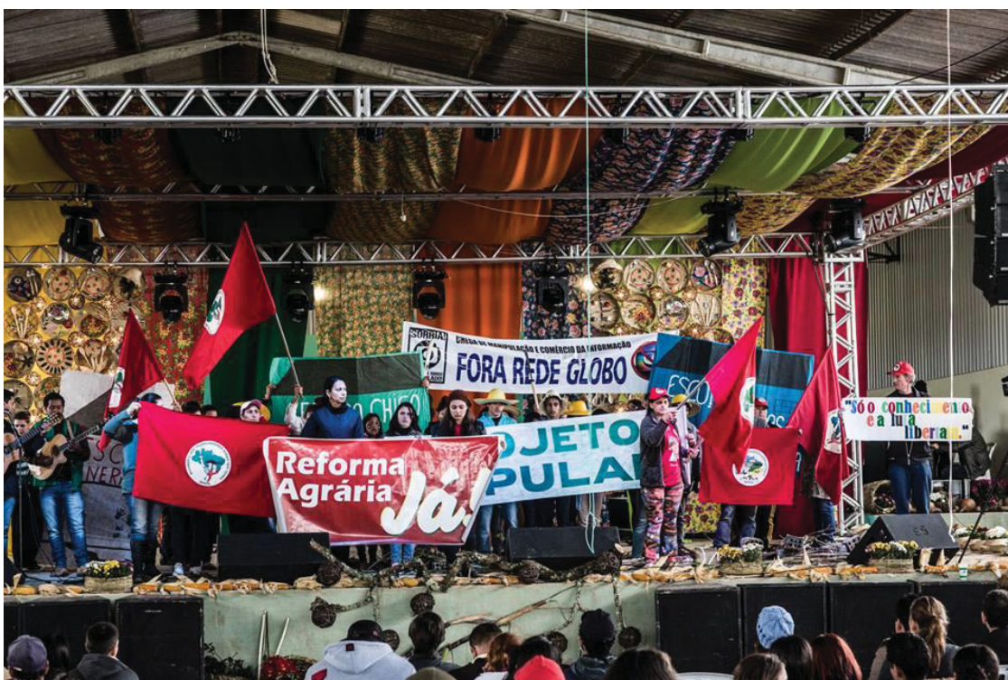
15° Jornada de Agroecologia