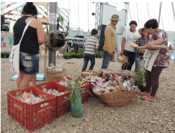
FIGURA 27 - AGRICULTORES OBSERVANDO A VARIEDADE DE SEMENTES PARA A TROCA

A figura 26 e a figura 27 demonstram a curiosidade dos agricultores antes da troca das sementes, essas imagens são da 16ª Jornada de agroecologia, onde as sementes foram divididas para serem distribuídas por região, fazendo com que cada região tivesse acesso a mesma quantidade e tipos de sementes. Esse foi o momento mais esperado durante o último dia da Jornada, a ansiedade em ter sementes diferentes, ou que haviam sido perdidas há anos eram muito grandes.