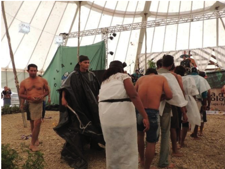
FIGURA 20 - 16º JORNADA DE AGROECOLOGIA: AS EXPLORAÇÕES SOFRIDAS PELOS POVOS NO BRASIL