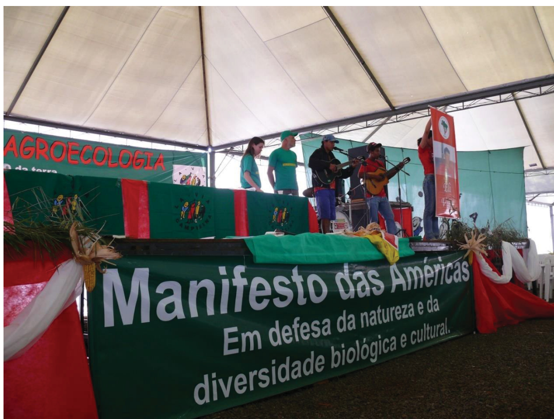
8° Jornada de Agroecologia