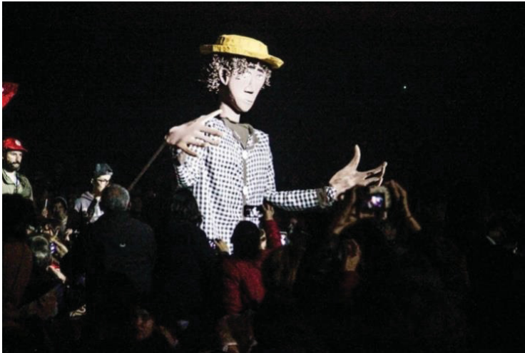
FIGURA 21 - 17º JORNADA DE AGROECOLOGIA: BONECOS GIGANTES REPRESENTANDO A GRANDEZA DOS CAMPONESES

(aproximadamente 10), entoaram gritos de ordem como “terra livre de transgênicos e sem agrotóxicos” .