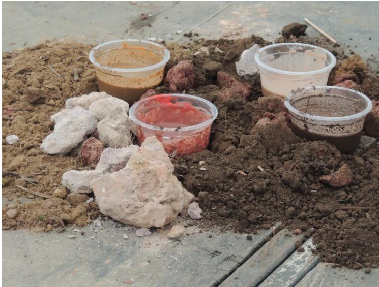
FIGURA 12 - 16º JORNADA DE AGROECOLOGIA: A TERRA COMO ELEMENTO ESSENCIAL DO CAMPESINATO