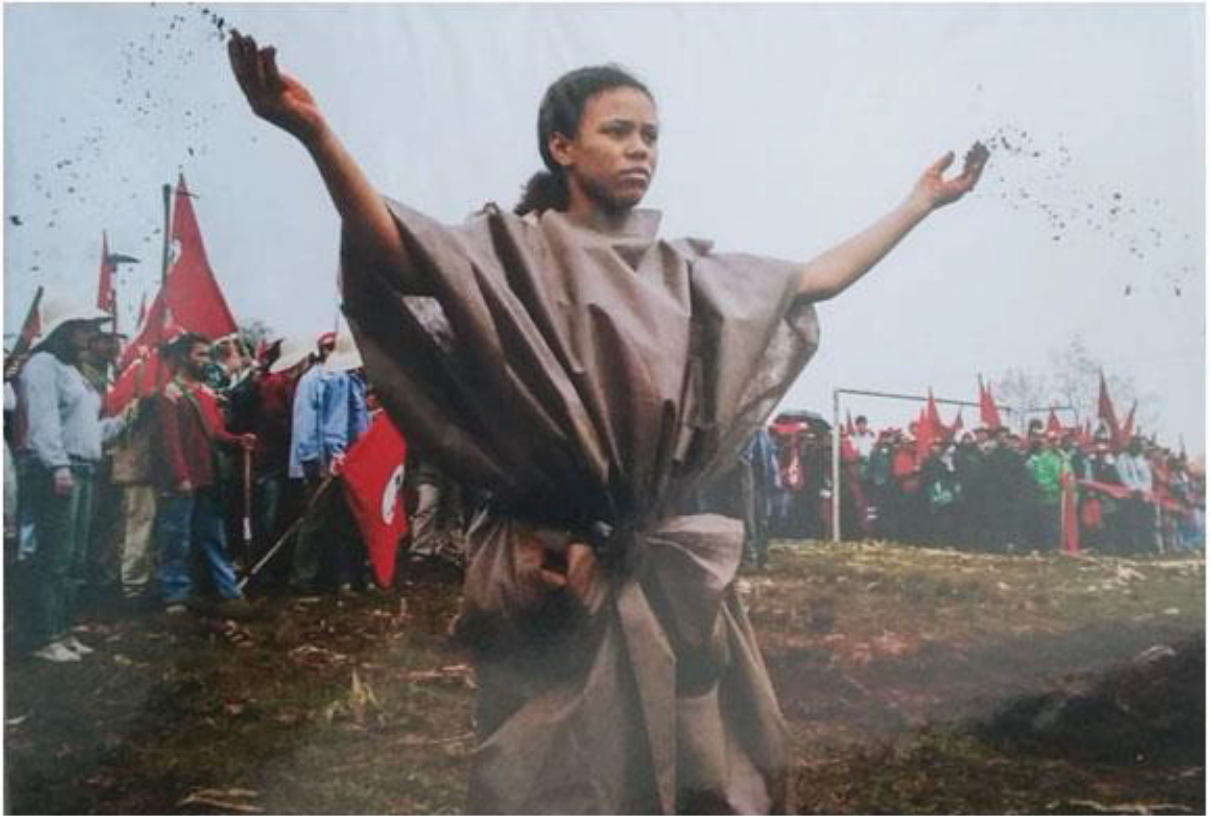
12° Jornada de Agroecologia