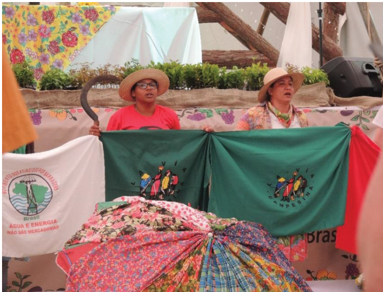
FIGURA 16 - 16° JORNADA DE AGROECOLOGIA: A LUTA COMO ELEMENTO ESSENCIAL DO CAMPESINATO

A figura 15 traz a festa, o lazer, a junção de todo trabalho camponês transformado em arte, demonstra um momento de descontração da mística, onde a dança toma conta da tenda principal da 16° Jornada de agroecologia e arranca sorrisos de quem assiste e vivencia a mesma.