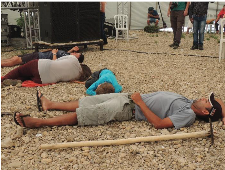
FIGURA 09 - 16° JORNADA DE AGROECOLOGIA: MASSACRE VIVENCIADO PELO MST QUE RESULTA NA MORTE DO KENO

Posteriormente ela simula o enfrentamento do povo camponês com essas empresas, representando o enfrentamento do projeto político e ideológico do movimento, com o projeto do capital. É nesse momento que o massacre cometido por essas grandes empresas sobre os sem-terra é demonstrado, e onde a representação se torna mais real. Na figura 09 abaixo, é possível ver os integrantes do movimento caídos após o enfrentamento, em sinal dos companheiros que foram mortos na luta.