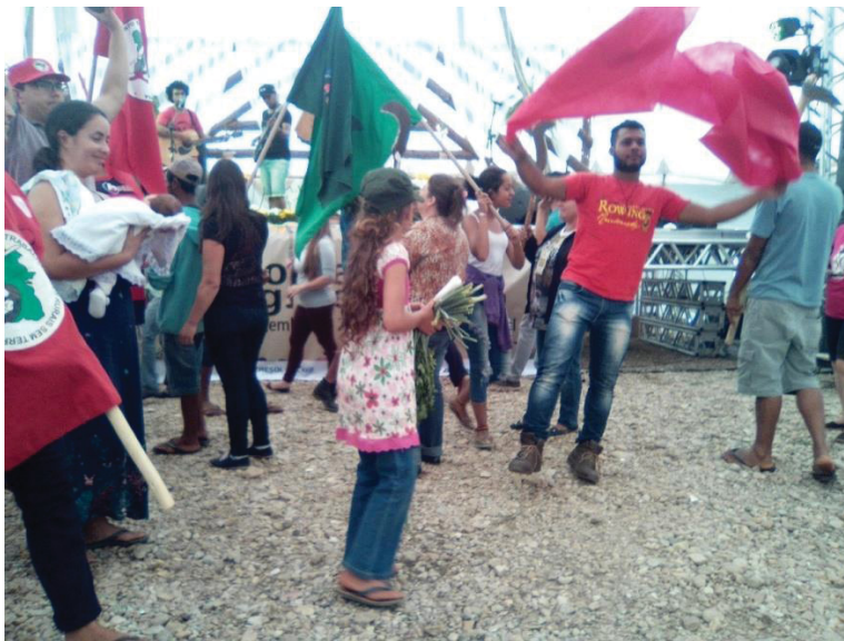
FIGURA 01 - MÍSTICA DE ABERTURA DA 16ª JORNADA DE AGROECOLOGIA