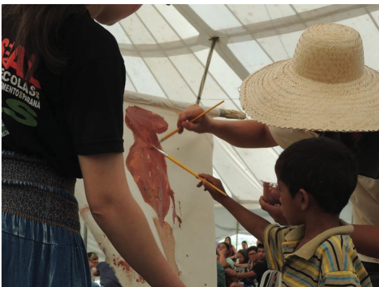
FIGURA 13 - 16º JORNADA DE AGROECOLOGIA: PINTURA SENDO REALIZADA A PARTIR DA TERRA

A figura 12 mostra como a mística trouxe a representação da terra para além da produção de alimentos, neste caso a terra é tinta, é arte e serve de inspiração para o campesinato, na figura 13 a terra é utilizada para pintar, crianças, homens e mulheres empunhavam pinceis e pintavam elementos da produção camponesa.