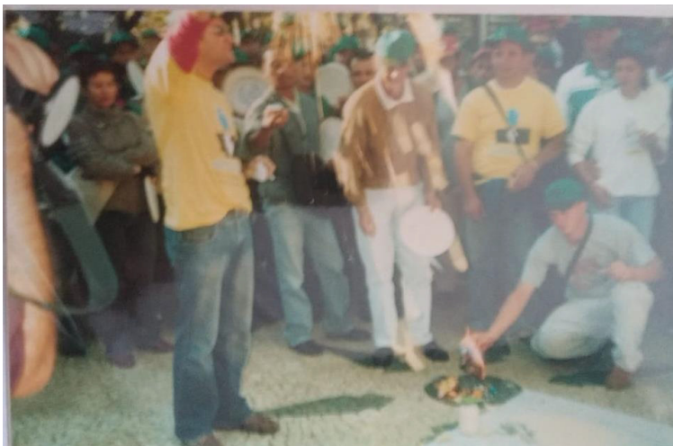
FIGURA 05 - 6° JORNADA DE AGROECOLOGIA: QUEIMA SIMBÓLICA DOS PRATOS DE TRANSGÊNICOS