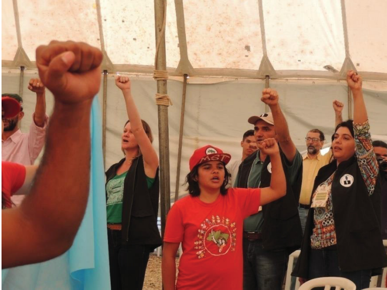
FIGURA 02 - GRITO DE ORDEM NA ABERTURA DA 16ª JORNADA DE AGROECOLOGIA