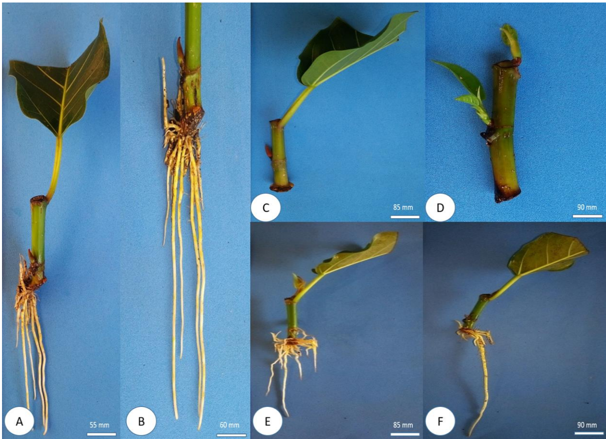
FIGURA 4: Ficus enormis : (A) PROPÁGULO ENRAIZADO; (B) DETALHE DO SISTEMA RADICIAL DO PROPÁGULO; (C) PROPÁGULO VIVO E BROTADO; (D) PROPÁGULO VIVO, BROTADO E QUE MANTEVE FOLHA; (E) PROPÁGULO ENRAIZADO COM BROTAÇÃO; (F) PROPÁGULO ENRAIZADO QUE MANTEVE FOLHA, CURITIBA-PR.