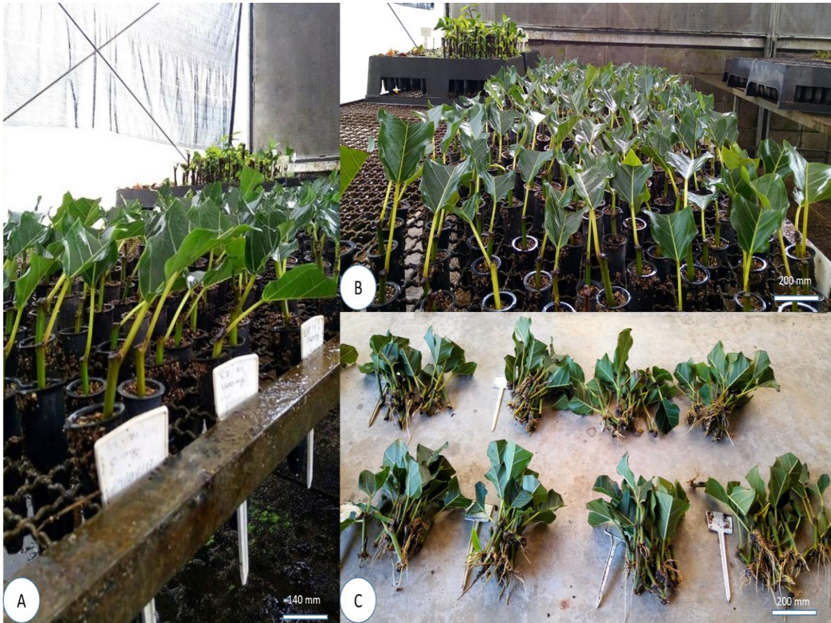
FIGURA 2: Ficus enormis : (A) MINIESTACAS AVALIADAS ÁPOS 60 DIAS; (B) DISPOSIÇÃO DO EXPERIMENTO EM CASA DE VEGETAÇÃO; (C) DETALHE DA AVALIAÇÃO DO EXPERIMENTO ÁPOS 60 DIAS, CURITIBA-PR.