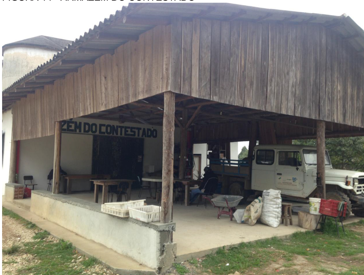
FIGURA 14 - ARMAZÉM DO CONTESTADO