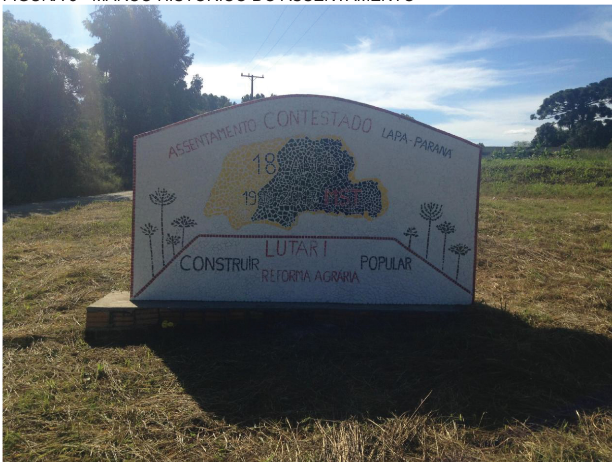
FIGURA 3 - MARCO HISTÓRICO DO ASSENTAMENTO