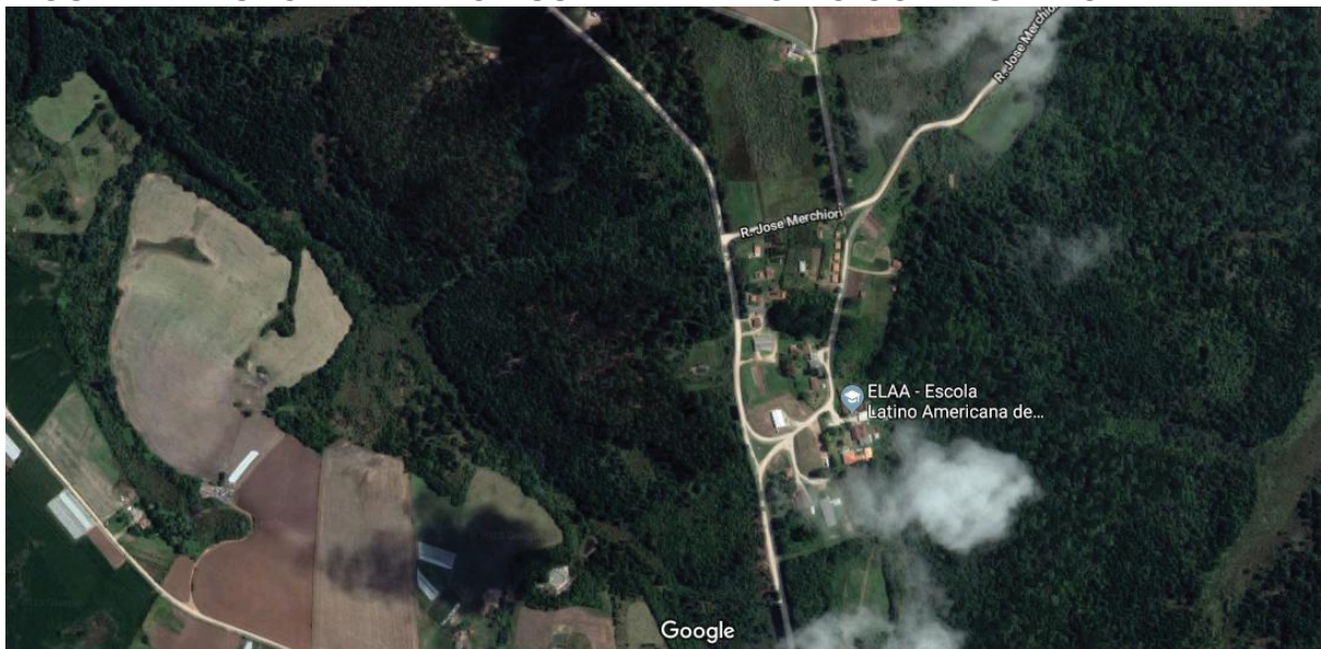
FIGURA 2 - VISÃO AÉREA DO ASSENTAMENTO DO CONTESTADO

Como o desenrolar para a efetivação dessa desapropriação foi moroso, o MST partiu para a ocupação da “fazenda”. Em 9 de fevereiro de 1999, com aproximadamente 40 famílias deu-se o primeiro momento da ocupação para garantir e acelerar o processo junto ao Instituto Nacional de Colonização e Reforma Agrária ( INCRA ) com fins de reconhecimento e efetivação do território em assentamento.