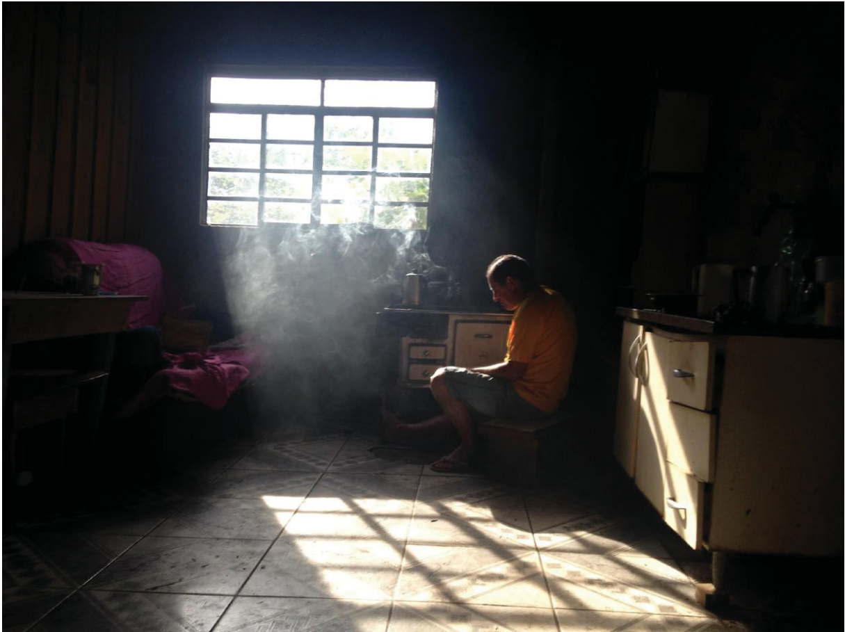
FIGURA 7 - O SOSSEGO DO LAR E O MATE