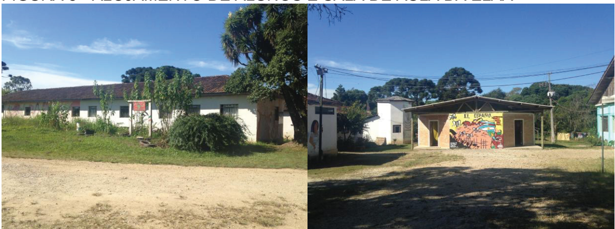
FIGURA 5 - ALOJAMENTO DE ALUNOS E SALA DE AULA DA ELAA

Com a obtenção um novo espaço para os alunos, o Casarão passou por um período de reforma e, ao ser reinaugurado, a coordenação geral do assentamento destinou o local como exclusivo para os eventos culturais como cinema, teatro e oficinas de arte.