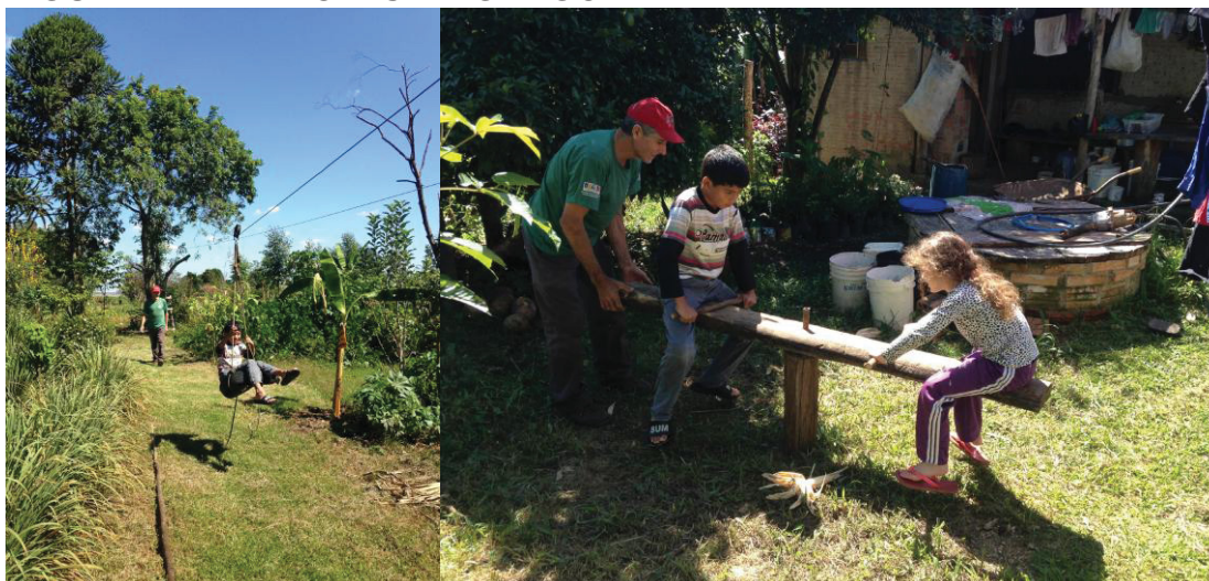
FIGURA 11 - A TIROLESA E GANGORRA