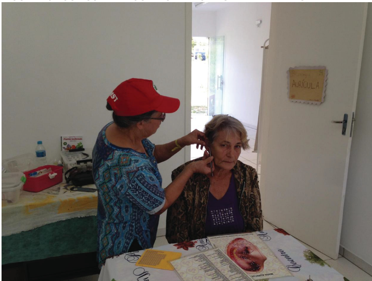
FIGURA 18 - OS ASSENTADOS E AS MEDICINAS ALTERNATIVAS