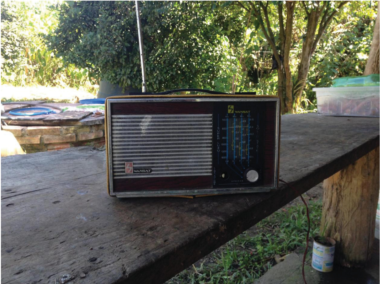
FIGURA 10 - NA ERA DO RÁDIO