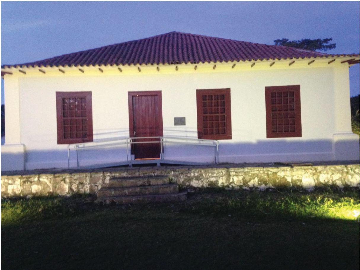
FIGURA 4 - CASARÃO HISTÓRICO DA FAZENDA SANTA AMÉLIA

O Assentamento do Contestado estabeleceu como sua base central a “Casa-Sede” 10 e a área que a circunda. Comumente nomeada pelos assentados como “Casarão” (FIGURA 4), o mesmo foi construído no séc. XIX e teve sua arquitetura preservada, composta pelo estilo colonial rural português, cujo modelo se difundiu nas moradas da região.