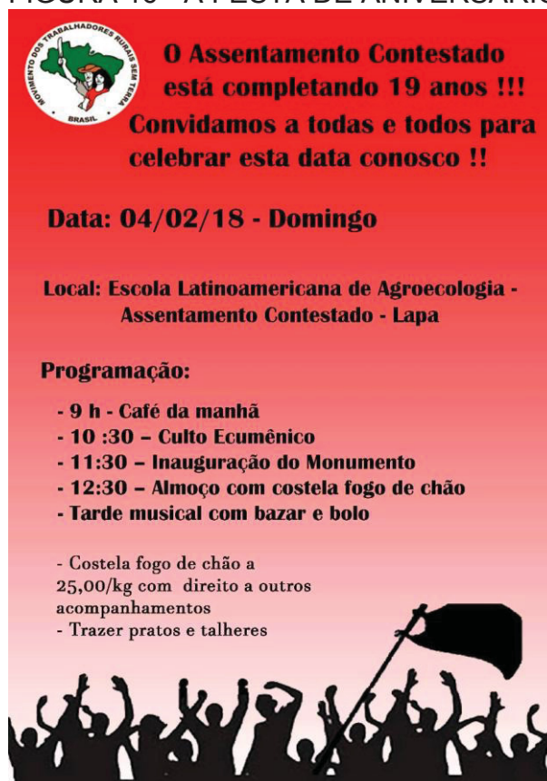
FIGURA 16 - A FESTA DE ANIVERSÁRIO

participação de quase a totalidade das famílias assentadas, somadas às pessoas de fora que, de uma maneira ou de outra, se envolvem com a questão camponesa e do MST.