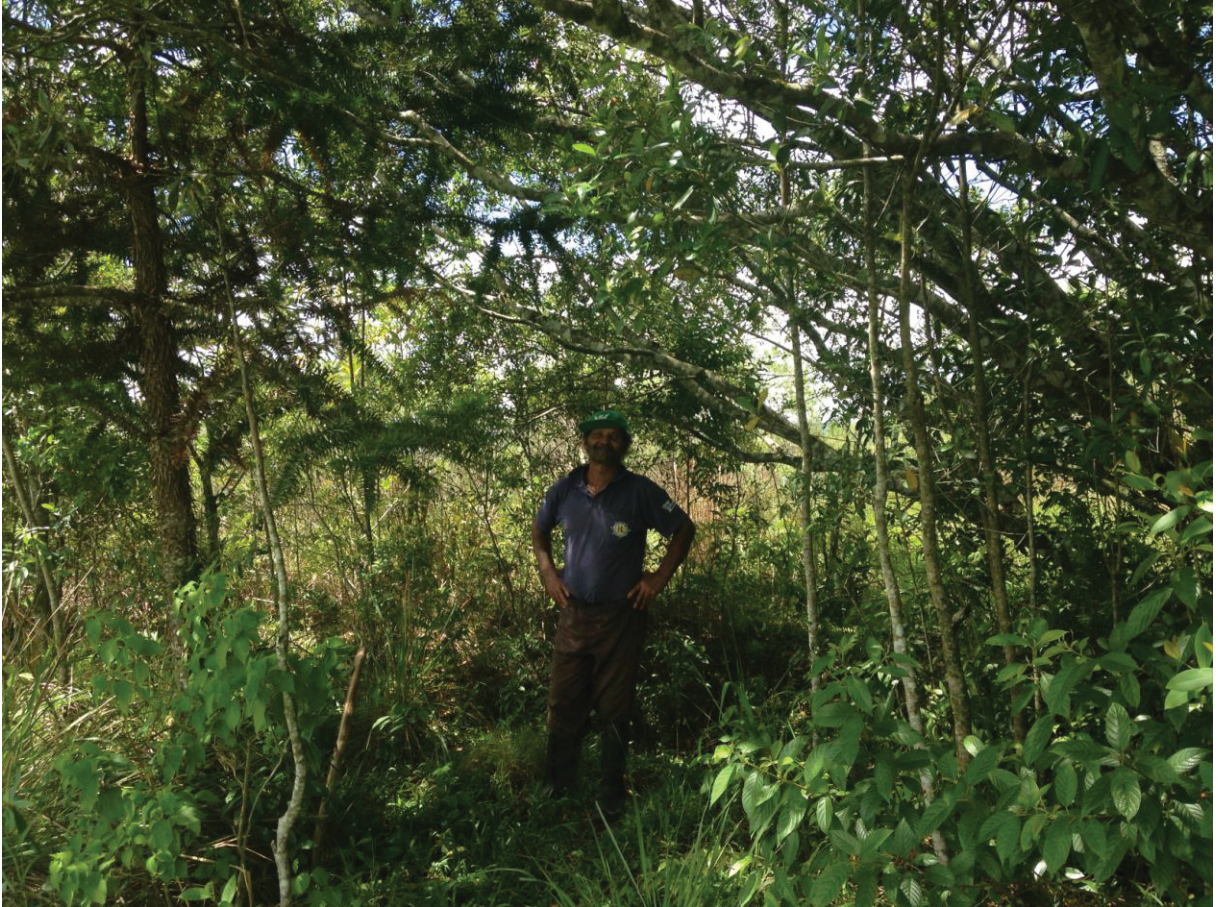
FIGURA 9 - NA SOMBRA DA NATUREZA RECONSTRUÍDA