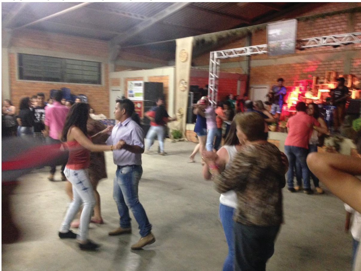
FIGURA 15 - O BAILE CAMPONÊS