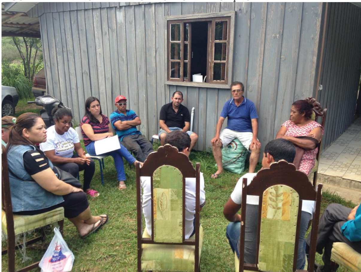
FIGURA 17 - TEMPO PARA REUNIÃO E CERTIFICAÇÃO