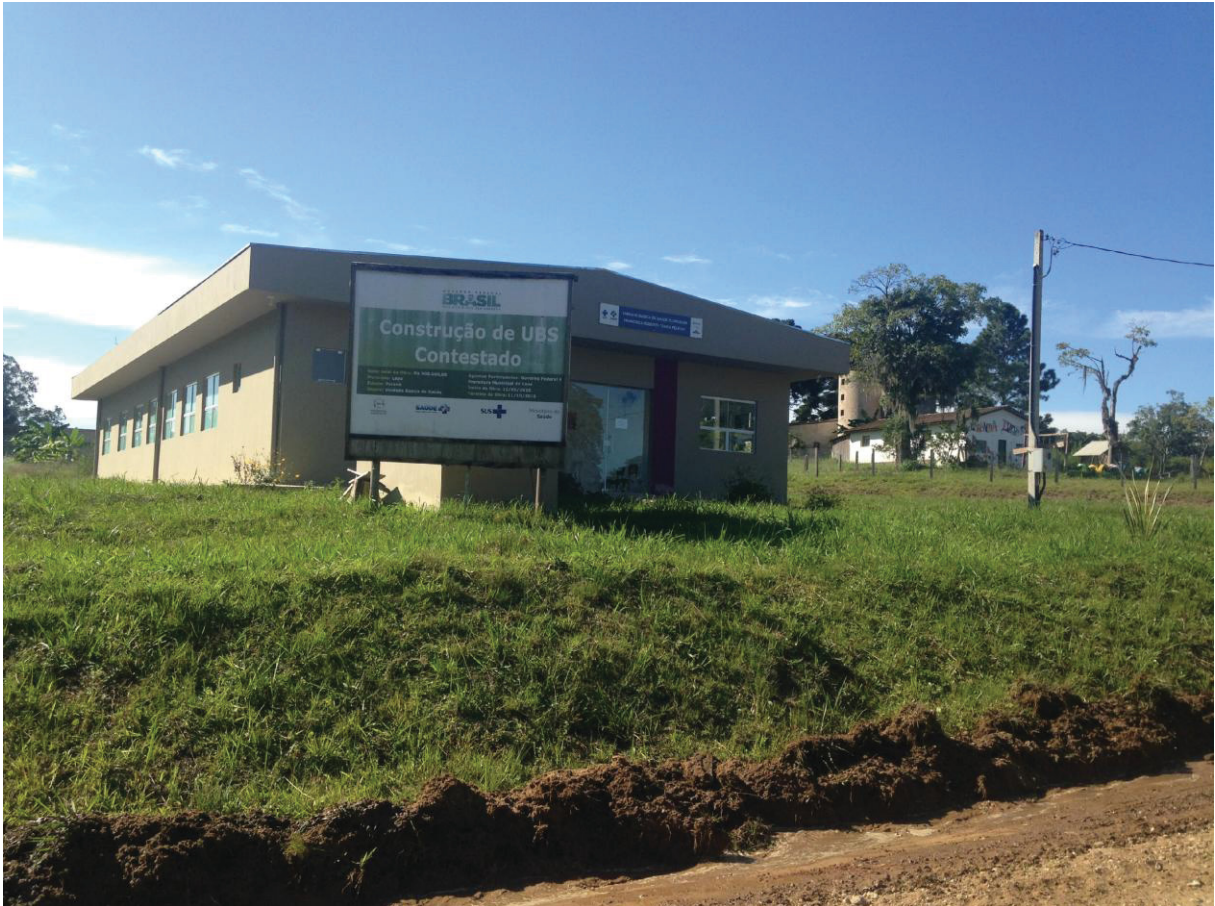
FIGURA 6 - POSTO DE SAÚDE