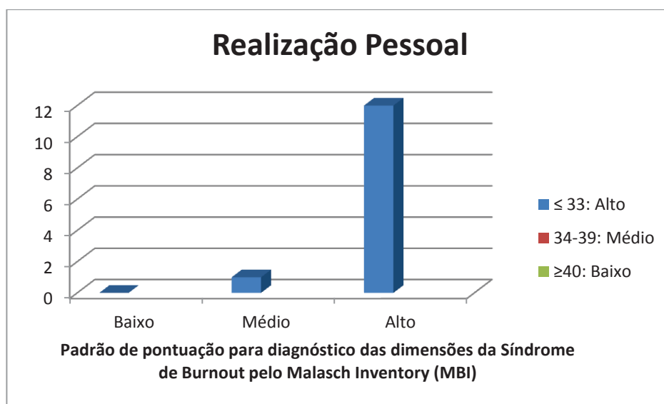
Gráfico nº 03 – Realização Pessoal

O terceiro ponto do diagnóstico da dimensão da Síndrome de Burnout, relata o resultado sobre o sentimento de realização pessoal. Neste as médias somada para cálculo é de, \geq 40 considerado baixo, 34-39 médio e \leq 33 considerado alto. No gráfico de nº 03 os resultados apontam que a realização pessoal é 93,3% alto e 6,7% médio.