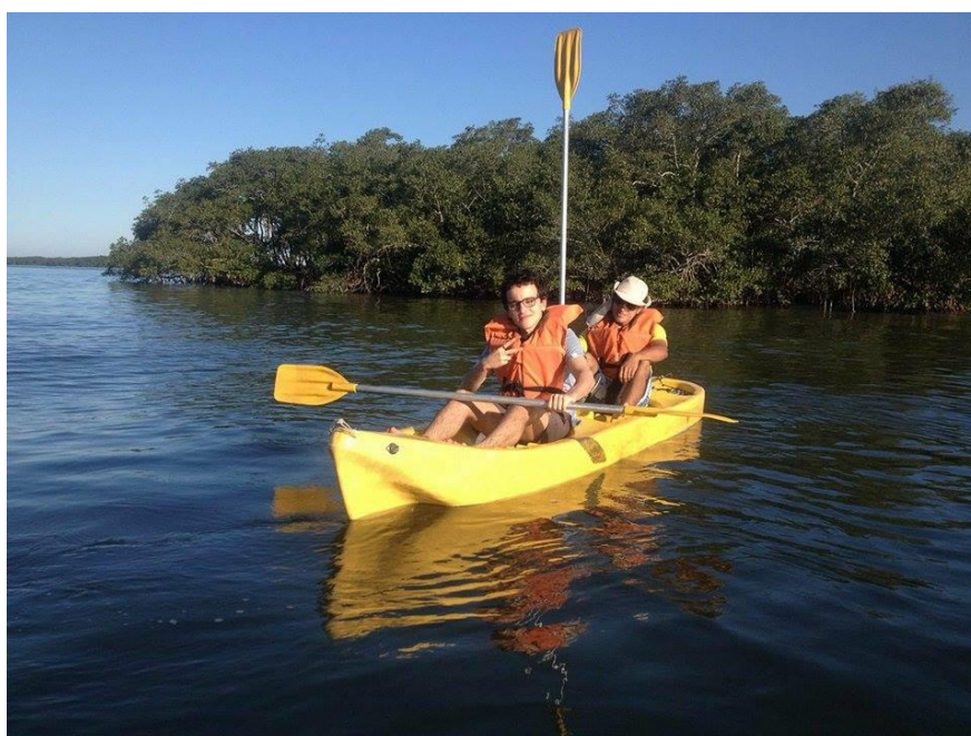
FIGURA 5 - PASSEIO DE CAIAQUE NA BAÍA DE PARANAGUÁ.

Na Ilha dos Valadares houveram elementos da cultura caiçara interessantes. Enquanto a paisagem da comunidade é, em sua maioria, urbana, o passeio de caiaque permitiu a observação da paisagem natural do manguezal e da baía de Paranaguá. Nesta, os condutores relataram algumas lendas locais de navios e tesouros submersos.