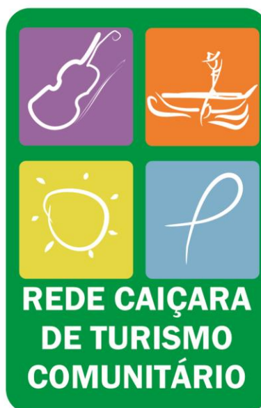
FIGURA 2 - MARCA DA REDE CAIÇARA.