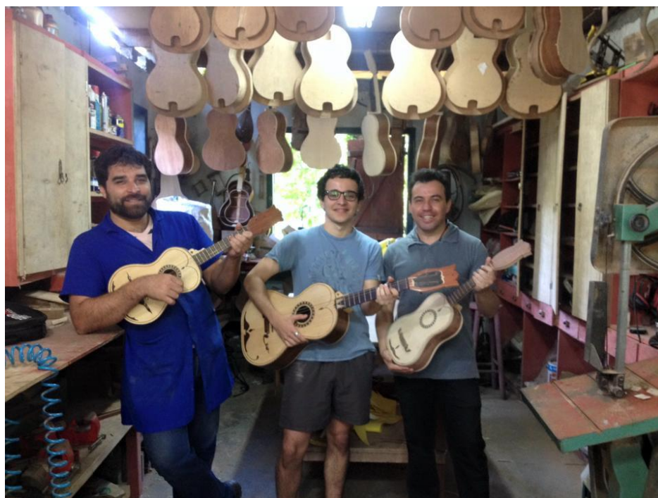
FIGURA 3 - CENTRO CULTURAL MANDICUERA.

No Centro Cultural Mandicuera foi possível conhecer os instrumentos de fandango e conversar com o mestre que os produz, visitar a capela e o manguezal na companhia do mesmo e ouvir suas histórias. O pernoite e as refeições, com exceção de um almoço que aconteceu em um restaurante, foram na hospedagem familiar.