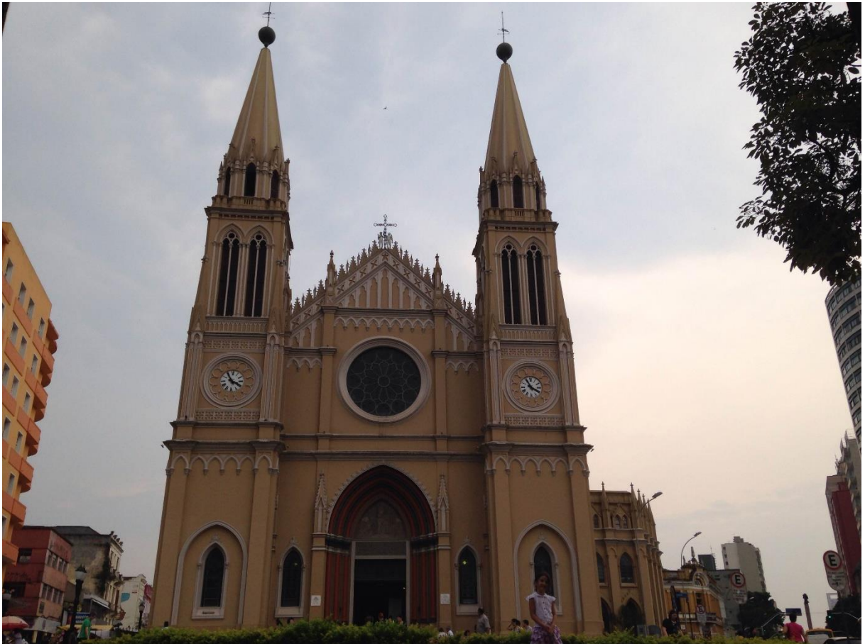
FIGURA 1 - CATEDRAL BASÍLICA NOSSA SENHORA DA LUZ DOS PINHAIS

disponibiliza uma vez por mês um tour guiado, com informações sobre a história e também sobre a arquitetura. Por tratar-se de um tour esporádico, pede-se que liguem marcando a visita, pois as visitas acontecem em grupo. É permitido tirar fotos (porém sem flash ) gravar e filmar também são permitidos. Para as pessoas que coordenam a atividade do Tour , a principal motivação para a visita a Catedral é a Cultura, a Arquitetura e também a Curiosidade por estar em uma região central (FIGURA 1).