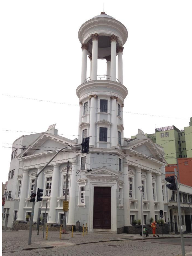
FIGURA 2 - PRIMEIRA IGREJA PRESBITERIANA INDEPENDENTE DE CURITIBA

somente com autorização antecipada do pastor responsável pela igreja. As atividades que os visitantes podem participar são apenas os cultos aos domingos. Pede-se que para a participação dessas atividades, assim como uma atitude respeitosa para com os fiéis que lá se encontram. Porém, a própria igreja não possui nenhum atendimento especializado aos turistas, caso haja o agendamento da visita, poderá verificar a disponibilidade de algum trabalhador da igreja de participar da visita, explicando alguns detalhes da história, da cultura e então da própria religião. Para a secretaria da igreja, os principais motivos para a visita da igreja é a Fé, pois a maioria dos visitantes possuem a mesma fé praticada na igreja, e também, a arquitetura (FIGURA 2).