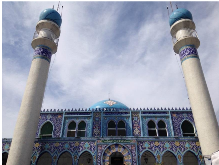
FIGURA 4 - MESQUITA IMAM ALI IBN ABI TALIB

domingos, das dez e meia da manhã às treze horas da tarde. Os visitantes são convidados a conhecer a mesquita, porém, é solicitado que retirem os sapatos ao entrar no local e que as mulheres vistam lenços para cobrir a cabeça. Esses lenços são oferecidos no local. É permitido tirar fotos e filmar no local, porém, é solicitado que não haja contato físico entre homens e mulheres por causa da cultura muçumana. A Mesquita é um dos poucos locais que possui informações turísticas, como por exemplo, uma placa informando a construção da mesquita, então o porquê de ela ser inteiramente de azulejos. Dentro da mesquita é possível encontrar informações sobre a fé muçumana, e também sobre atividades relacionadas ao Islã e a comunidade. Para informações históricas e também doutrinárias, é necessário ligar agendando um tour guiado. Esse tour poderá ser agendado qualquer horário desde que seja de segunda a sexta, durante os horários comerciais e que não coincida de ser nos horários das orações realizadas pelos fiéis na mesquita. Para o responsável por essa parte de recepcionar os turistas, o que mais atrai turistas à mesquita é a cultura, a arquitetura e a curiosidade (FIGURA 4).