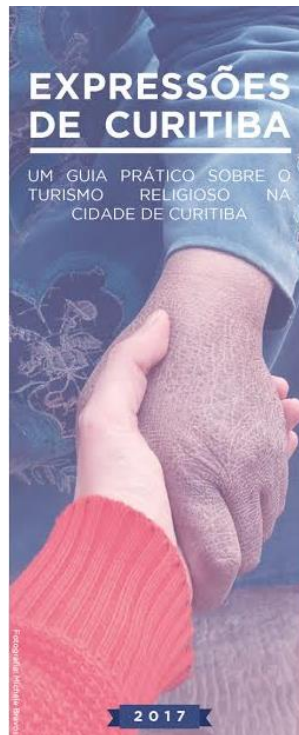
FIGURA 6 - CAPA DO FOLDER