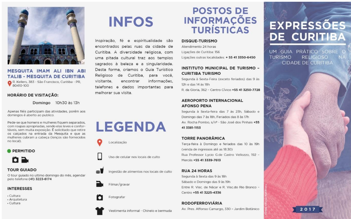
IMAGEM 1 – LADO EXTERNO DO FOLDER “EXPRESSÕES DE CURITIBA”

Folder realizado como produto final do projeto proposto.