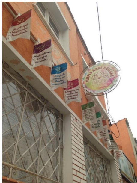
FIGURA 5 - TEMPLO HARE KRISHNA - ISKCON

O Templo Hare Krishna, apesar de não ser muito divulgado tem uma grande visibilidade no centro de Curitiba. As atividades do templo são iniciadas às quatro horas da manhã, e finalizam após a janta, às vinte horas da noite. É permitido tirar fotos, e participar de todas as atividades do templo. Não possuem informações turísticas, ou então informações históricas sobre o próprio templo, porém, caso haja a participação dos momentos das orações, há um momento em que é aberto para perguntas e interpretações, levando assim possíveis explicações. Pede-se que as mulheres venham com roupas confortáveis sem muita exposição e que cubra a cabeça nos momentos em que serão realizadas as orações (os lenços são fornecidos no local). Além das atividades do templo, é disponibilizada a comunidade refeições vegetarianas no almoço e na janta. Essas refeições são oferecidas de forma completamente gratuita, chegando a aproximadamente duzentas refeições por dia. Acredita-se que a maior motivação para a visita ao templo Hare Krishna são as atividades (por conta das refeições), a cultura e também a fé (FIGURA 5).