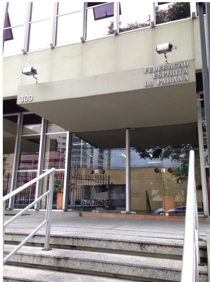
FIGURA 3 - FEDERAÇÃO ESPÍRITA DO PARANÁ

Segunda a Sexta-feira para visitaç o, dentro do hor rio comercial (oito  s dezoito da tarde). Os visitantes s o convidados a participarem das atividades e das palestras disponibilizadas no local.   permitido tirar fotos, gravar e filmar, por m, pede-se que n o usem o celular para n o atrapalhar os demais presentes no local. N o existe material gr fico com informa es tur sticas, mas, uma vez ao m s h  um tour guiado para os visitantes. H  a necessidade de ligar para saber a data correta que ocorrer  o Tour Guiado, e assim, pede-se que cheguem com anteced ncia para n o atrasar os demais interessados no tour (FIGURA 3).