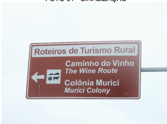
FOTO 01 - SINALIZAÇÃO