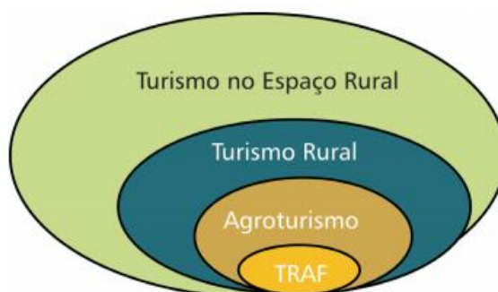
FIGURA 01 – REPRESENTAÇÃO DO TURISMO RURAL