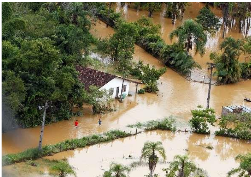
FIGURA 3 - ALAGAMENTO EM ANTONINA