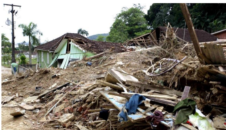
FIGURA 2 - DESTRUIÇÃO APÓS DESLIZAMENTOS

As fotos abaixo mostram a região de Antonina após as chuvas: