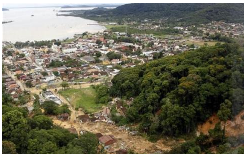
FIGURA 4 - DESLIZAMENTOS EM ANTONINA