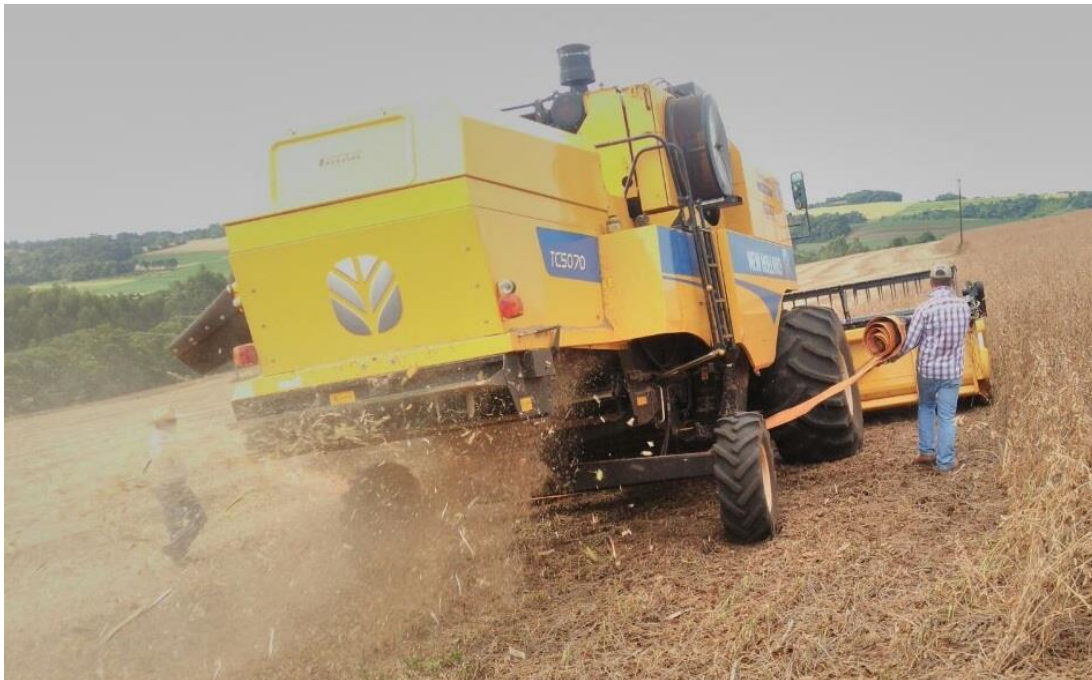
Figura 1. Momento da coleta e utilização da armação.

Após passagem da máquina ocorreu coleta de grãos e vagens que estavam localizados em cima da lona, sendo classificados como perdas devido ao processo de trilha, separação e limpeza. Após a coleta do material sobre a lona, a mesma foi retirada e coletou-se os grãos, vagens e plantas que estivessem sobre o solo, exatamente no local que estava a armação. Esse material se refere as perdas da plataforma de corte da colhedora.