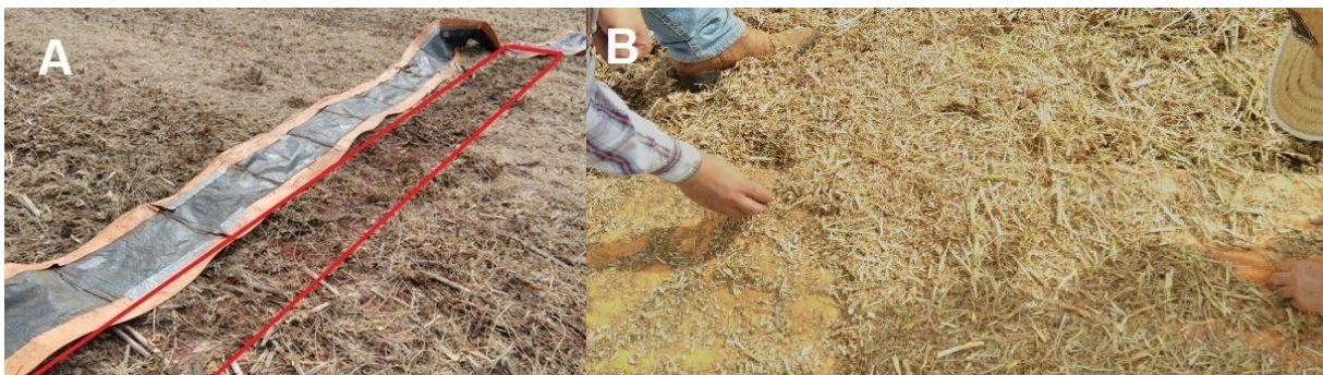
Figura2. A) Marcação do local onde foram coletados os dados de perda da plataforma. B) Momento da coleta de grãos e vagens sobre a lona.

Após passagem da máquina ocorreu coleta de grãos e vagens que estavam localizados em cima da lona, sendo classificados como perdas devido ao processo de trilha, separação e limpeza. Após a coleta do material sobre a lona, a mesma foi retirada e coletou-se os grãos, vagens e plantas que estivessem sobre o solo, exatamente no local que estava a armação. Esse material se refere as perdas da plataforma de corte da colhedora.