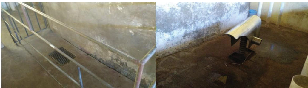
FIGURA 1 – LOCAL DE LIMPEZA PREPUCIAL E ÁREA DE COLETA DE SEMEN

A coleta do ejaculado total era realizada por funcionários treinados, utilizando a técnica da mão enluvada (HANCOCK & HOVEL, 1959). Anteriormente a coleta os animais passavam pelo procedimento de higienização do prepúcio a seco e o esvaziamento do divertículo prepucial e, então, seguiam para a coleta no manequim (Figura 1). O ejaculado era filtrado para separar as frações líquida e gelatinosa do sêmen, e acondicionado no copo coletor térmico com água previamente aquecida a 37°C.