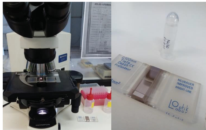
FIGURA 2 – AVALIAÇÃO DA CONCENTRAÇÃO ESPERMÁTICA UTILIZANDO A CÂMARA DE NEUBAUER