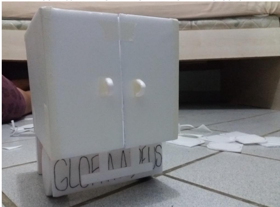
FIGURA 35: MINIATURA TRASEIRA DE CAMINHÃO ISOPOR