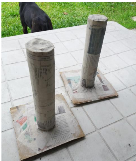
FIGURA 39: ALÇAS DO CARRINHO

Depois de seca, uma nova papietagem foi realizada para reforçar e corrigir falhas. Enquanto o processo de secagem acontecia, as rodas do carrinho e as alças para segurar foram produzidas. A união de várias placas circulares de papelão formaram as rodas que também receberam a técnica de papietagem, para reforçá-las e para mantê-las juntas. As alças do carrinho foram produzidas para que se encaixassem na caixa. As alças receberam recheio extra de papelão para ficarem mais firmes, assim como uma camada a mais de papietagem.