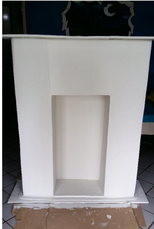
FIGURA 17: QUASE PRONTA, COM DUAS CAMADAS DE TINTA