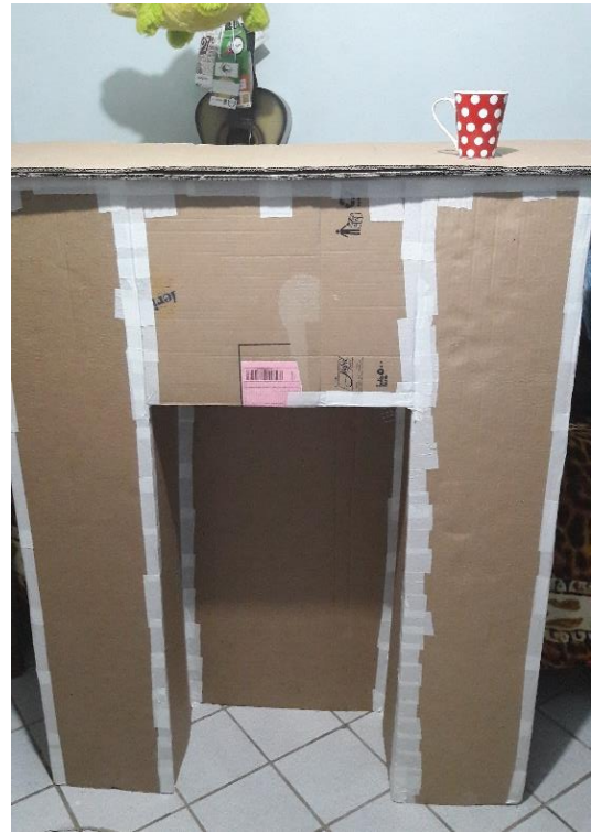
FIGURA 11: ESTRUTURA CENTRAL E TAMPA