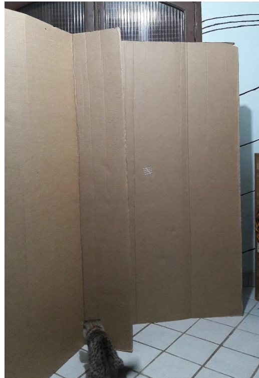
FIGURA 09: INÍCIO DO RECORTE DOS PAPELÕES