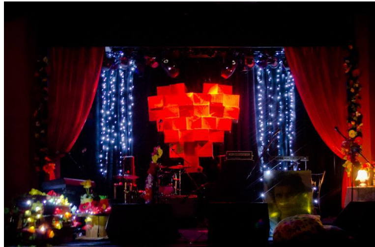
FIGURA 05: CENÁRIO DE SHOW