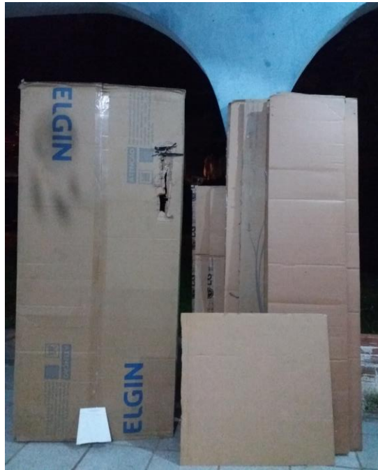
FIGURA 42: PAPELÕES PARA TRASEIRA DE CAMINHÃO