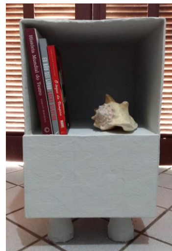
FIGURA 25: CRIADO MUDO COMPLETO