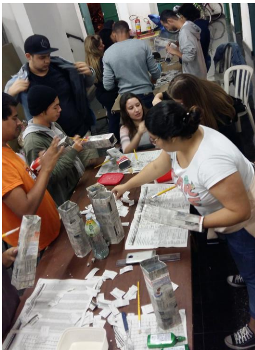
FIGURA 31: MESA DE PAPIETAGEM

Em razão de o teatro estar sendo utilizado, o segundo dia de oficina aconteceu na Casa Dacheux também em Paranaguá, é um local referência de arquitetura que foi restaurado pelo poder público e hoje funciona como espaço cultural para exposições e oficinas. Lá preparamos juntos mais cola grude, revisamos o planejamento e objetivos. As caixas de leite precisavam ficar firmes quando prontas, sem perder seu formato quadrado, mas carregá-las ou transportá-las abertas ocuparia muito espaço e daria um certo trabalho, por essa razão, a aplicação da técnica de papietagem e a secagem das caixinhas tinha de ser cuidadosa. Durante a secagem das caixas elas precisavam ser dobradas, de modo que os cantos ficassem maleáveis, mas os meios permanecessem firmes. Assim, quando o cenário fosse ser desmontado, as caixas seriam desprendidas umas das outras, dobradas de forma plana e facilmente guardadas e transportadas.