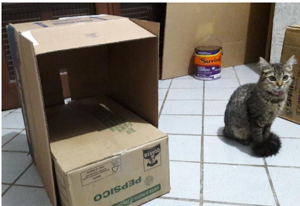
FIGURA 18: TESTE CAIXAS QUE SE ENCAIXAM

O Criado-mudo foi sendo produzido nos intervalos da produção da Lareira. Procurei produzir um objeto que tivesse uma gaveta e fosse retangular. Por sorte encontrei duas caixas que se encaixavam perfeitamente, a caixa que seria a gaveta precisava ser diminuída, mas ainda sim, foram perfeitas para esta produção.