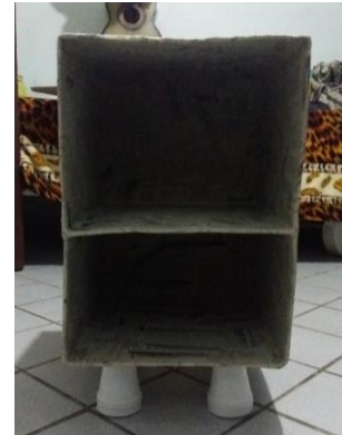
FIGURA 23: CRIADO MUDO PAPIETADO