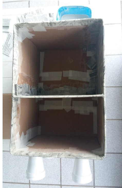
FIGURA 21: PÉS DE ISOPOR FIXOS E INÍCIO DA PAPIETAGEM