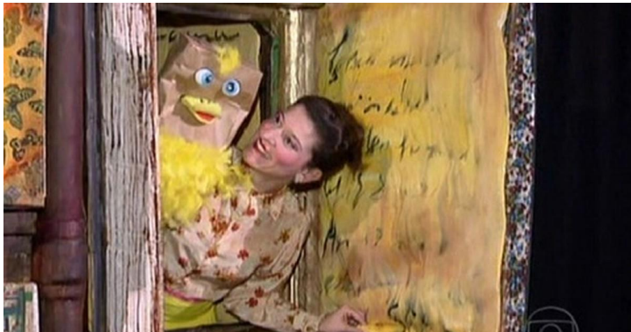
FIGURA 01: CENÁRIO COM MATERIAIS REUTILIZÁVEIS

FONTE: https://bit.ly/2NPtCgw ACESSO EM: 21 out. 2018