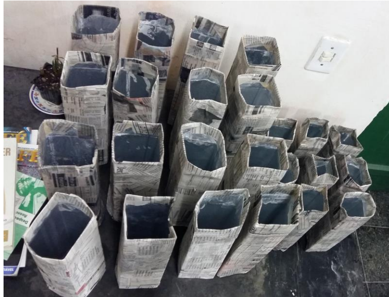
FIGURA 33: CAIXINHAS PAPIETADAS

Novamente com música e conversas seguimos com a atividade – agora com mais prática. Com cuidado todas as caixas foram dobradas para a secagem perfeita.