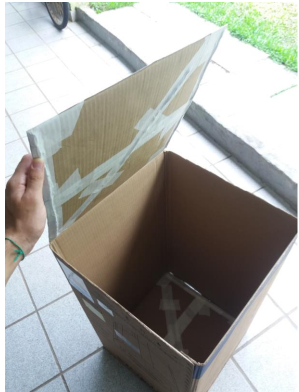
FIGURA 37: ESTRUTURAS E REPAROS PARA CARRINHO