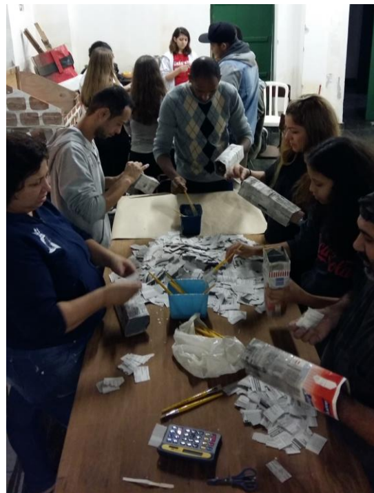
FIGURA 32: MESA DE PAPIETAGEM