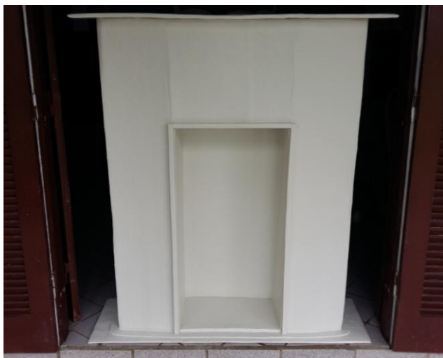
FIGURA 24: LAREIRA COM DECORAÇÃO E VERNIZ

Cobrir os pés de isopor também foi complicado por causa do acabamento que decidi dar. Pra secar, todas as partes do objeto foram colocadas em um ambiente ventilado e sobre ele um ventilador ligado. Neste objeto foi realizada apenas uma camada de papietagem que após seca foi lixada e pintada com duas camadas de tinta e uma de verniz termolina 13 . Por fim, encaixada a gaveta conclui o segundo objeto.