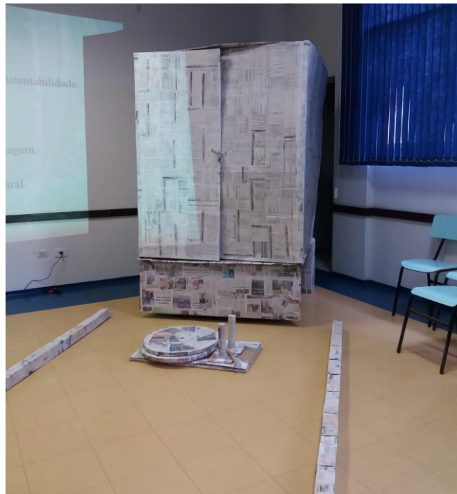
FIGURA 49: TRASEIRA DE CAMINHÃO E CORREDOR PRONTOS