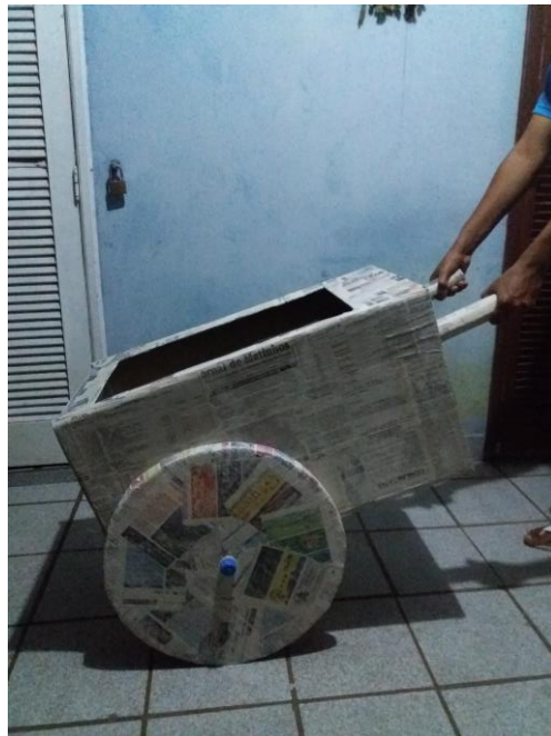
FIGURA 41: CARRINHO MONTADO COMPLETO

A finalização deste objeto, após a sua secagem, foi realizada passando uma lixa fina para retirar pequenas falhas. Cada parte desmontada recebeu uma camada de verniz termolina e foram encaixadas umas às outras depois. Um cabo de vassoura velho conectou uma roda a outra e, as abas abertas (que precisavam se manter fixas no carrinho durante o espetáculo), foram presas por dentro com faixas de velcro que quando grudadas garantiam a fixação. O aspecto final dos elementos cenográficos, foi uma aparência “crua”, “fictícia” e com a técnica da papietagem aparecendo propositalmente. A princípio a ideia era ter um aspecto mais realista dos objetos, mas depois decidiu-se por “fugir” deste ideal e ter um cenário mais expressionista e abstrato, que acompanhasse o elenco e os figurinos e que combinasse ainda mais com o resultado final esperado para o espetáculo.