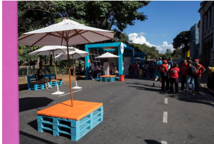
FIGURA 06: CENOGRAFIA DE EVENTO