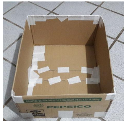
FIGURA 19: CAIXA PARA GAVETA