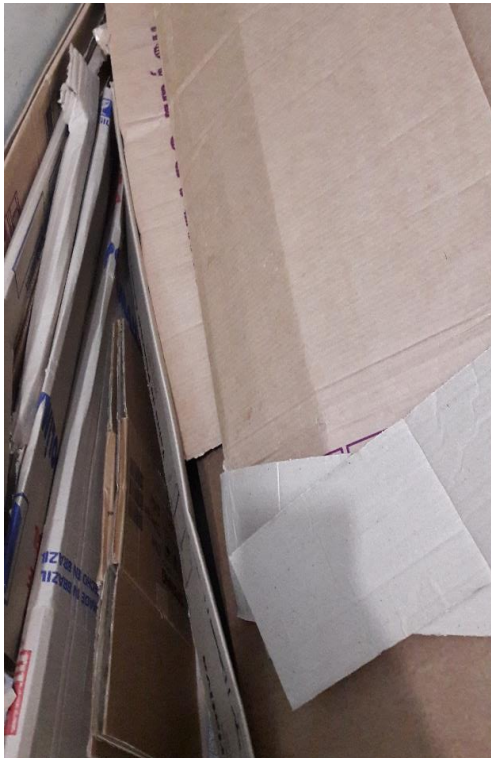
FIGURA 08: PAPELÕES ACUMULADOS

A matéria-prima utilizada foi o papelão. Foram necessários pedaços grandes, pequenos, grossos e finos. Foram feitos muitos recortes e principalmente muitos cálculos para produzir a lareira.