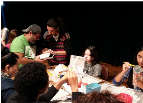
FIGURA 29: MESA DE PAPIETAGEM

Todos começaram rasgando os jornais, enquanto preparamos potes de cola “grude”, cola feita a partir da mistura de água, trigo e vinagre. Nos dividimos em duas equipes: uma continuaria picotando os jornais enquanto a outra daria início a aplicação da técnica de papietagem nas caixinhas de leite. Para muitos a papietagem era uma novidade, enquanto outros disseram já ter trabalho com a técnica nas aulas de arte da escola. O tempo todo era lembrado sobre como garantir um bom acabamento na papietagem. Alguns utilizaram pincéis enquanto outros preferiram fazer com as próprias mãos. Durante a atividade eles colocaram músicas e conversaram sobre o dia a dia, sobre aquele momento e sobre teatro.