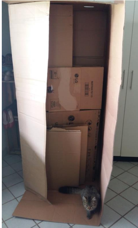
FIGURA 27: NOVOS PAPELÕES ENCONTRADOS

foi a captação de recursos (tarefa realizada em diversos dias). Variando entre papelões encontrados aleatoriamente e outros encontrados por amigos que avisavam a localização através de mensagens de celular, na metade do mês de dezembro de 2017 já havíamos coletado material suficiente para o que havíamos pensado.