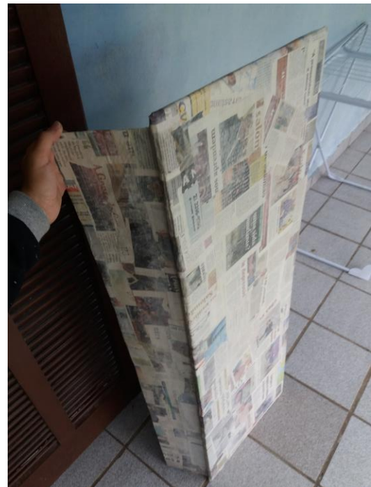
FIGURA 47: PLACA DE CAMINHÃO PAPIETADA