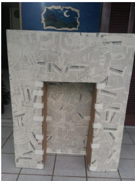
FIGURA 13: PRIMEIRA CAMADA DE PAPIETAGEM E REPAROS

Depois de prontas as estruturas, precisei aplicar a técnica de papietagem nas três partes. Fazendo com bastante cuidado pra não ter falhas nem bolhas de ar, a primeira camada de papietagem da tampa levou cerca de duas horas para ser feita, a base por ter mais cantos, camadas e andares levou de três a quatro horas e o centro da lareira devido ao seu tamanho, o cuidado com os cantos e querendo garantir um ótimo acabamento, o preenchimento total dela levou aproximadamente nove horas para terminar.