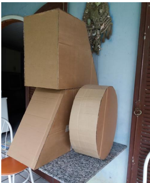
FIGURA 44: PÉS DE APOIO E RODA DE CAMINHÃO SEM PAPIETAGEM