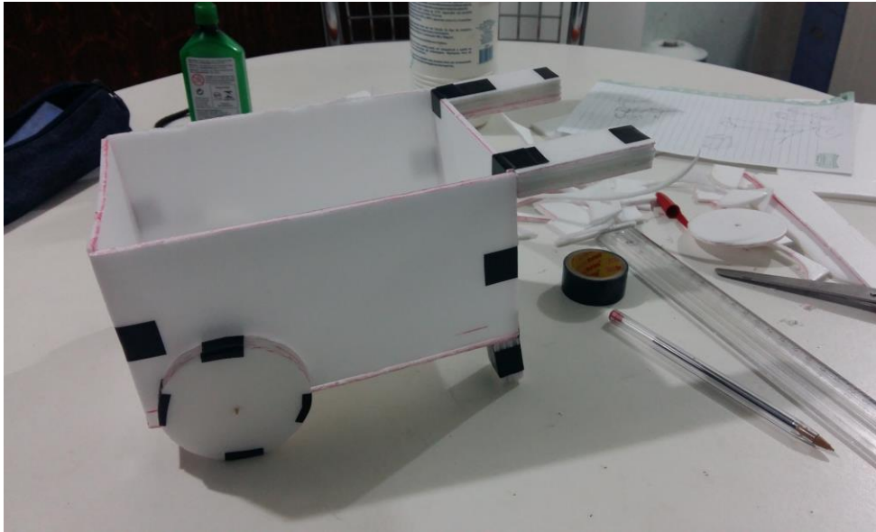
FIGURA 34: MINIATURA CARRINHO ISOPOR