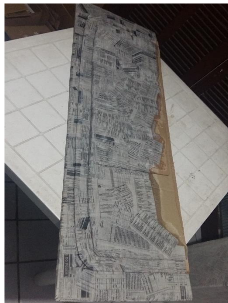
FIGURA 14: PAPIETAGEM DA BASE