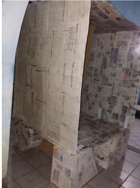
FIGURA 48: MONTAGEM TESTE DO CAMINHÃO