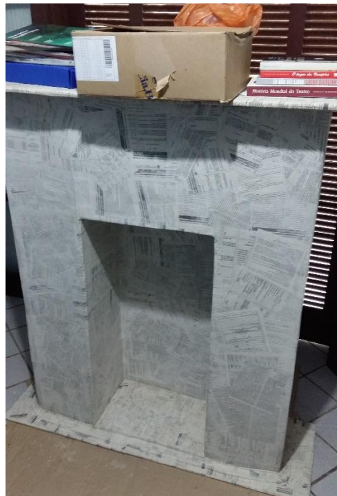
FIGURA 16: COLAGEM DAS TRÊS PARTES