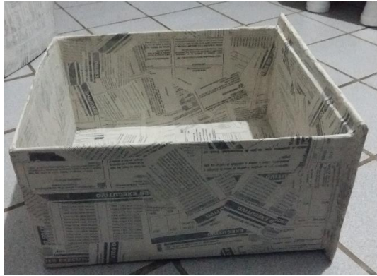
FIGURA 22: GAVETA COM PAPIETAGEM