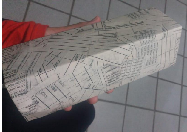
FIGURA 28: CAIXINHA TESTE

técnica de papietagem considerando a ideia do cenário, mostrando a eles uma caixinha como exemplo.