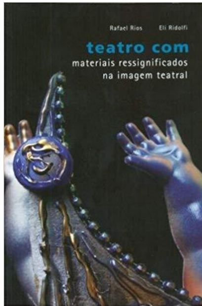
FIGURA 02: CAPA DE LIVRO