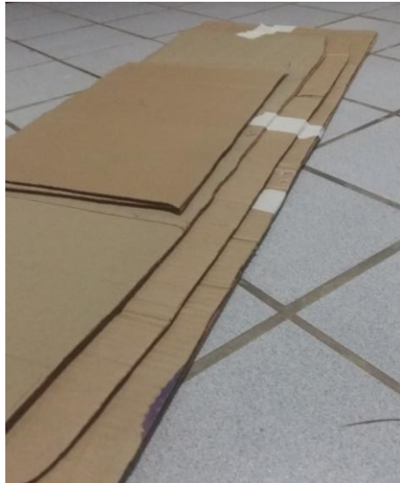
FIGURA 12: PAPELÕES FORMANDO A BASE DA LAREIRA