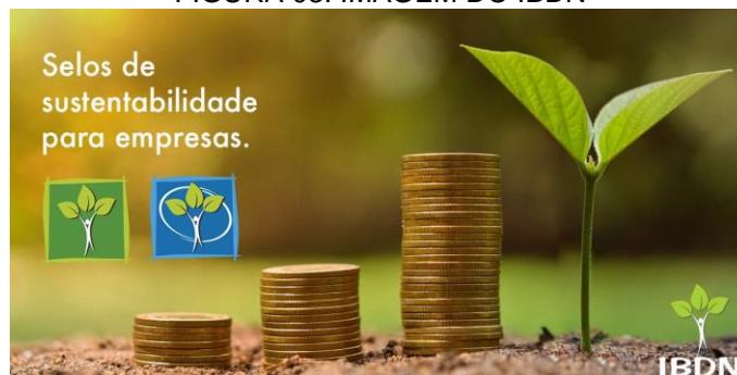
FIGURA 03: IMAGEM DO IBDN