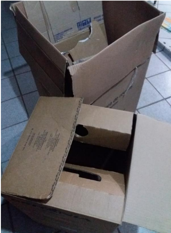
FIGURA 36: PAPELÕES PARA CARRINHO CATADORES