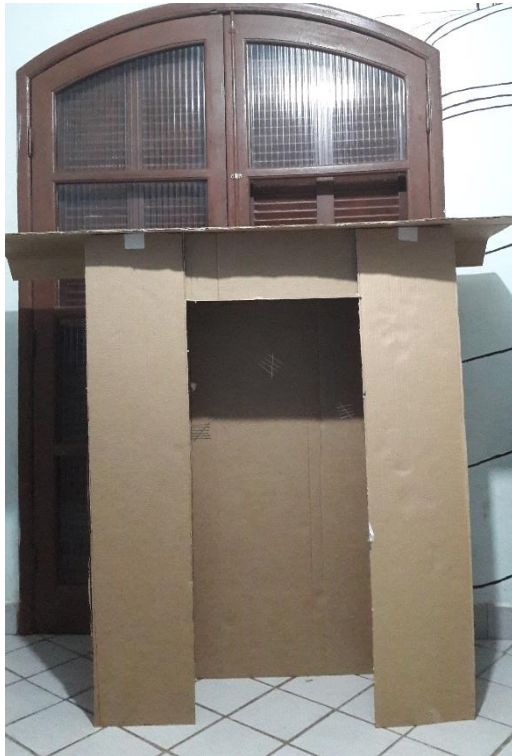
FIGURA 10: INÍCIO DA ESTRUTURA DA LAREIRA