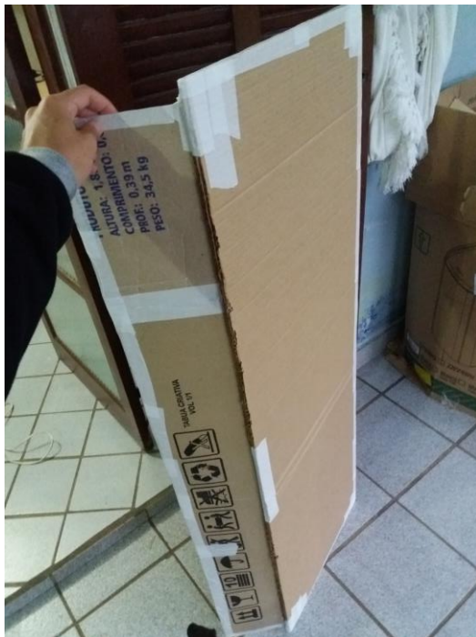
FIGURA 46: PLACA DE CAMINHÃO PRODUZIDA

Devido ao tempo instável e majoritariamente úmido, os objetos produzidos eram o tempo todo armazenados em um quarto com ventilador e circulador de ar, buscando acelerar o processo de secagem. A placa decorativa da traseira do caminhão foi produzida unindo dois pedaços retangulares de papelão e ao redor dos quatro lados foram fixadas tiras de arame, para que a placa ficasse firme e não perdesse sua forma. Realizada a camada de papietagem e com a placa seca, será escrita nela a frase “Glória a Deus”. Esta frase foi escolhida, pois o personagem, dono do caminhão, além de explorar os catadores de lixo, se esconde atrás da religião.