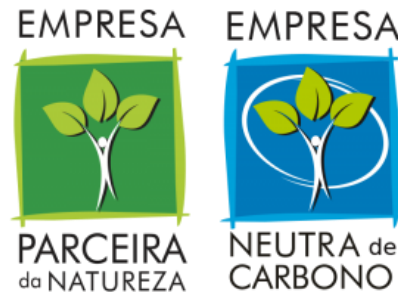
FIGURA 04: SELOS DE SUSTENTABILIDADE