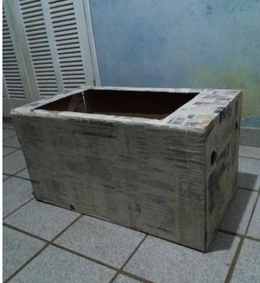
FIGURA 38: CAIXA CARRINHO COM PAPIETAGEM