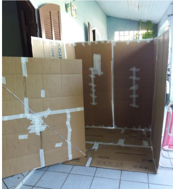
FIGURA 43: PLACAS COM ARAME, APOIADAS COMO IDEIA PARA A CAÇAMBA.