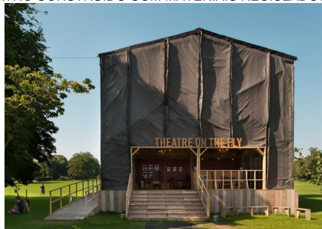
FIGURA 07: TEATRO CONSTRUÍDO COM MATERIAIS RECICLADOS/REUTILIZADOS

Ciclo Vivo é um site de notícias relacionadas a sustentabilidade. Em suas matérias relatam vários exemplos de sustentabilidade ligados a eventos artísticos e também a arquitetura comprometida com o ambiente. Como exemplo, há o relato de uma comunidade inglesa que construiu um teatro sustentável. Os organizadores do evento usaram a criatividade para driblar a crise. Com materiais reciclados/reutilizados e, contando com a ajuda da comunidade ergueram uma estrutura para comemorar o aniversário de um festival de teatro inglês. Resistente ao vento e a chuva, a construção recebeu apresentações teatrais e uma programação de arte e cultura. (CICLOVIVO, 2018).