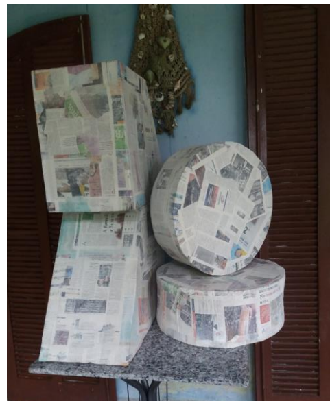
FIGURA 45: PÉS DE APOIO E RODAS DE CAMINHÃO PAPIETADAS