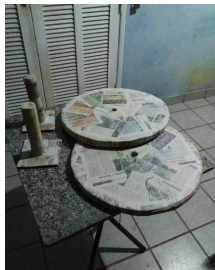
FIGURA 40: RODAS DO CARRINHO