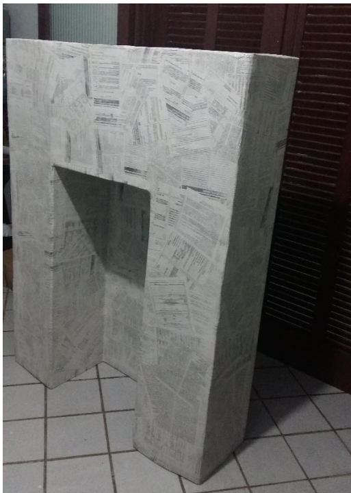
FIGURA 15: SEGUNDA CAMADA DE PAPIETAGEM

Para garantir que as peças ficassem esteticamente “bonitas” e ao mesmo tempo firmes e resistentes uma segunda camada de papietagem foi feita. Após a secagem das camadas – o que não era rápido, já que a umidade do ar é muito alta em Matinhos - PR – foi a vez de, com uma lixa fina, retirar pequenas dobras e imperfeições que ficaram no objeto. Várias foram as vezes que tive de limpar o mofo que se acumulou na lareira, durante sua secagem. A limpeza foi realizada sempre primeiramente com um pano seco, seguido de um pano umedecido no vinagre. Após a limpeza jatos quentes de um secador de cabelos. Hoje sei que a papietagem deve ser feita em dias secos e o meu grude feito com muito vinagre, e lá se foram mais alguns dias e horas até completar tudo.