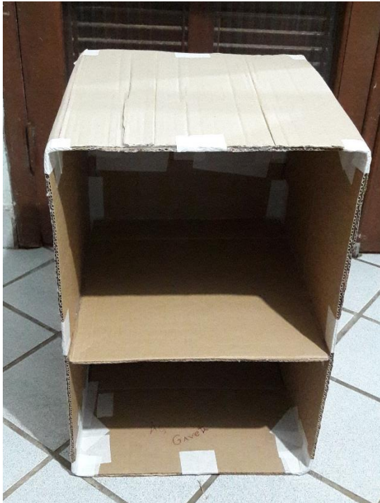
FIGURA 20: FIXAÇÃO DA PRATELEIRA E DIVISÃO DA GAVETA

Assim como a lareira, preendi as partes com cola quente e fita crepe. A ideia foi deixá-la o mais resistente possível. Foram necessários muitos recortes e cálculos. Fiz também uma prateleira que fechou o espaço entre a gaveta e o restante do “criado”, completando o objeto esteticamente.