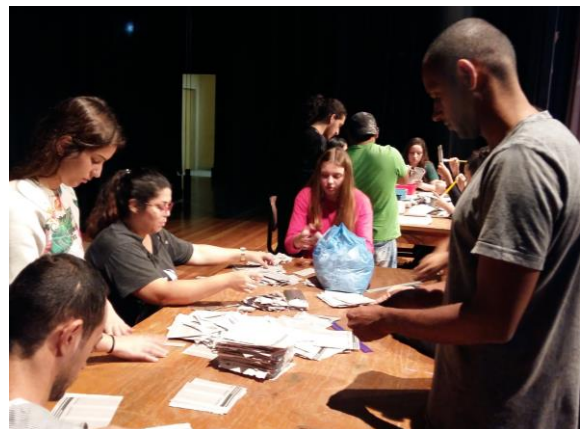
FIGURA 30: MESA DE JORNAIS