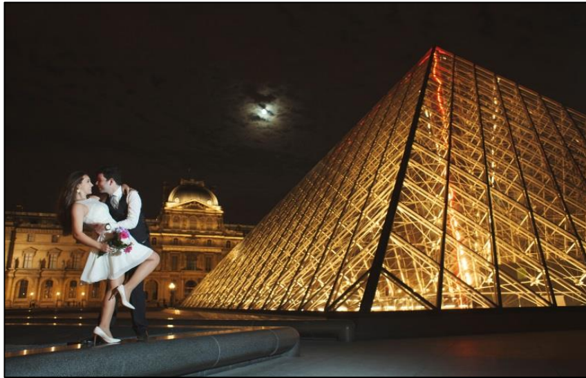
IMAGEM 22 – MUSEU DO LOUVRE - FRANÇA