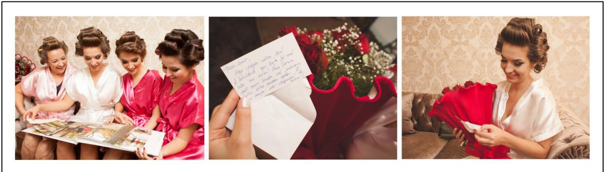
IMAGEM 34: CARTAS

A imagem 34, registrada em Maringá/PR, apresenta-se mãe e irmãs revendo fotos da família. Na sequência a noiva recebe o buquê de flores acompanhado do cartão e na terceira foto o registrou-se a emoção da noiva ao recebê-los. Utilizei uma câmera Canon 50mm, flash Speed Light.