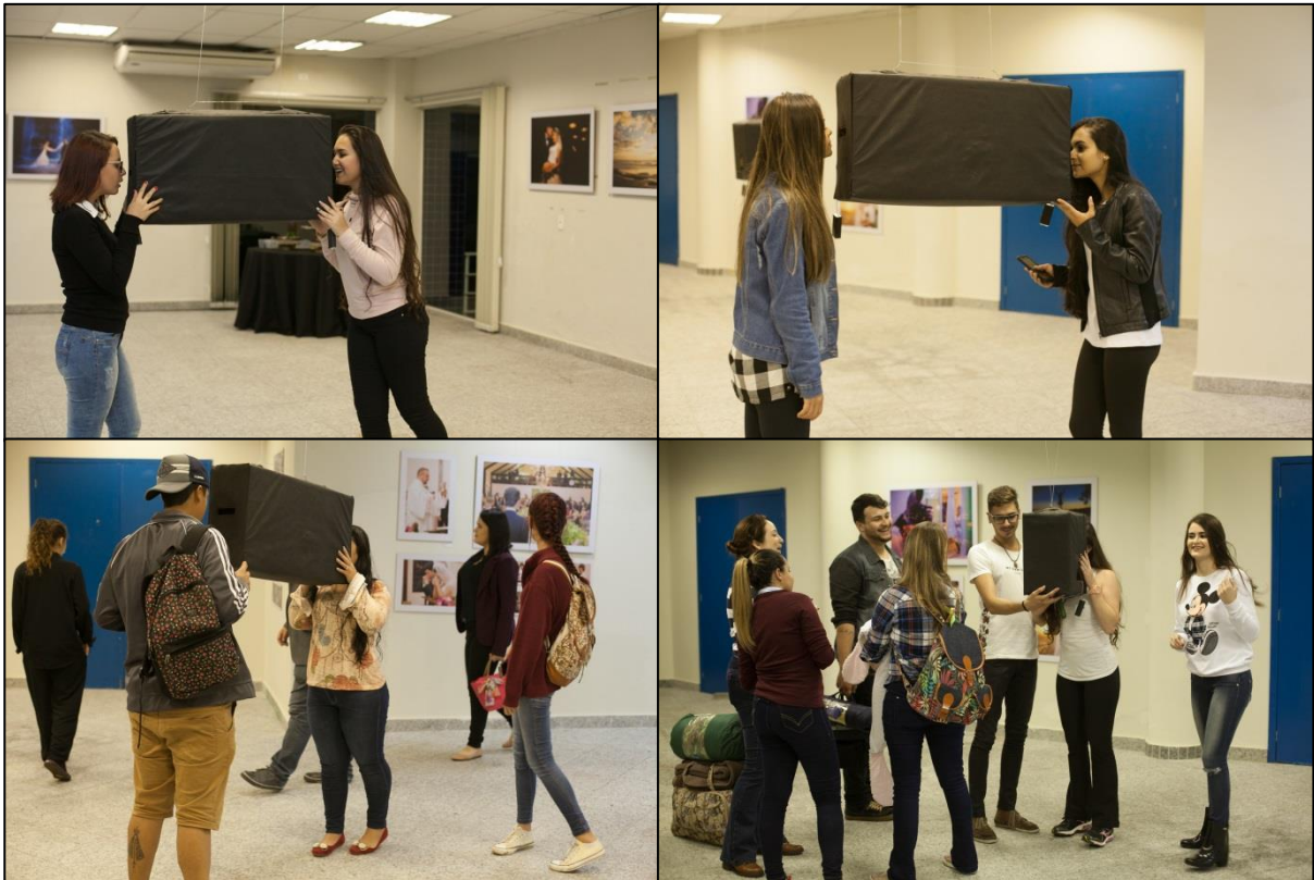
IMAGENS 17, 18, 19 e 20 – OBRAS SUSPENSAS EM CAIXAS

mesmo casal de noivos sob ângulos diferentes. De um lado enxergava-se os noivos de frente e do outro lado via-se os noivos de costas. O objetivo desse efeito era que o espectador pudesse ter uma visão inicial do cenário visto pelo fotógrafo durante o casamento (Imagens 17, 18, 19 e 20).