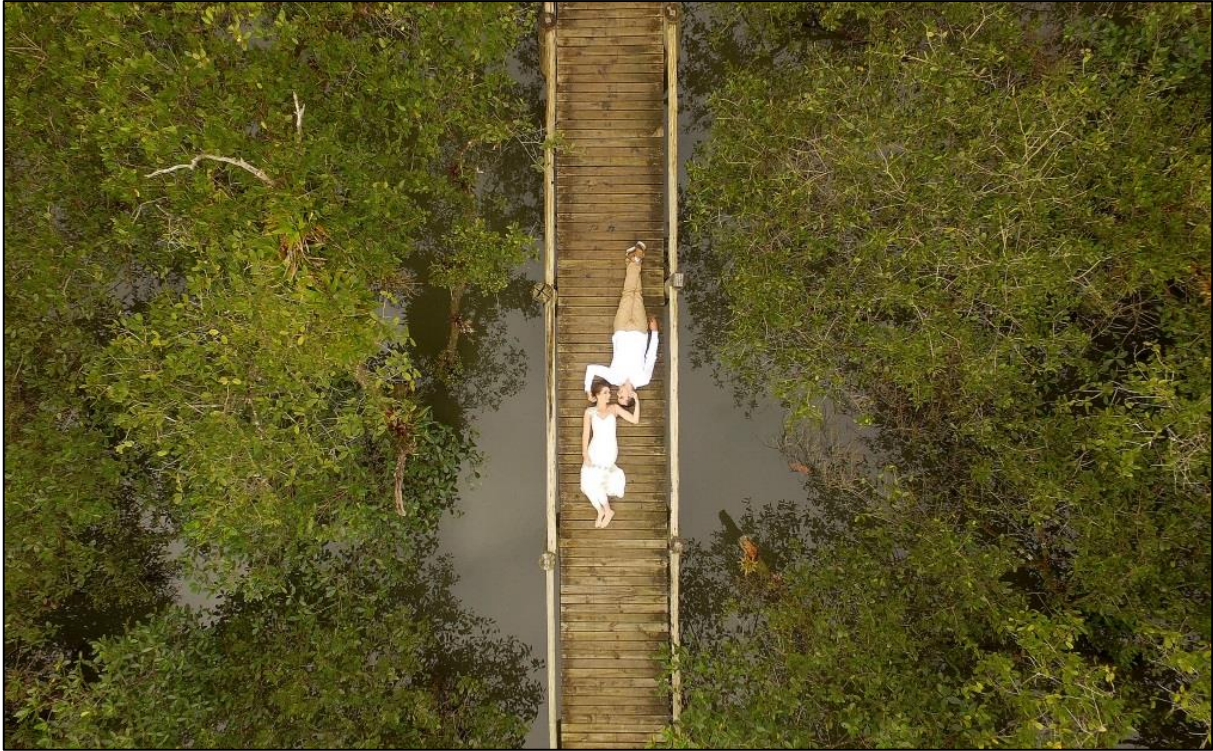
IMAGEM 28: DO ALTO NOSSO AMOR

para quem crê em verdades metafísicas 3 . A imagem foi registrada em Cabaraquara, Guaratuba na região dos Pés da Serra da Mata Atlântica no litoral do Paraná com a utilização de um drone para clicar os noivos do alto.