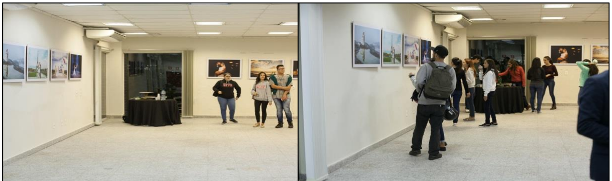
IMAGENS 4 E 5: FOTOGRAFIAS SUSPENSAS NAS PAREDES E MESA DE DOCES

tamanho 70 x 20cm com 3 imagens cada. As obras foram impressas em papel adesivo e aplicadas em chapas de MDF 6 mm suspensas por fio de Nylon e foram dispostas em toda a sala. As fotografias foram distribuídas de forma harmônica e separadas por tons de cores, no que foram acompanhadas pela presença de uma mesa composta por doces e bebidas os quais podiam ser degustados pelos visitantes como se estivessem em um casamento, conforme pode ser observado nas imagens 4 e 5: