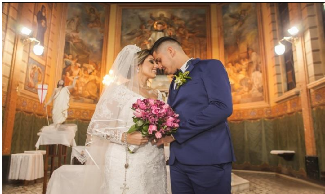
IMAGEM 42: MOMENTO APÓS CELEBRAÇÃO DO CASAMENTO

Na imagem 42 apresenta-se igualmente um momento pós-celebração do casamento em uma capela em Curitiba/PR. Após o término da cerimônia o fotógrafo dirige esse momento para os noivos posarem algumas fotos românticas dentro da igreja. Utilizei uma Camera Canon 5D Mark II, lente 28 mm, flash Speed Light .