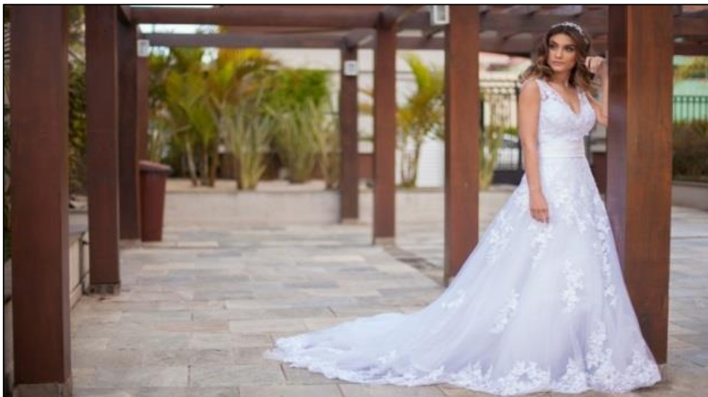
IMAGEM 36: NOIVA POSA PARA O FOTOGRAFO

A seguir volta-se a apresentar as fotos de caráter unitário. Na foto 36 a noiva posa para o fotógrafo. Este constitui importante momento para a noiva que tem como objetivo eternizar através da fotografia o seu vestido escolhido para esse instante especial. Utilizei a câmera Canon 5D Mark II 50 mm luz natural e a imagem foi registrada Curitiba/PR.