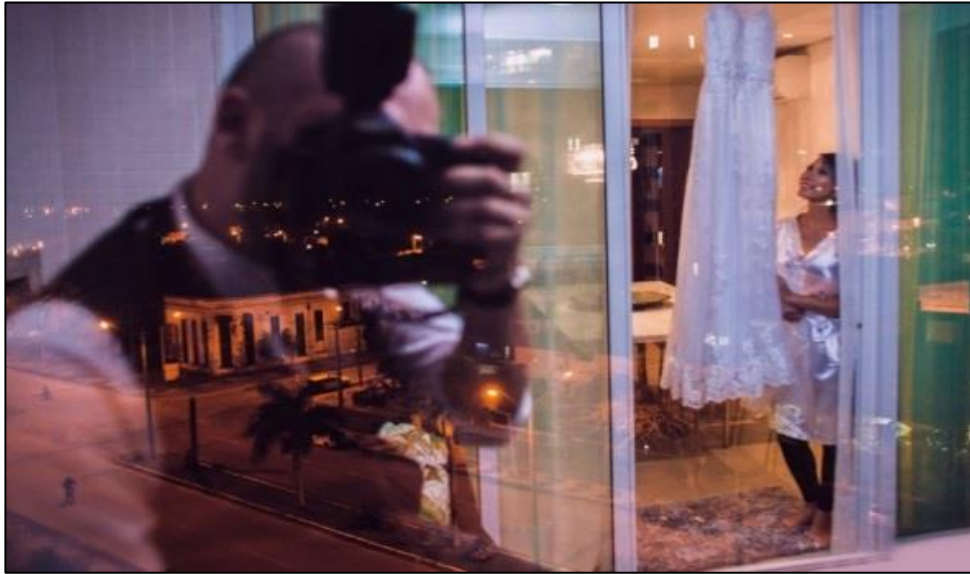
IMAGEM 37: OBSERVANDO O VESTIDO