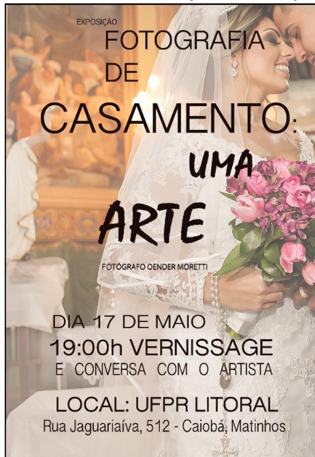
IMAGEM 2: CARTAZ DE DIVULGAÇÃO DA EXPOSIÇÃO