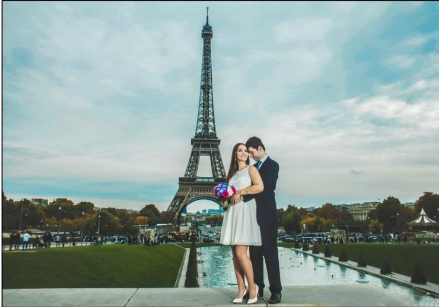
IMAGEM 21: TORRE EIFFEL

conforme mencionado por Dondis (2007). A foto 21 registrei em frente à Torre Eiffel na França às 10:00 hs da manhã utilizando câmera Canon 5D Mark II, lente 50 mm, 1.4 e Flash Speed Light posicionada a 45° graus.