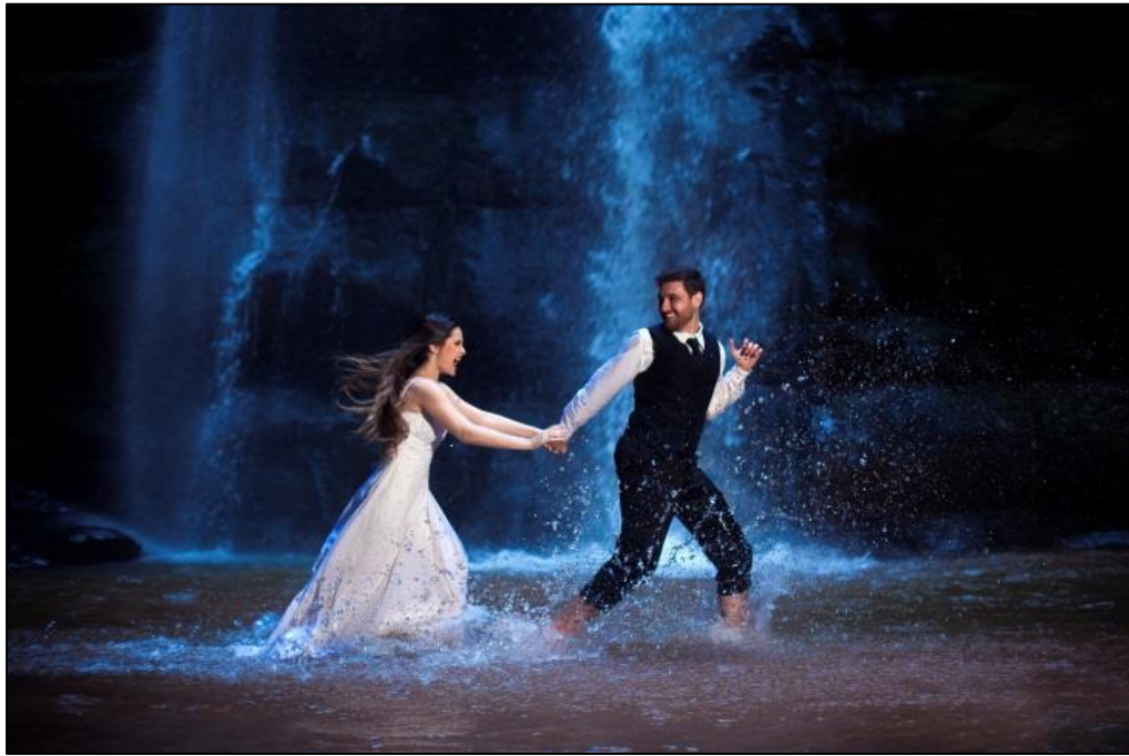
IMAGEM 24: ENTRE CACHOEIRAS