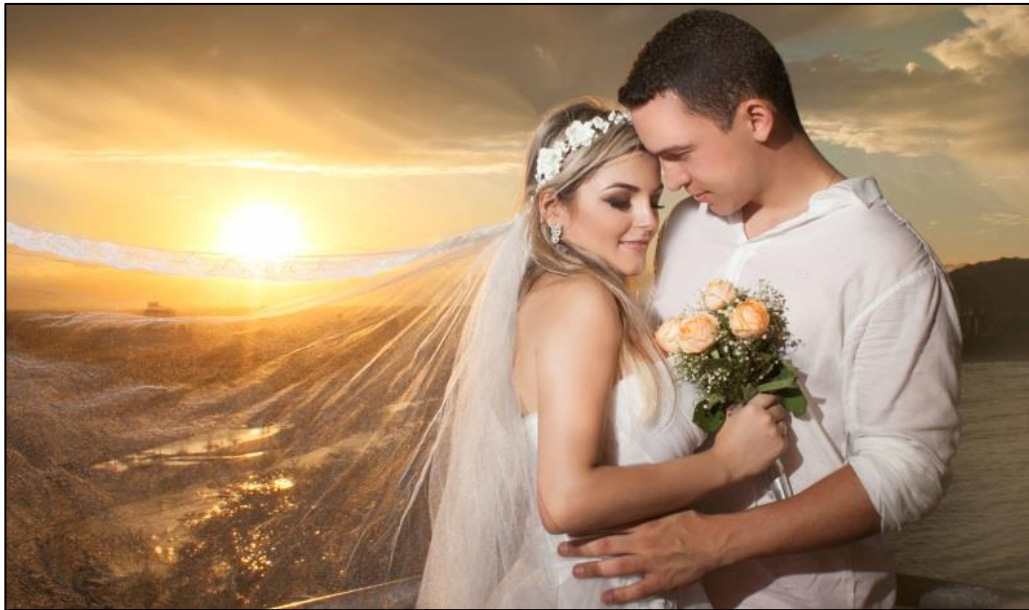
IMAGEM 27: POR DO SOL

A foto 27 tirei em Guaratuba/PR às 18:00 no pôr do sol no Morro do Cristo utilizando a câmera Canon 5D Mark II, lente 50mm, flash Speed Light e sombrinha difusora. A sombrinha difusora foi empregada para suavizar as luzes artificiais e manter as cores do pôr do sol com mais naturalidade. Este local onde a foto foi registrada se configura como um espaço de visitação composto por escadarias no qual se oportuniza uma vista panorâmica da Baía de Guaratuba.