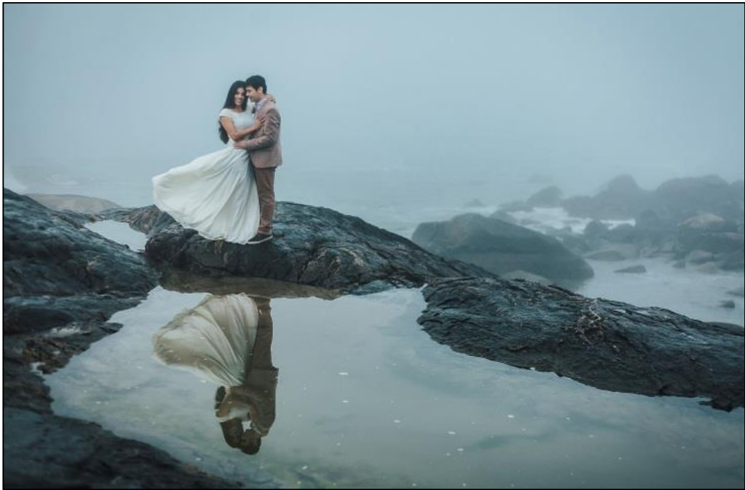
IMAGEM 23: E O VENTO LEVOU