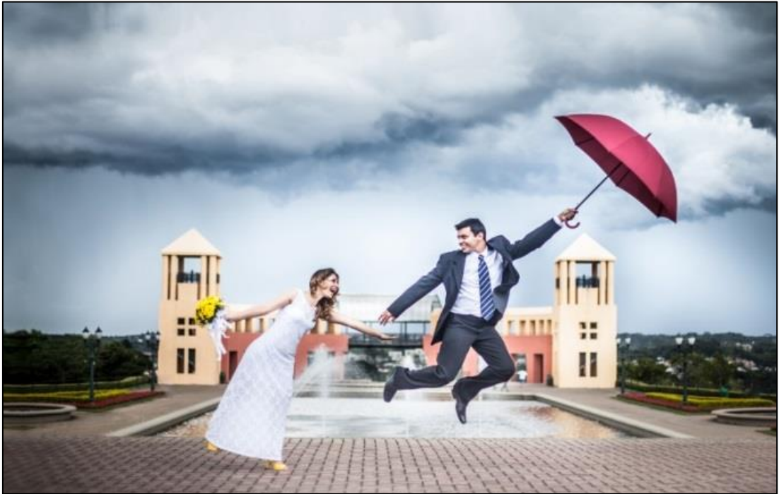
IMAGEM 41: MOMENTO APÓS CELEBRAÇÃO DO CASAMENTO