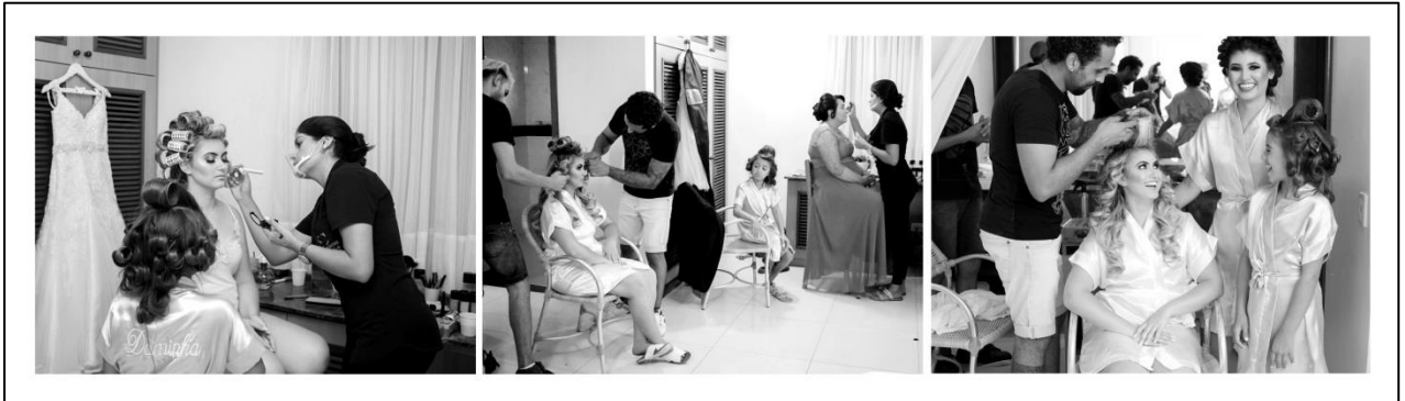
IMAGEM 31 PREPARATIVOS PARA O CASAMENTO

Nessa foto sequência utilizei um enquadramento mais aberto para que fosse possível visualizar não somente a noiva mas também todo o ambiente e as pessoas que estavam acompanhando a preparação da noiva como a mãe, madrinhas, e outros familiares. Utilizei câmera 5D Mark II, lente 28 mm e, luz natural. A foto retirada em Pontal do Paraná.