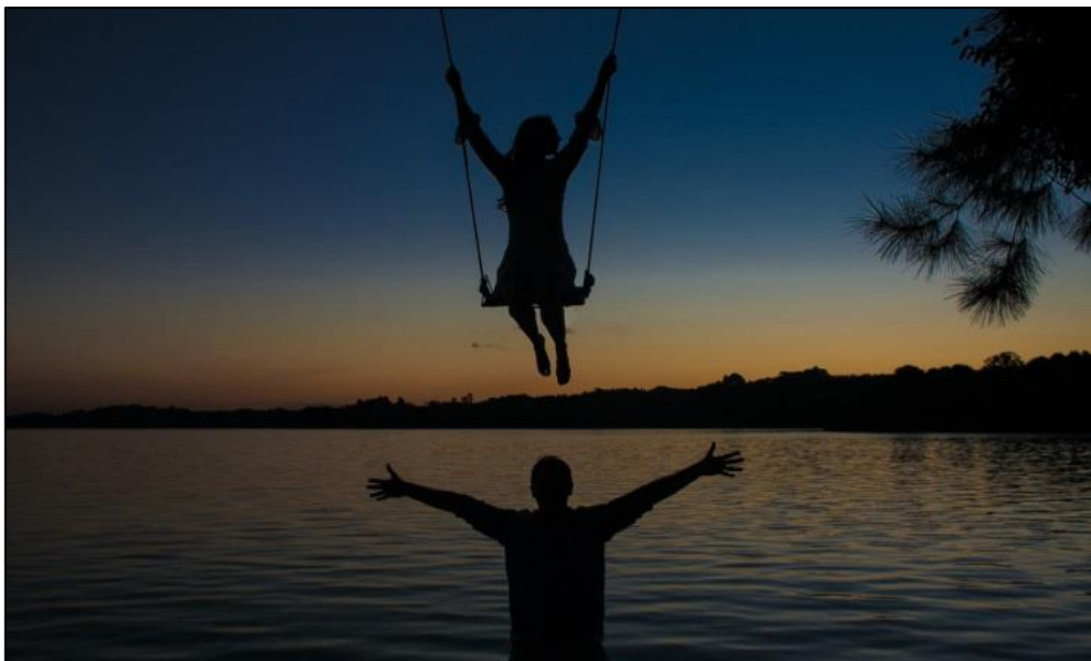
IMAGEM 26: BALANÇA

Na foto 26 igualmente fiz uso de luz natural. A imagem foi registrada em Campo Largo/PR mediante utilização da câmera Canon 5D Mark II, lente 28mm às 18:30hs no pôr do sol.