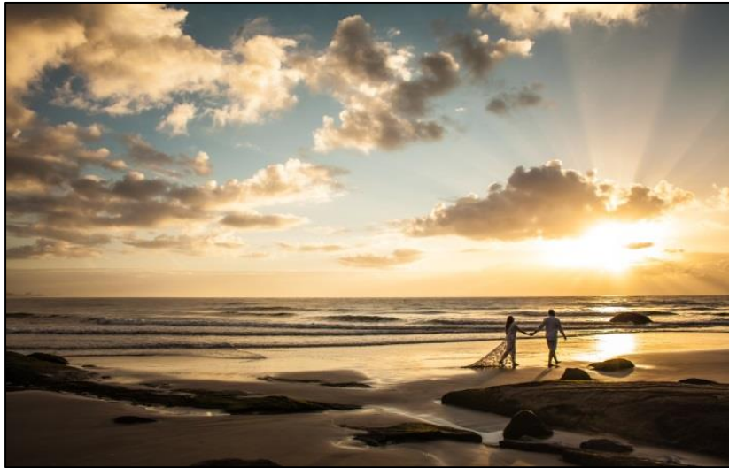
IMAGEM 25: NASCER DO SOL