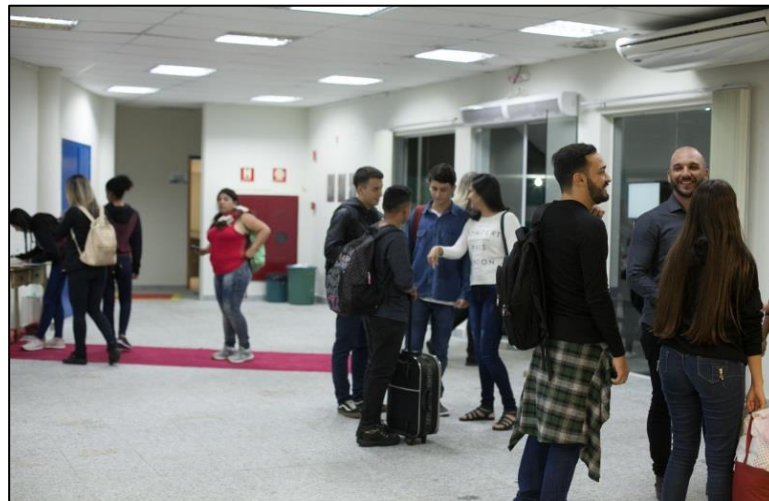
IMAGEM 3: ESPAÇO EXPOSITIVO SIMULANDO A ENTRADA NA IGREJA