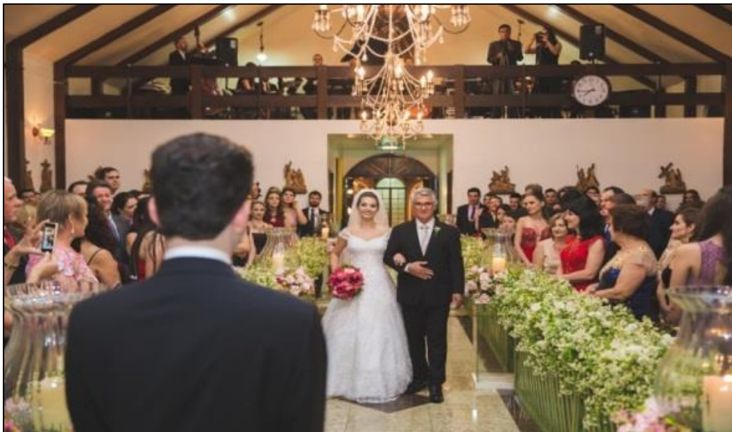
IMAGEM 38: NOIVA CHEGANDO AO ALTAR

A imagem 38 registrei em Maringá/PR na capela escolhida para celebração da cerimônia matrimonial. Tradicionalmente em casamentos católicos usa-se como rito o pai da noiva acompanhá-la na sua entrada do templo até o noivo. Utilizei uma câmera Canon 5D Mark III, lente 24-70mm.