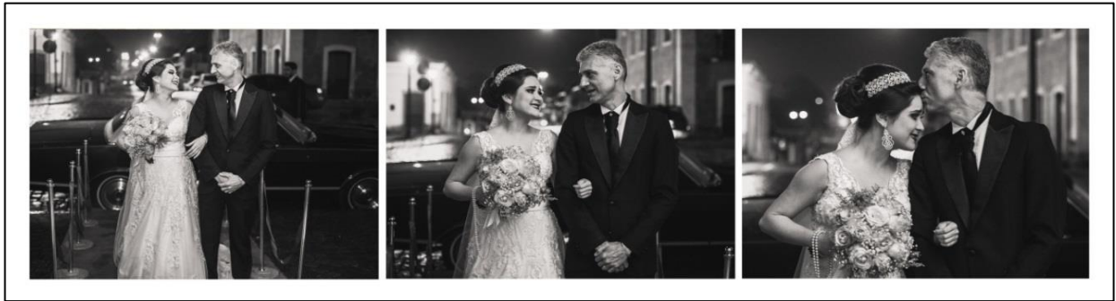
IMAGEM 35: NOIVA ACOMPANHADA DO PAI