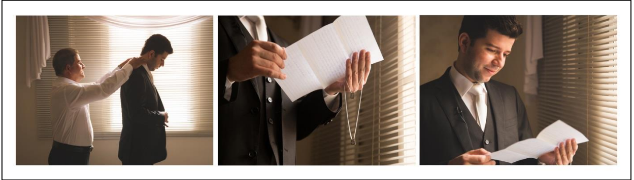
IMAGEM 33 CARTAS

pendurado em sua mão, também recebido como presente da sua futura esposa. Utilizei uma câmera Canon Mark II, lente 50mm e luz natural. A imagem foi registrada em Maringá/PR.