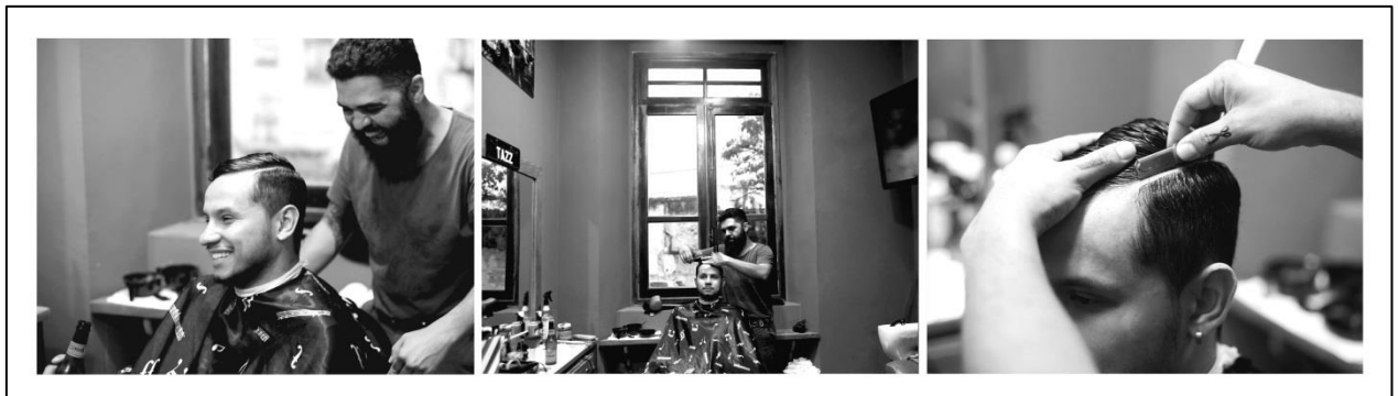
IMAGEM 30: MAKING OF DO NOIVO

A foto 30 mostra um momento descontraído do noivo algumas horas antes da cerimônia em uma barbearia escolhida por ele para realizar a produção do cabelo e da barba. Este local foi escolhido por permitir que o noivo se sentisse a vontade e diminuísse o nervosismo. Utilizei a câmera 5D Mark II, lente 28 mm e 50mm, luz natural e a foto foi retirada em Paranaguá/PR.