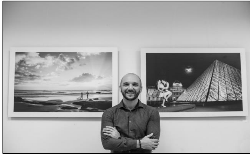
IMAGEM 1 – FOTÓGRAFO OENDERSON MORETTI