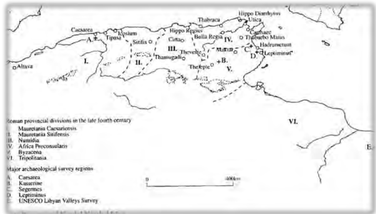
Figure 1.1 Late Roman and Vandal North Africa. MERRILS, A. H (Ed.). Vandals, Romans and Berbers: New Perspectives on Late Antique North Africa . Aldershot, Eng., and Burlington, Vt.: Ashgate, 2004, p. 2.