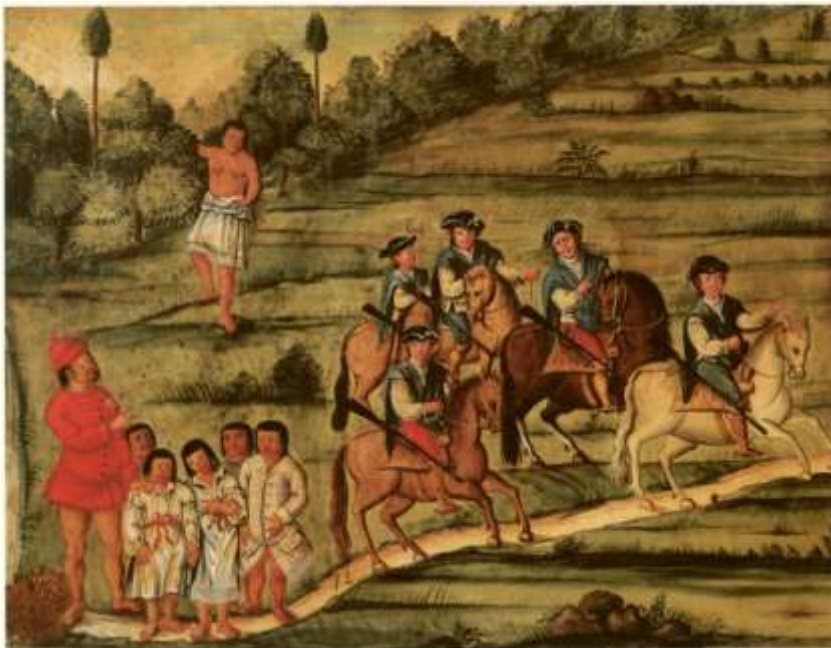
Gravura 10 – Estampa 12: vai sahindo a mulher do mato, e o marido com os filhos vestidos, apontando para onde vão os Cavaleiros.