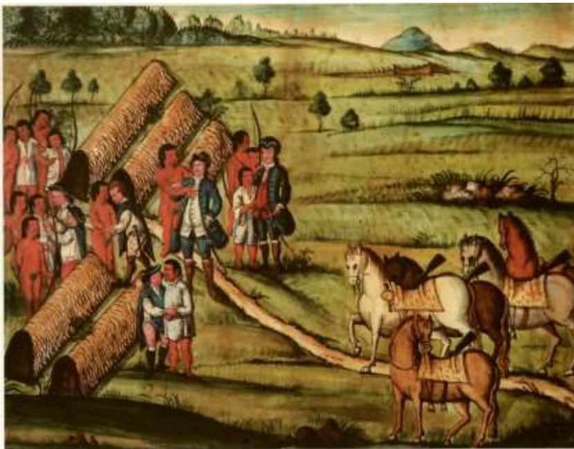
Gravura 22 - Estampa 24: o Tenente Coronel, e mais camaradas apeados tratando com os Índios, e entrarão nos seus arranchamentos, onde tinham retirado mulheres, e filhos.