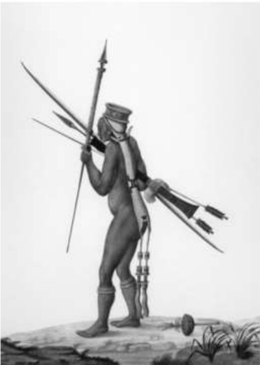
Gravura 41- Índio Caripuna, imagem adaptado de RAMINELLI, Ronald. Do conhecimento físico e moral dos povos: iconografia e taxionamia na Viagem Filosófica de Alexandre Rodrigues Ferreira. In: História, Ciência, Saúde. Manguinhos , vol. VIII (suplemento), 969-92, 2001, p. 969 – 992, por Maria Tereza Aoki.