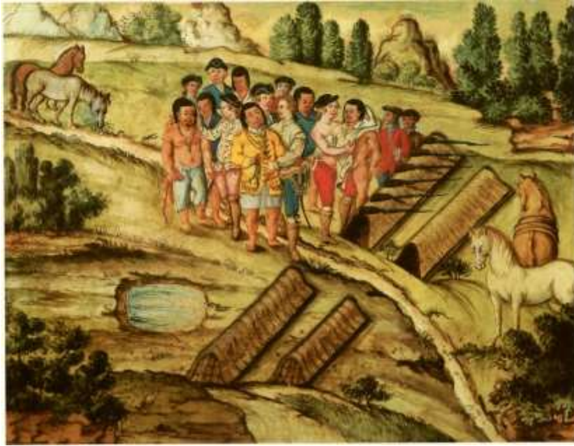
Gravura 15 – Estampa 17: o Tenente Coronel vestindo a sua própria vestia a hum Indio, e os mais Camaradas, despindo as suas camizas, e mais vestidos para vestir outros.