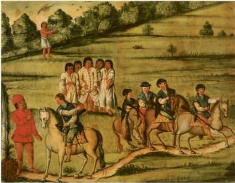
Gravura 9 – Estampa 11: Está praticando o Tenente com o Indio, e mostrando para onde se achava o Tenente Coronel, elle promete vir com mais companheiros, e se despede.