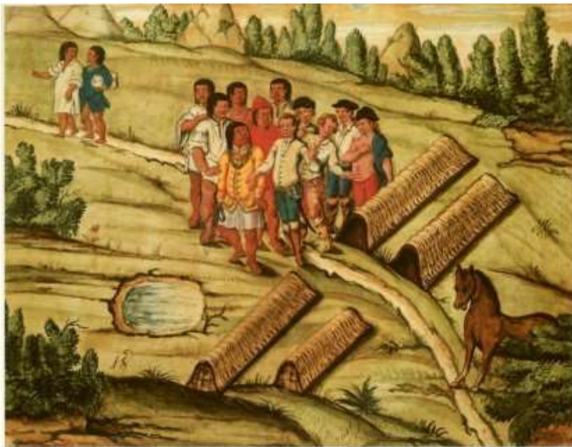
Gravura 16 – Estampa 18: os Indios vestidos com a roupa, que de si pôde tirar a partida, vão dois chamar outros, que ficarão no mato.