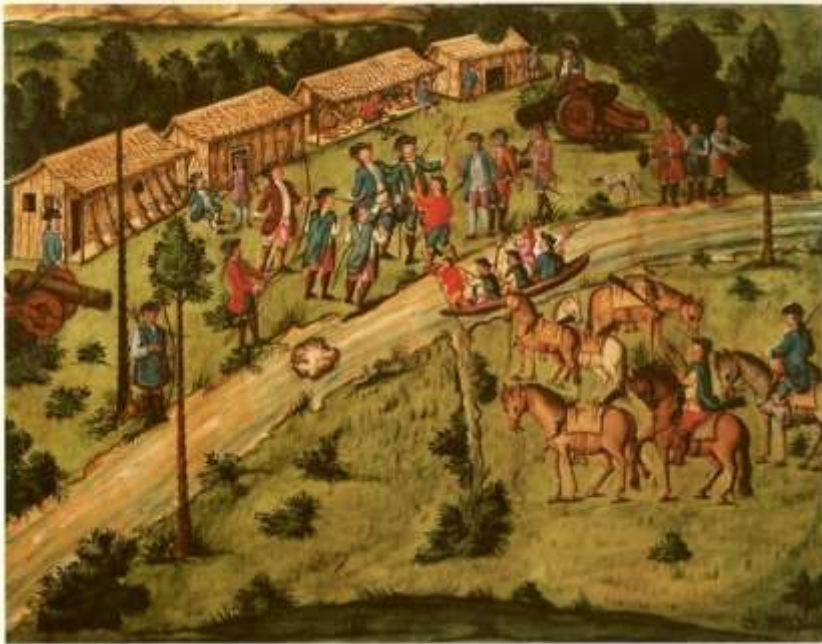
Gravura 25 - Estampa 27: chega o Tenente Coronel ao abarracamento, e os Camaradas, que la tinham ficado, pegão logo nos arcos, e flexas, e mais trastes dos Indios, e se ad'mirão muito.