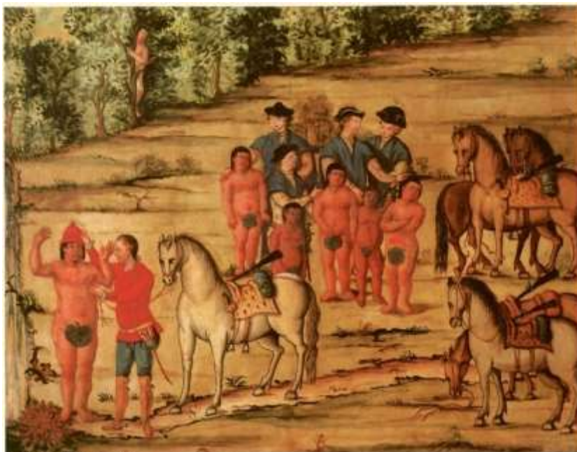
Gravura 6 – Estampa 8: apeace o Tenente, poem o barrete na cabeça do Indio, que está muito pasmado, e os Cavaleiros com os filhos.