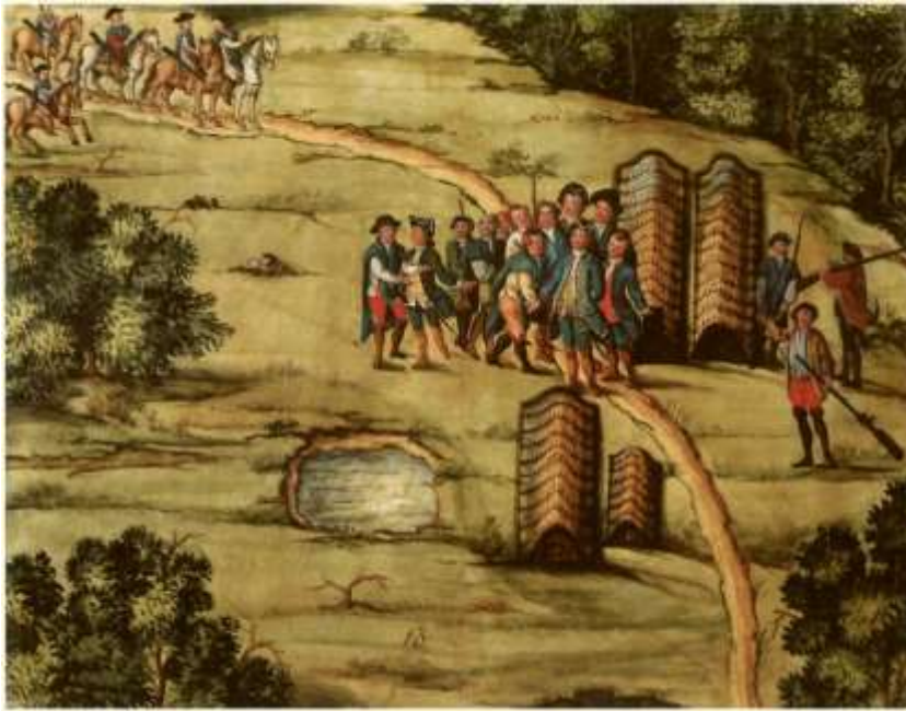
Gravura 11 – Estampa 13: aparecendo o Tenente Cascaes, e mais cavaleiros defronte do arranchamento onde estava o Tenente Coronel, e chegando os que andavão á casa.