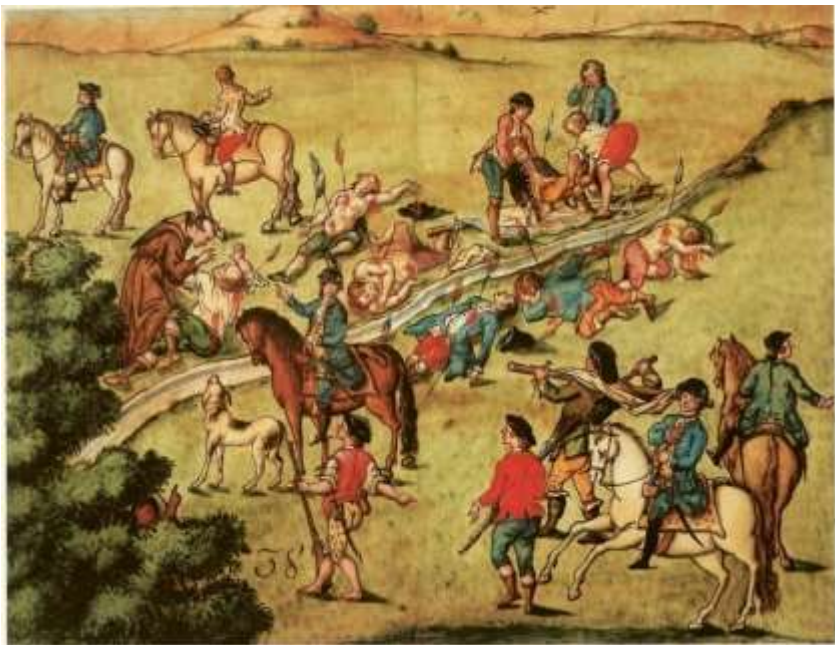
Gravura 36 - Estampa 38: manda o Tenente Coronel ao Tenente Candido Xavier com huma partida de gente de cavallo procurar os Camaradas mortos, e o Padre Cappelão para confeçar hum, e mantendo-se estes nas redes, conduzirão-se ao abarracamento, para se lhes dar Sepultura; não aparecem ja Indios no Campo, e só alguns – muito ao longe que se vão metendo nos mattos.