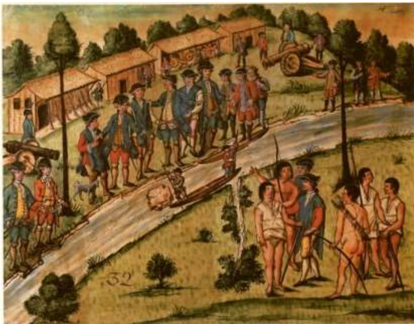
Gravura 30 - Estampa 32: aparecem Índios da outra parte do rio, vão saber dois Camaradas o que que querem, e praticão largo tempo, e a gente do abarracamento observando o que se passa.