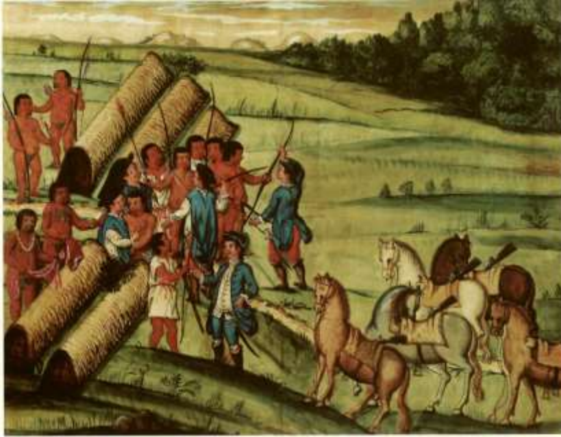
Gravura 23 - Estampa 25: dando os Indios ao Tenente Coronel das suas armas, hum bordão, hum arco, e flexas, e o mesmo aos mais Camaradas, e despedindo-ce.