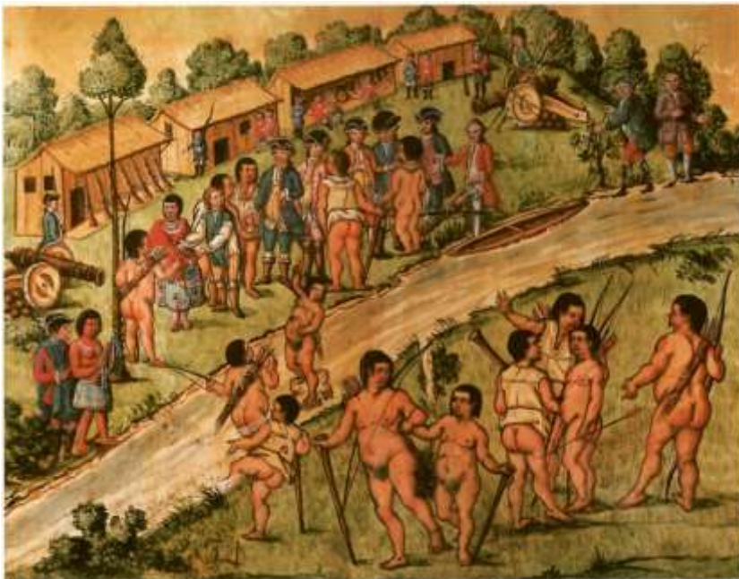
Gravura 32 - Estampa 34: convidão-se os Indios, veste-se huma India com vestidos de chita, que se lhe tinham preparado, e ás mais se lhe dão varias péssas.