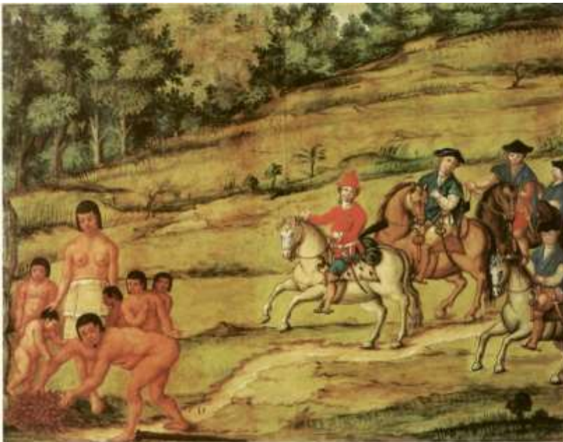
Gravura 4 – Estampa 6: hum Indio com 5 filhos tirando pinhão do Lago, chega a vêlo o Tenente Cascaes com os 5 cavaleiros, que ião descobrir o campo.