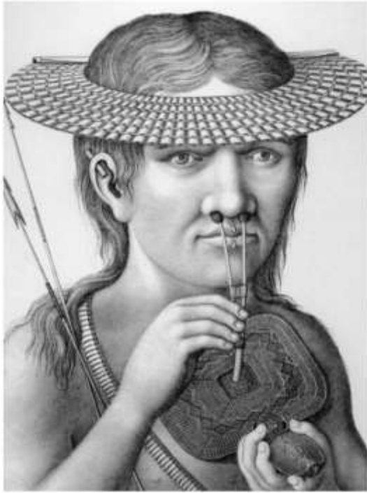
Gravura 40 – Índio Mura inalando paricá, imagem adaptado de RAMINELLI, Ronald. Do conhecimento físico e moral dos povos: iconografia e taxionamia na Viagem Filosófica de Alexandre Rodrigues Ferreira. In: História, Ciência, Saúde. Manguinhos , vol. VIII (suplemento), 969-92, 2001, p. 969 – 992, por Maria Tereza Aoki.