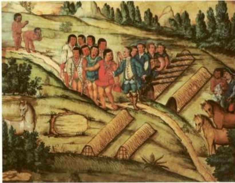
Gravura 19 - Estampa 21: despedindo-se os Índios, pedem ao Tenente Coronel va ao seu arranchamento, distante dali duas legoas, mostrão-lhe o caminho, e elle lhes promete la ir.