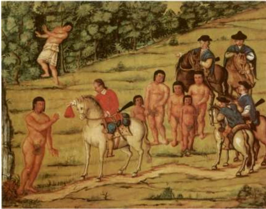
Gravura 5 – Estampa 7: o mesmo Tenente Cascaes, tirando da cabeça hum barrete vermelho, oferecendo-o ao Indio, este receoso de lhe pegar, e os Cavaleiros com os filhos, e a India mantendo-se no matto, olhando para trás a ver o que se passava com o marido e filhos.