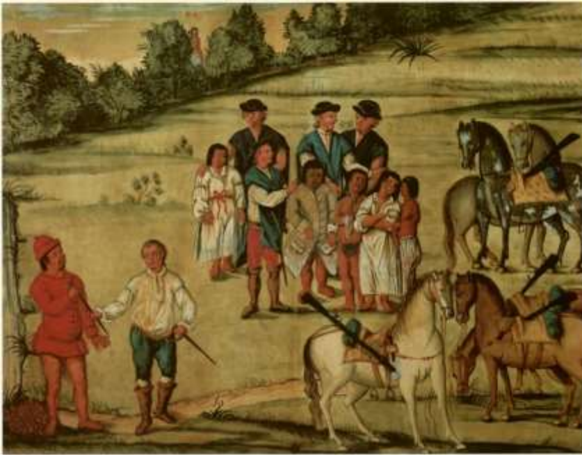
Gravura 8 – Estampa 10: vestido os filhos, e o Indio seu Pay, a May vendo do matto, dá o Tenente hum facção ao Indio o qual o estima muito.