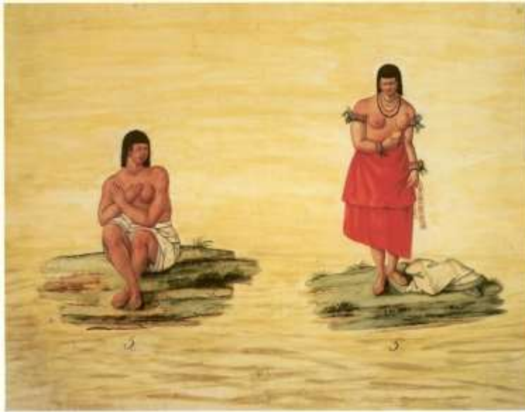
Gravura 3 – Estampa 5: huma India com o pobre fato, sentada para se ver, a mesma India que em lugar da tanga se lhe deu baeta vermelha, chitas, contas, brincos, vidrilhos, e hum espelho, em o qual se está mirando, dizendo aos seus, que está muy guapa.