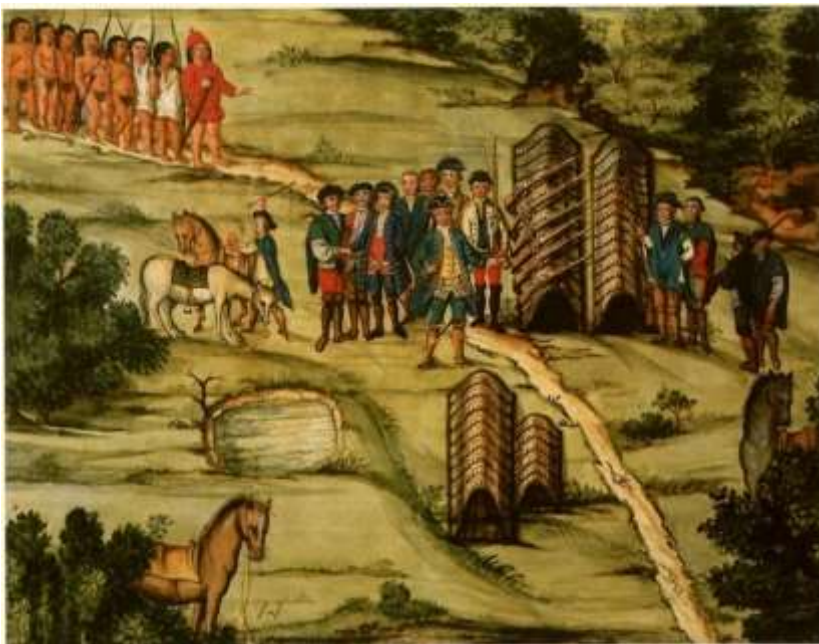
Gravura 12 – Estampa 14: vem os Indios guiados pelo que avia sido encontrado, e vestido o dia antes, e o Tenente Coronel com a mais gente no arranchamento.