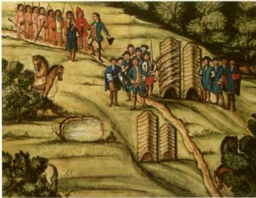
Gravura 13 – Estampa 15: chegando os Indios perto do arranchamento, muito receozos de chegar, mandou o Tenente Coronel recebelos por dois Camaradas dos que no dia antecedente os tinhão encontrado.