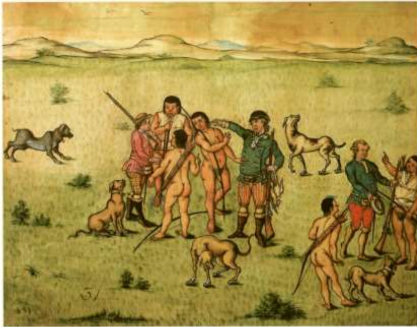
Gravura 29 - Estampa 31: Cassadores encontrando os Índios no campo, e conversando com elles.