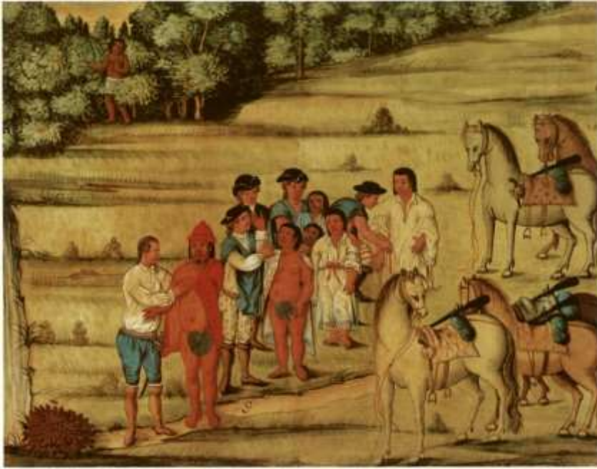
Gravura 7 – Estampa 9: dêspe o Tenente a chimarra vermelha, véstea ao Indio, e os mais Camaradas vestem os filhos, despiendo-se dos seus propios vestidos.