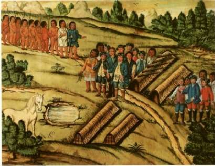
Gravura 17 – Estampa 19: vem chegando mais Indios ao arranchamento, conduzidos pelos dois que já vestidos os forão chamar.