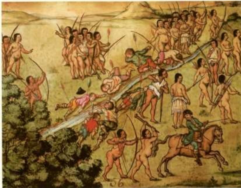
Gravura 34 - Estampa 36: o Cappitão Carneiro que passou alem do rio com outros Camaradas, ficando estes mortos, veyo fogindo.