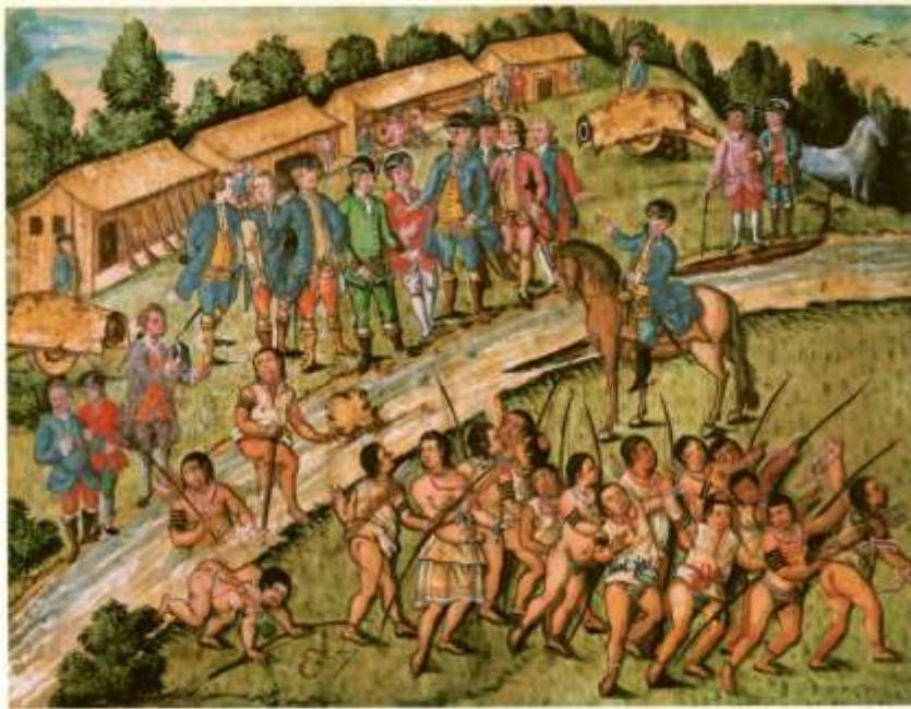
Gravura 35 - Estampa 37: chega o Cappitão Carneiro ao rio defronte do abarracamento, e retirão-se fogindo os Indios, antes que elle possa dar parte ao Tenente Coronel do perigo de que escapou, e da morte dos Camaradas.