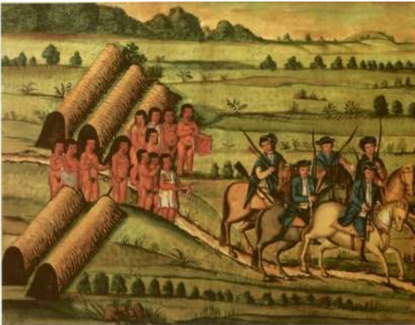
Gravura 24 - Estampas 26: marchando o Tenente Coronel, e Companheiros com arcos, e flexas dos Indios e estes mostrando algumas couzas, que lhe deixou.