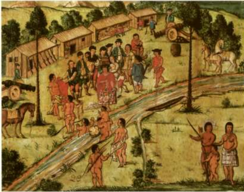
Gravura 27 - Estampa 29: manda o Tenente Coronel vestir os Indios, e outros vão passando o rio com suas mulheres, e filhos ás costas.