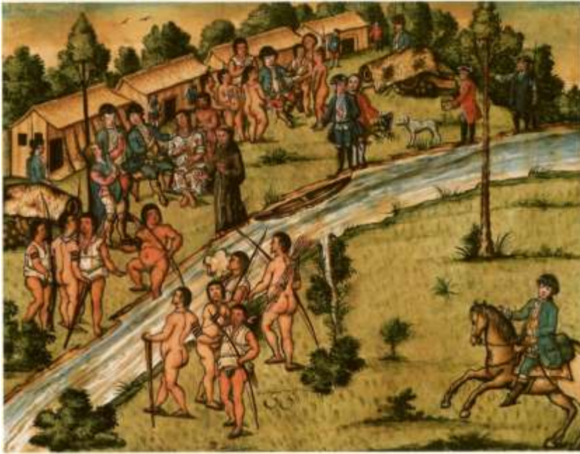
Gravura 33 - Estampa 35: o Tenente Coronel assentado com seis Indios piquenos, e hum por detrás esperando oucazião de matalo, os Cappitae's, e outras pessoas com o Padre Cappellão com huma India ao pé cathequizando-a, e os Indios esperando oucazião de matar a todos.