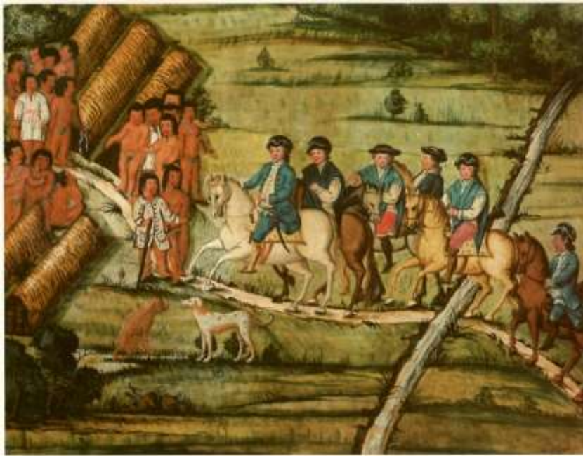
Gravura 21 - Estampa 23: chegando o Tenente Coronel aos ranchos dos Índios, sayem dois a recebelo, e os mais ad'mirados.