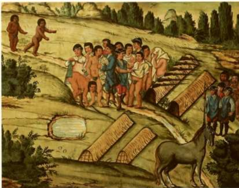
Gravura 18 – Estampa 20: Chegão os novos Indios ao arranchamento, tirão os Camaradas da sua rôpa quanto puderão até ficarem alguns sem camiza, e só com os ponches cubertos, e os vestem.