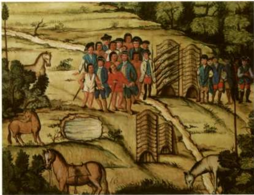
Gravura 14 – Estampa 16: chegão os Indios ao arranchamento, o Tenente Coronel abraça o dianteiro, os mais Camaradas fazem o mesmo, e os festejão muito.