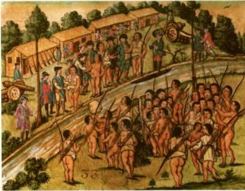
Gravura 31 - Estampa 33: vem os Indios em grande quantidade dispostos á traição, que tinham premeditado.