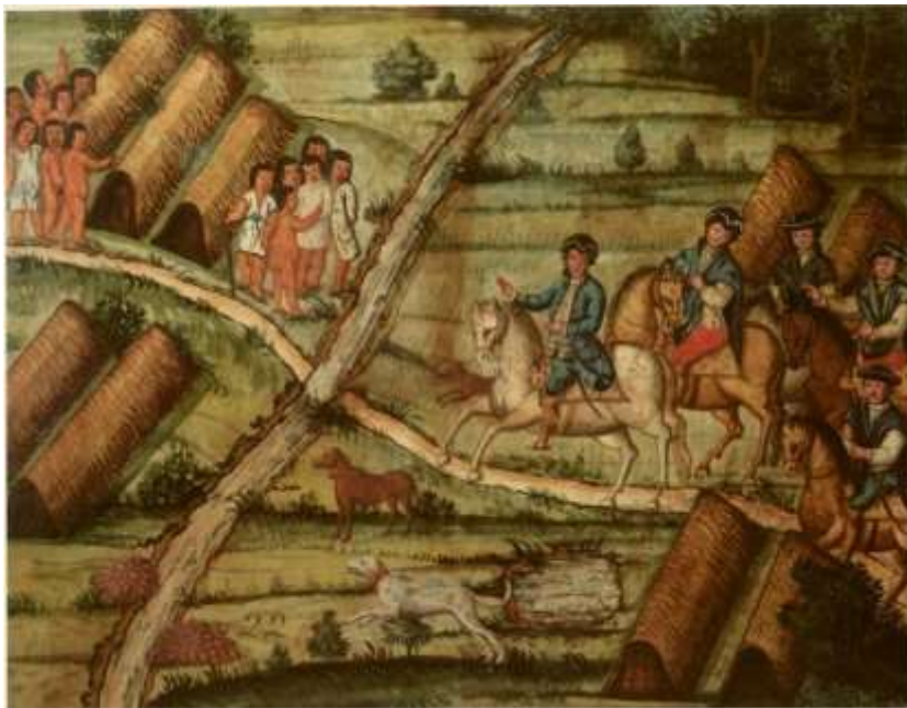
Gravura 20 - Estampa 22: parte o Tenente Coronel á arrancharia dos Índios, que tanto que o virão alvoracados o esperão.