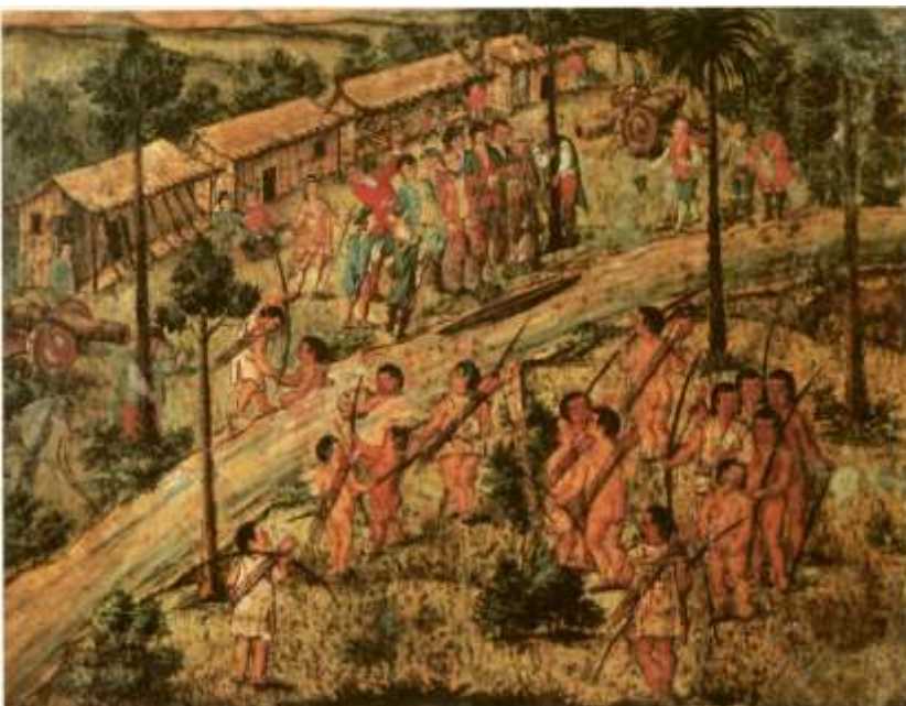
Gravura 26 - Estampa 28: aparecem os Indios defronte do abarracamento, chegam ao rio e o vão passando, recebe-os o Tenente Coronel, e os mais Camaradas com muito gosto.