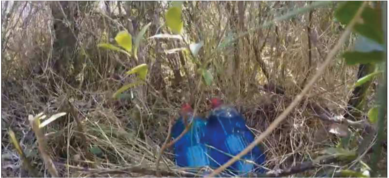
FIGURA 8: DEPÓSITO TEMPORÁRIO DE ÁGUA PARA COMBATE A INCÊNDIO.