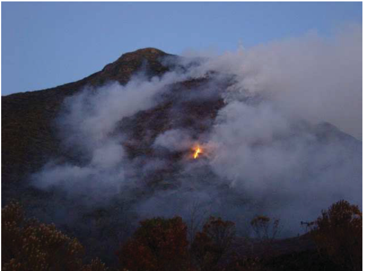
FIGURA 9: INCÊNDIO DO PICO CARATUVA