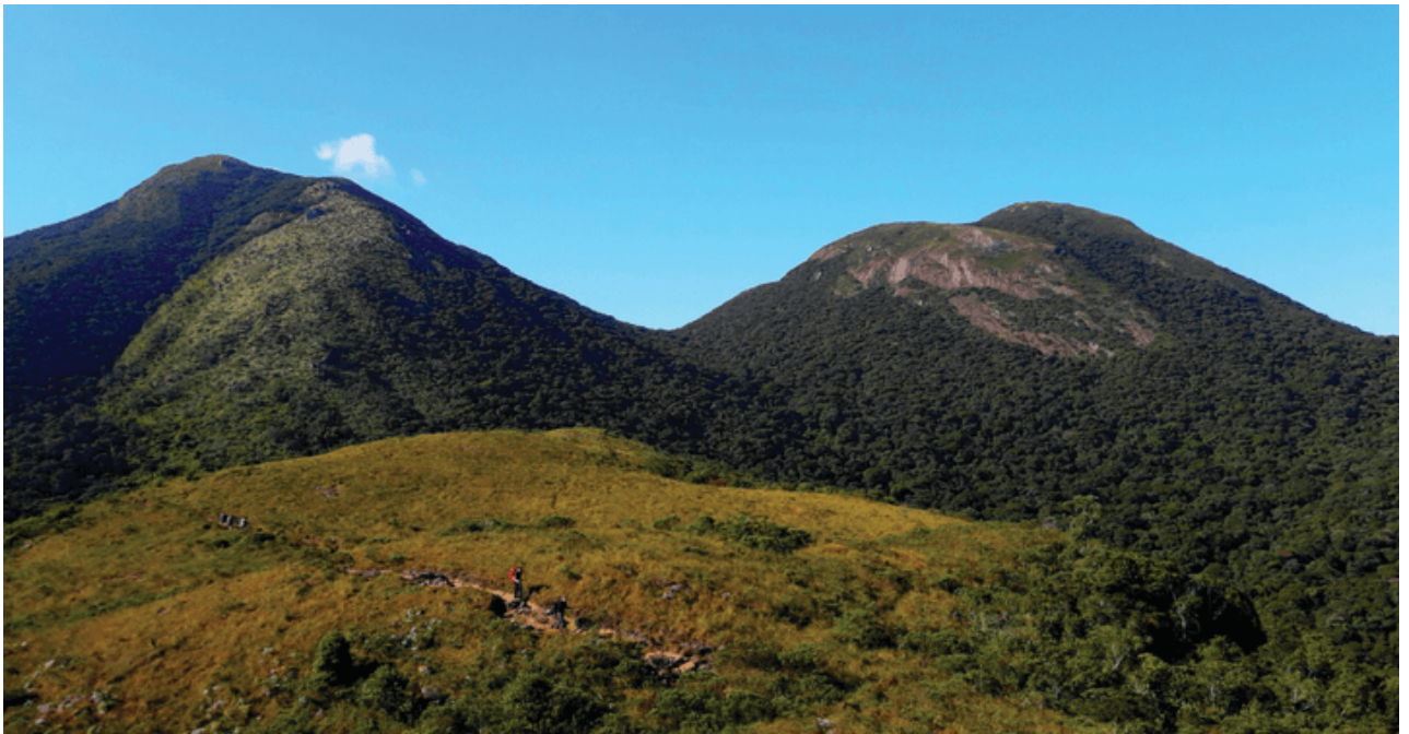
FIGURA 2: À ESQUERDA PICO CARATUVA E A DIREITA PICO ITAPIROCA

No cume desta montanha há antenas de rádio amador, que são vistas de longe. Do cume do Caratuva o visitante pode ver o imponente Pico Paraná, o litoral paranaense, a represa do Capivari, o morro Itapiroca, os picos Tucum e Camapuã, além do Ciririca com suas gigantes placas de alumínio. Mais ao longe também se pode contemplar o Conjunto Marumbi. A caminhada do início da trilha até o cume do Pico Caratuva leva de 3 a 5 horas.