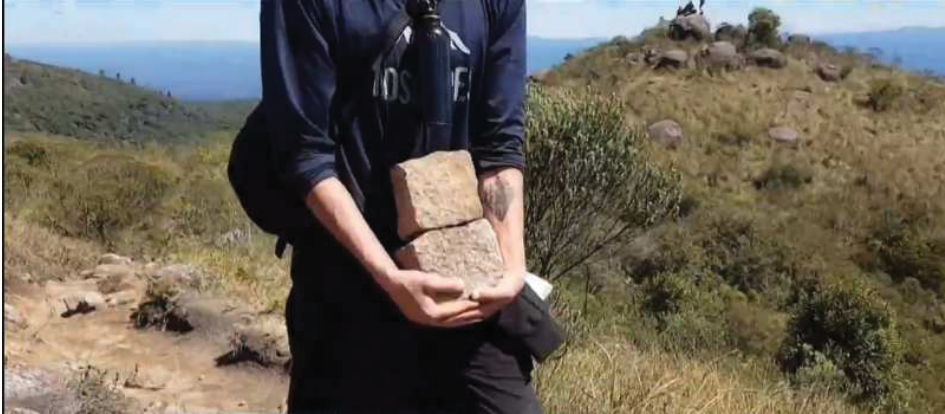
FIGURA 6: VOLUNTÁRIO CARREGANDO PEDRAS PARA EVITAR EROSÕES EM 21/09/2018.