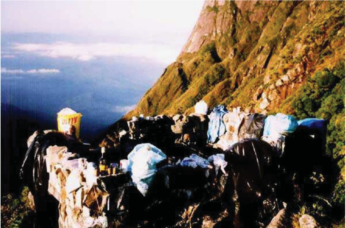
FIGURA 7: DEPÓSITO DE LIXO, DEIXADO POR VISITANTES NO PICO PARANÁ.