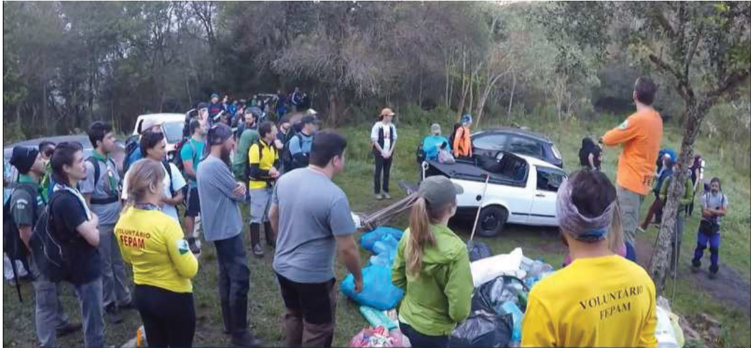
FIGURA 4: ENCONTRO DE VOLUNTÁRIOS PARA LIMPEZA NAS TRILHAS

Entre as atividades realizadas no âmbito do programa adote uma montanha, destacam-se as atividades de limpeza nas trilhas (FIGURAS 4, 5 e 7) que dão acesso as montanhas do Parque Estadual Pico Paraná, colocação de pedras em trechos das trilhas sujeitos a alagamentos ou erosão (FIGURA 6) e criação de depósitos de água para combate a incêndio (FIGURA 8).