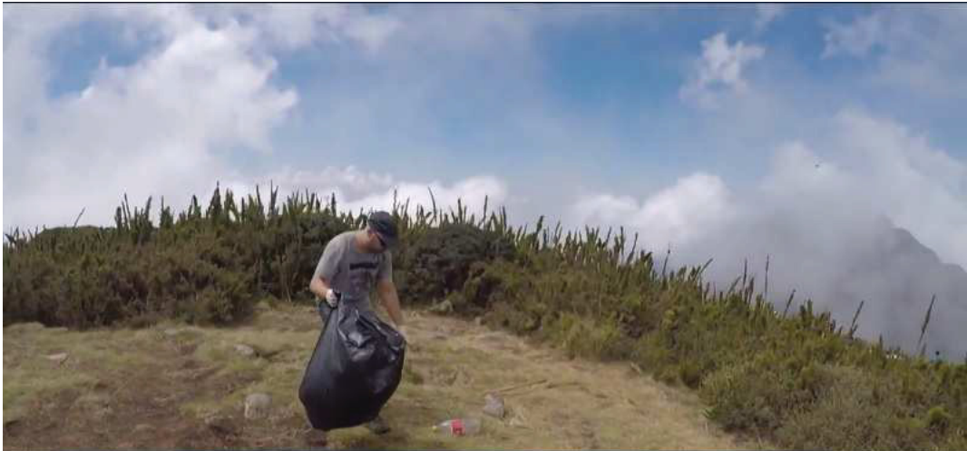
FIGURA 5: VOLUNTÁRIO REALIZANDO LIMPEZA NA TRILHA EM 21/09/2018.