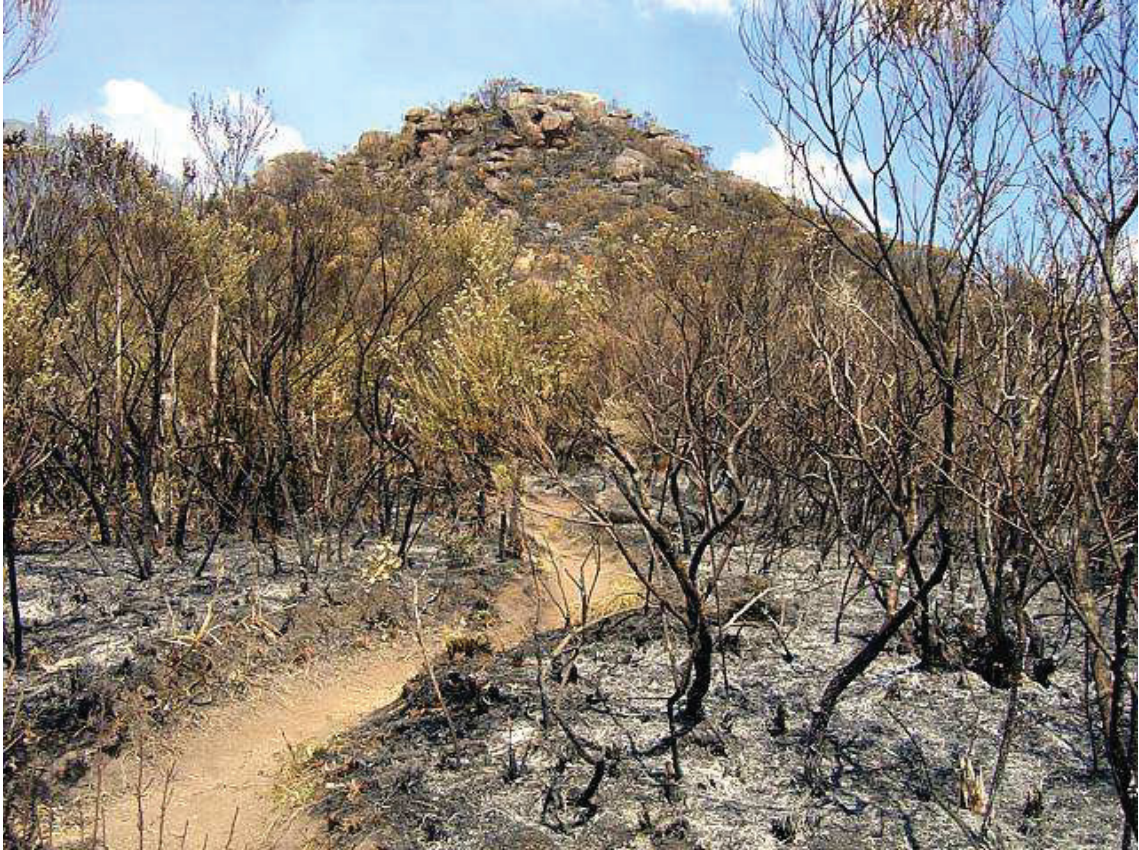
IMAGEM 12: INCÊNDIO NO PICO CARATUVA