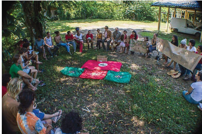
FIGURA 2: RODA DE CONVERSA NO ACAMPAMENTO (ANTONINA/PR)

comunidade, essa prática contribuiu em muito com o processo organizativo do acampamento pois a maioria dos grupos em vinda a comunidade o faziam apenas para um dia então ter os estudantes em vivência de até três dias foi construtivo.