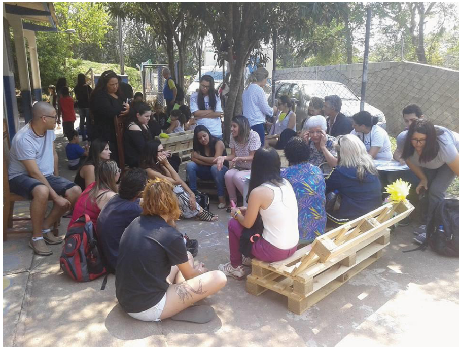
FIGURA 1: RODA DE CONVERSA EM IBIUNASP