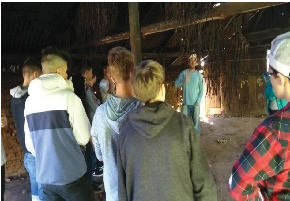
FIGURA 03: MEDIAÇÃO NA CASA DE REZA DA ALDEIA ARAÇAI.

Jovens percorrendo os espaços da aldeia e se apropriando de conhecimentos, interagindo com o meio de forma produtiva.