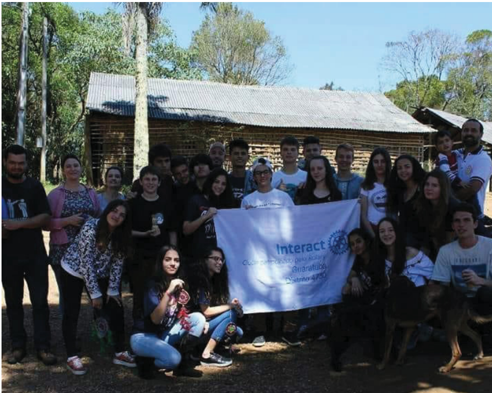
FIGURA 01- GRUPO DO INETERACT GUARATUBA NA VISITA DA ALDEIA ARAÇAÍ