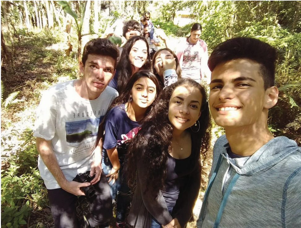
FIGURA 02: PASSEIO INTERATIVO COM O GRUPO NA TRILHA DA ALDEIA ARAÇAI