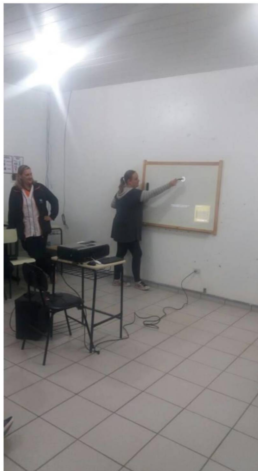
FIGURA 14: DEMONSTRAÇÃO PRÁTICA DA UTILIZAÇÃO DA LOUSA DIGITAL

Muitos professores não sabiam como utilizá-la (Figura 14), e após as explicações interativas e na prática, se sentiram mais confiantes para inserir esse recurso extremamente importante em seu planejamento e atividade com os alunos, o que enriquecerá sobremaneira o trabalho, auxiliando no desenvolvimento cognitivo.