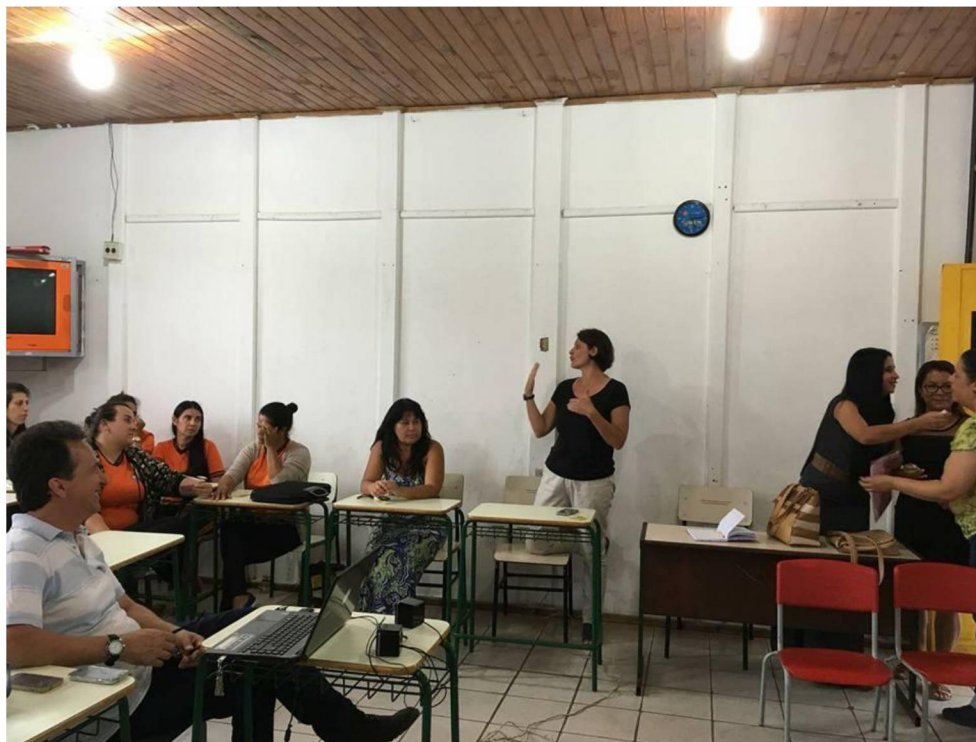
FIGURA 3: SEGUNDO ENCONTRO