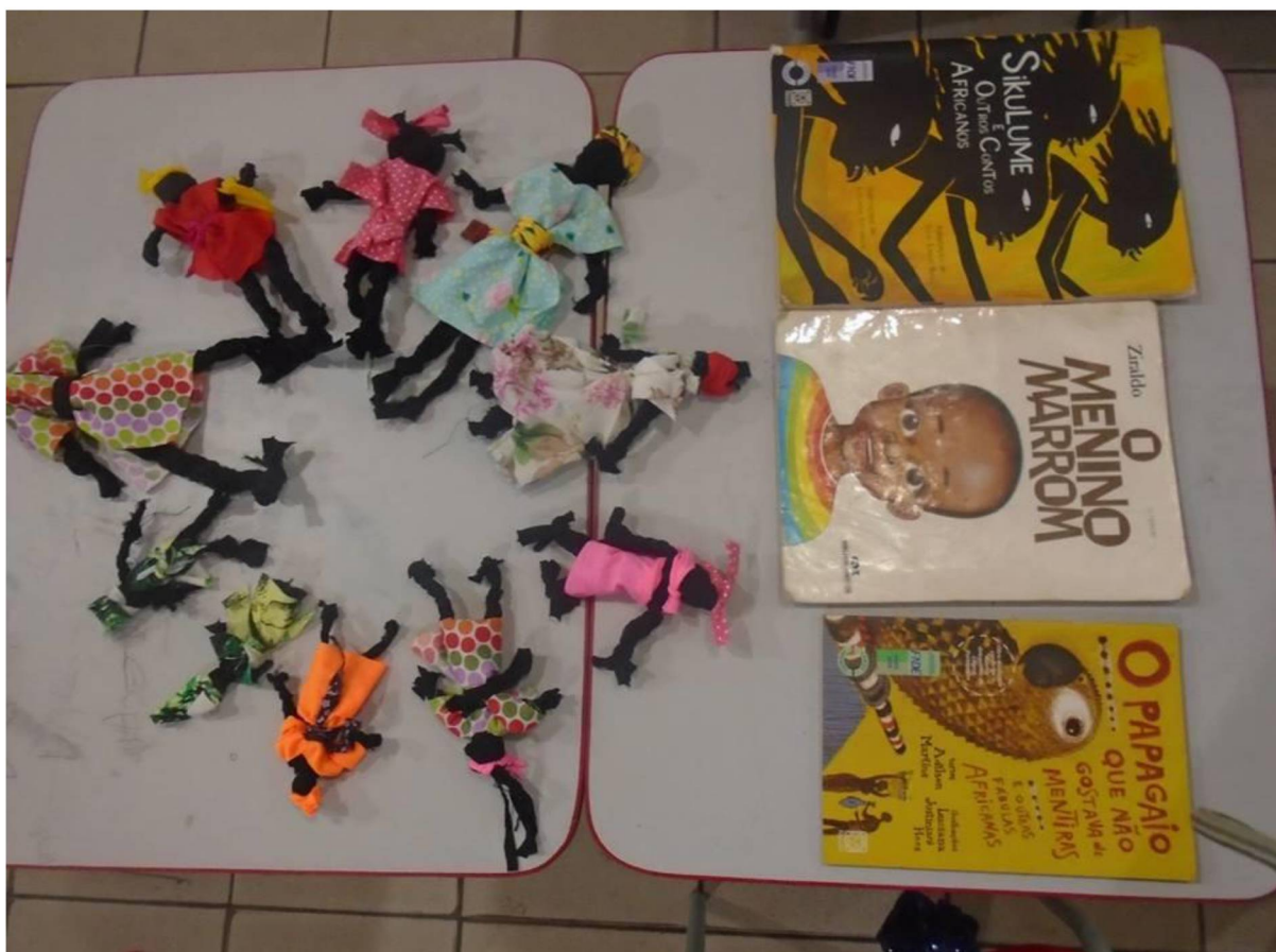
FIGURA 8: BONECAS ABAYOME PRODUZIDAS E LITERATURA AFRO INFANTIL

simples e significativa, podendo ser realizado por adultos como também pelas crianças (Figura 8).