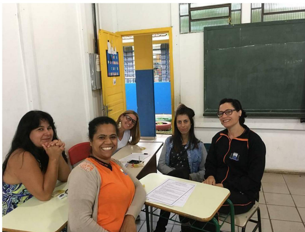
FIGURA 4: TROCA DE EXPERIENCIAS