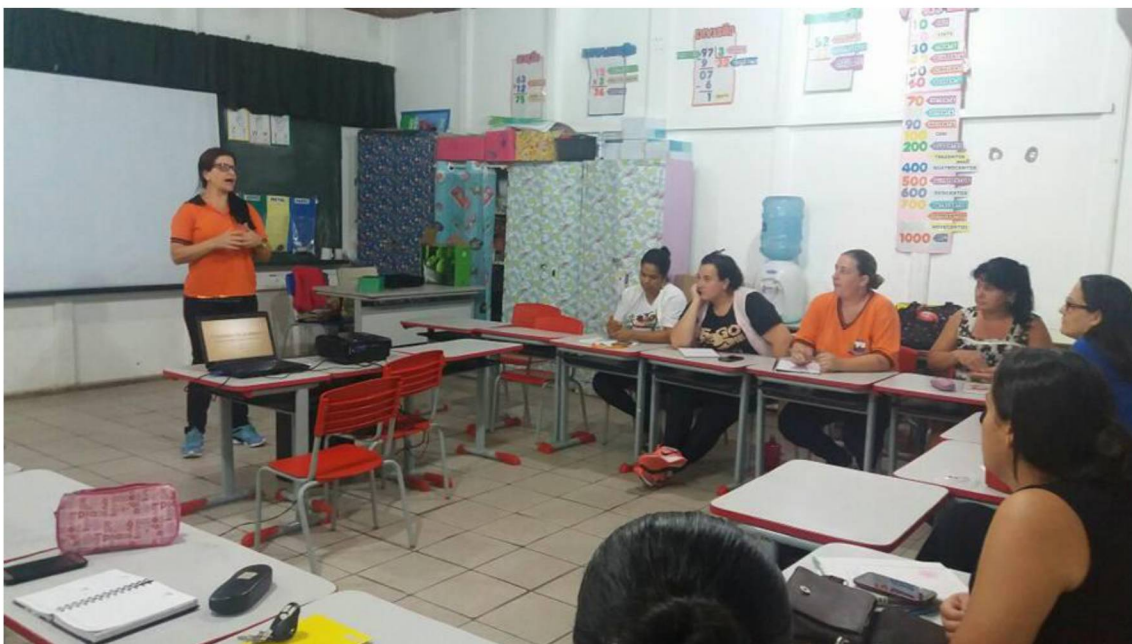
FIGURA 10: TROCA DE SABERES

para adaptar em LIBRAS o conteúdo curricular que a professora transmite aos demais alunos. Também há a presença de aluno com Síndrome de Down e surdez, que mesmo contando com professora de apoio, também deve ser acolhido e observado pela professora regente, e muitas vezes é difícil ao professor regente a aprendizagem das peculiaridades de cada quadro clínico para desenvolver o trabalho com todos os alunos, buscando seu desenvolvimento pleno. A troca de saberes e experiências entre docentes facilita esse processo (Figura 10).