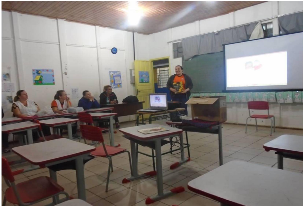
FIGURA 5: ESCOLHA E APRESENTAÇÃO DE LITERATURA

Durante a oficina houve o debate acerca da literatura afro-brasileira com análise de algumas obras escolhidas de acordo com a faixa etária dos alunos, para posterior trabalho com eles (Figura 5).