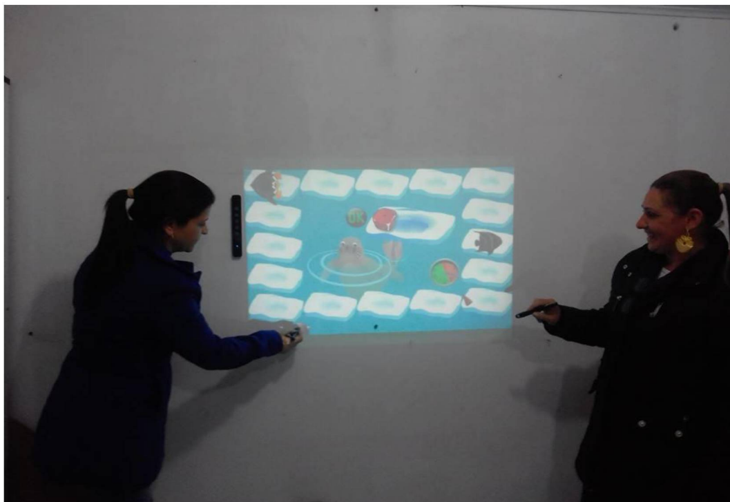
FIGURA 13: LOUSA DIGITAL

Os avanços tecnológicos ocorridos em nossa sociedade ainda são tímidos dentro do ambiente escolar. A utilização de Data Show e recursos áudio visuais normalmente são esporádicos assim como a maneira correta e as diversas utilizações da lousa digital (Figura 13), e as possibilidades pedagógicas que ela permite principalmente em se tratando de turmas de Alfabetização.