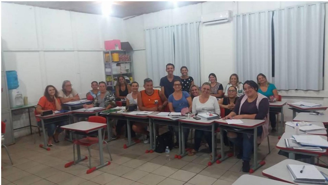
FIGURA 15: CURSO DE IDIOMA FRANCÊS

No dia quinze de março de 2018 teve início um projeto em parceria com a Prefeitura Municipal de Guaratuba, UFPR e Consulado Francês (Figura 15).