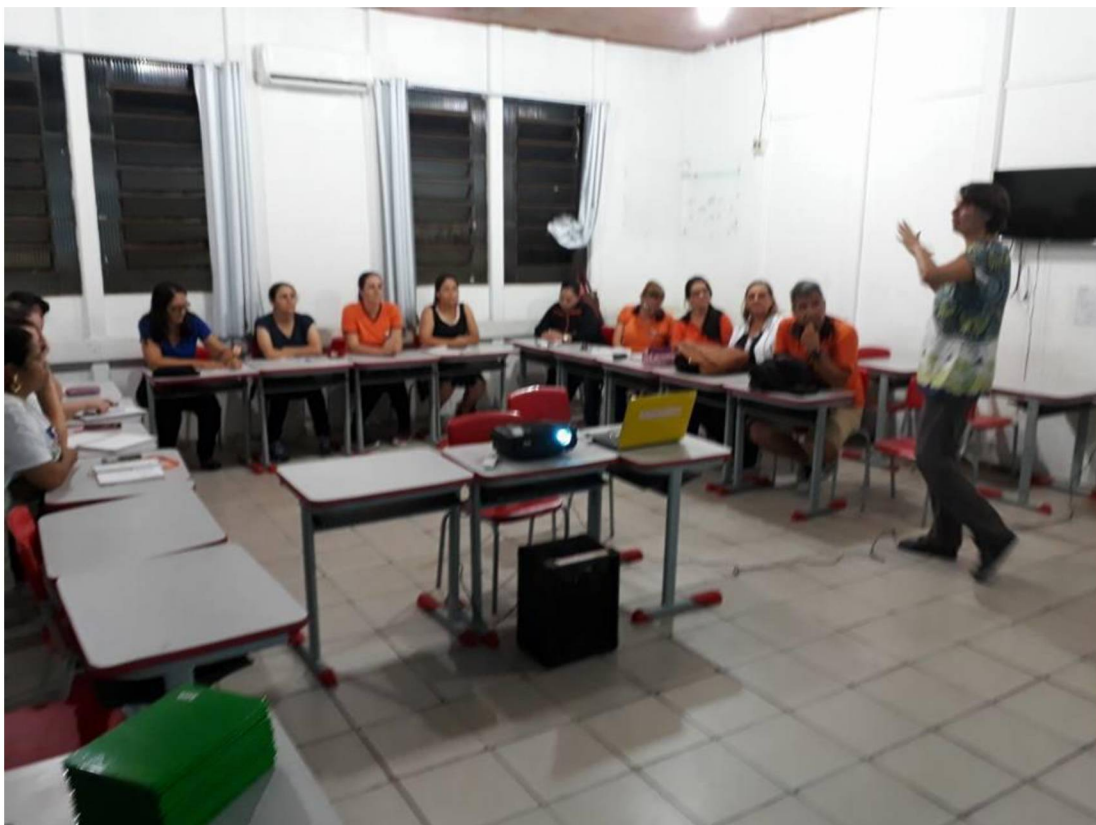
FIGURA 9: OFICINA O TRABALHO DO PROFESSOR

A troca de conhecimentos foi um momento extremamente importante desta oficina, onde os professores tiveram liberdade para expor suas dificuldades principalmente relacionadas à confecção do planejamento pedagógico além de questões relacionadas ao domínio de turma, uma problemática que infelizmente é realidade de todo o sistema educacional.