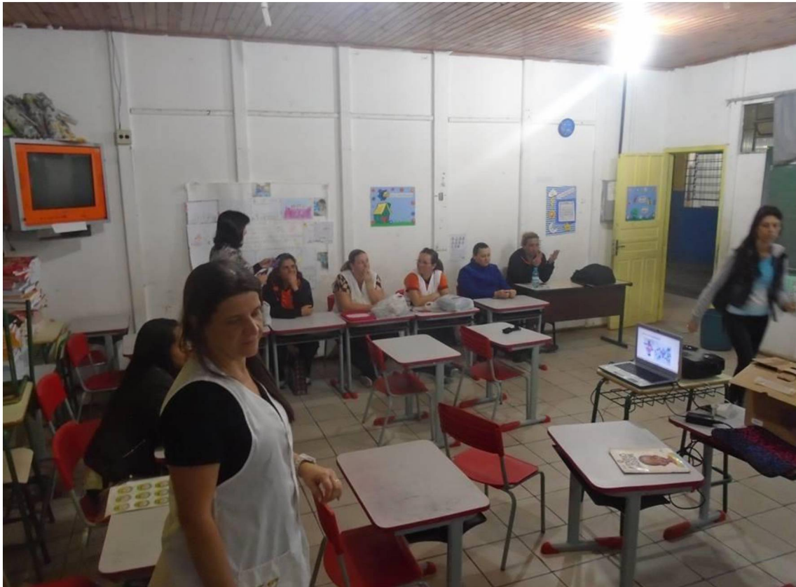
FIGURA 6: TROCA DE CONHECIMENTOS

continuada normalmente ofertados pela Secretaria Municipal de Educação onde a tônica se dá em palestras e os professores se tornam apenas ouvintes, a oficina se torna dinâmica porque todos falam, todos contribuem e se sentem responsáveis e ativos na condução do processo (Figura 6).