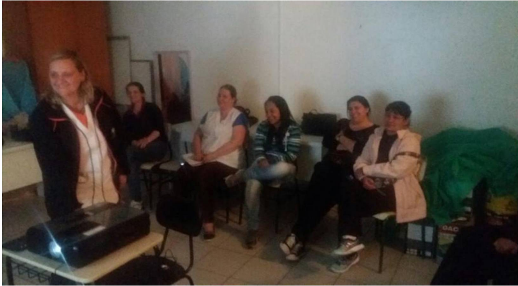
FIGURA 12: OFICINA MÍDIA E EDUCAÇÃO NA SALA DE AULA