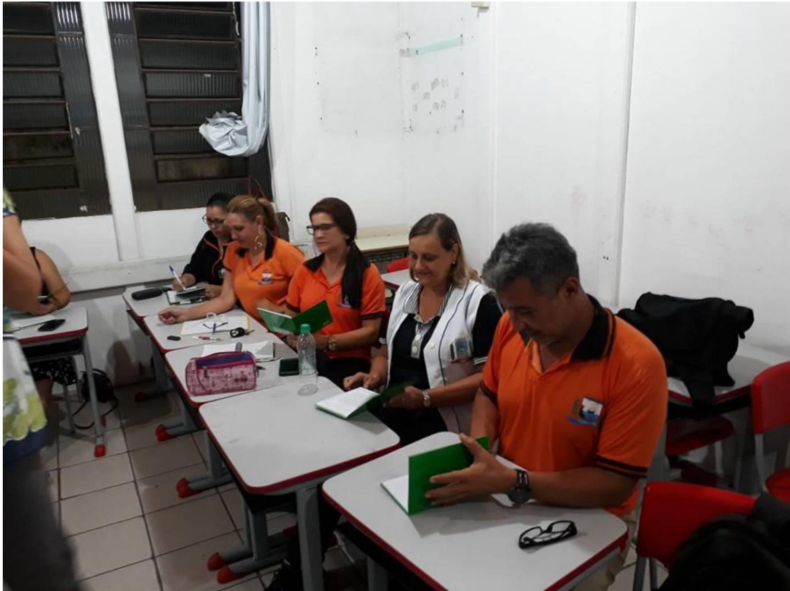
FIGURA 11: CADERNO DE ANOTAÇÕES DA PRÁTICA

Como a oficina é um momento limitado de reflexão e prática, ao final dela cada professor recebeu um caderno (Figura 11), com a proposta de que nele fossem anotadas e registradas experiências significativas do cotidiano, dificuldades e situações que poderiam ser compartilhadas com os colegas em momentos posteriores.