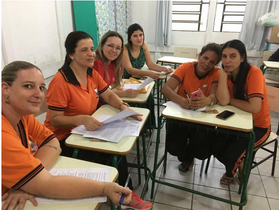
FIGURA 2: PROFESSORAS PARTICIPANTES DA OFICINA

elaboração de um bom plano de aula e também se propôs a elaboração de um planejamento para aplicação com os alunos.