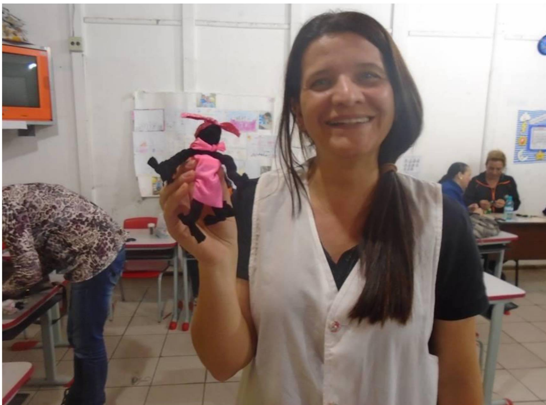
FIGURA 7: CONFECÇÃO BONECA ABAYOME

Para acalantar seus filhos durante as terríveis viagens a bordo dos tumbeiros – navio de pequeno porte que realizava o transporte de escravos entre África e Brasil – as mães africanas rasgavam retalhos de suas saias e a partir deles criavam pequenas bonecas, feitas de tranças ou nós, que serviam como amuleto de proteção. As bonecas, símbolo de resistência, ficaram conhecidas como Abayomi, termo que significa ‘encontro precioso’, em lorubá, uma das maiores etnias do continente africano cuja população habita parte da Nigéria, Benin, Togo e Costa do Marfim.