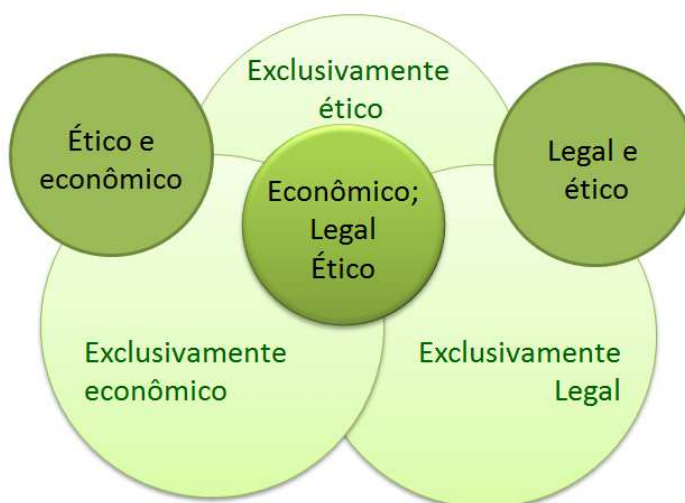
Figura 3 – Modelo dos três domínios da responsabilidade social empresarial