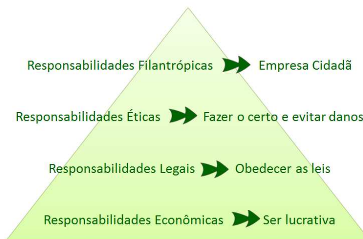
Figura 2 – Pirâmide da responsabilidade social de Carroll

Fonte: Adaptado de Carrol (1991, apud BARBIERI e CAJAZEIRA, 2009. p.54)