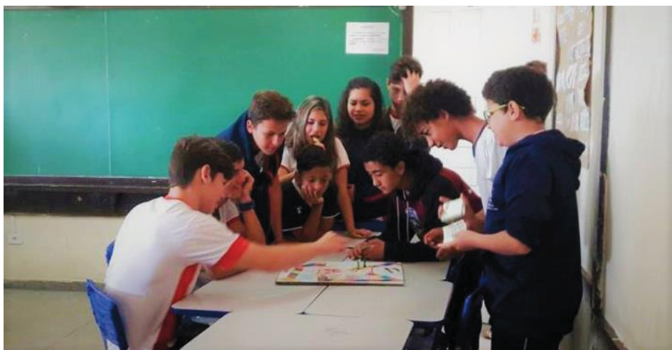
FIGURA 7 - INTERCÂMBIO ENTRE ESCOLAS ATRAVÉS DO JOGO DIDÁTICO.