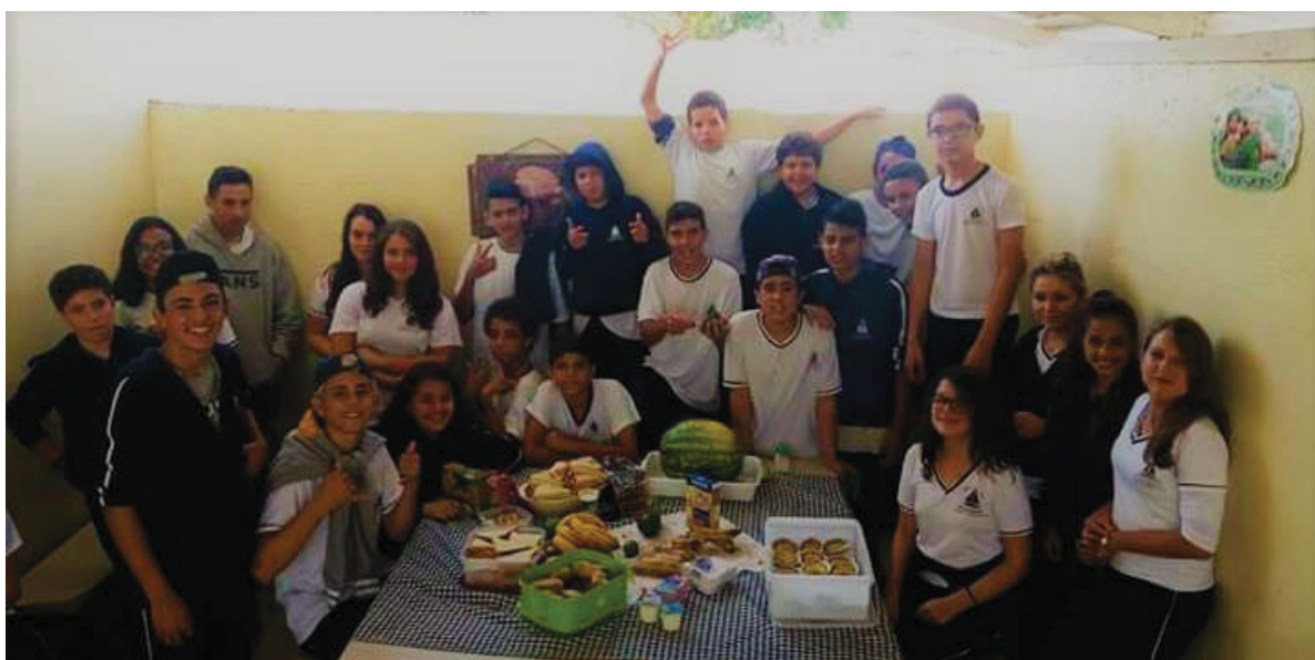
FIGURA 5 - ESTUDANTES CONFRATERNIZANDO NO CAFÉ SAUDÁVEL PRODUZIDO POR ELES MESMOS