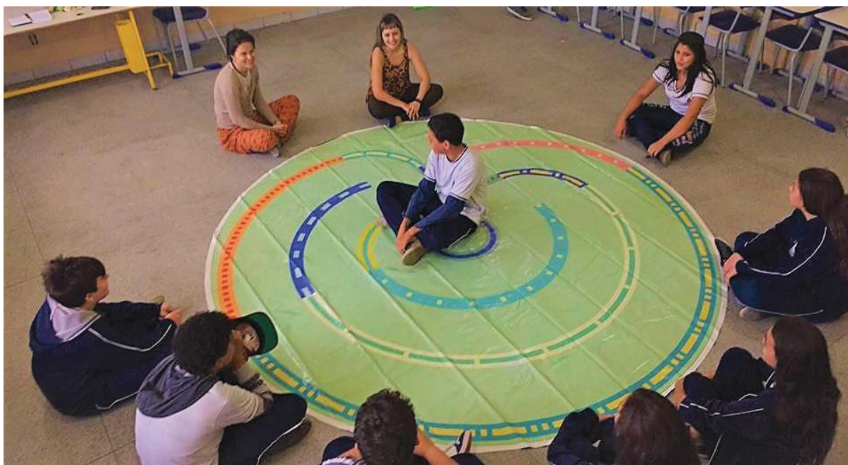
FIGURA 6 – OFICINA DE LABIRINTO LÚDICO

que gerava desconforto ou vergonha. Sugerimos, portanto que essa ferramenta possa ser uma forma de ajudar a construir o sentimento de cumplicidade e companheirismo entre os educandos.