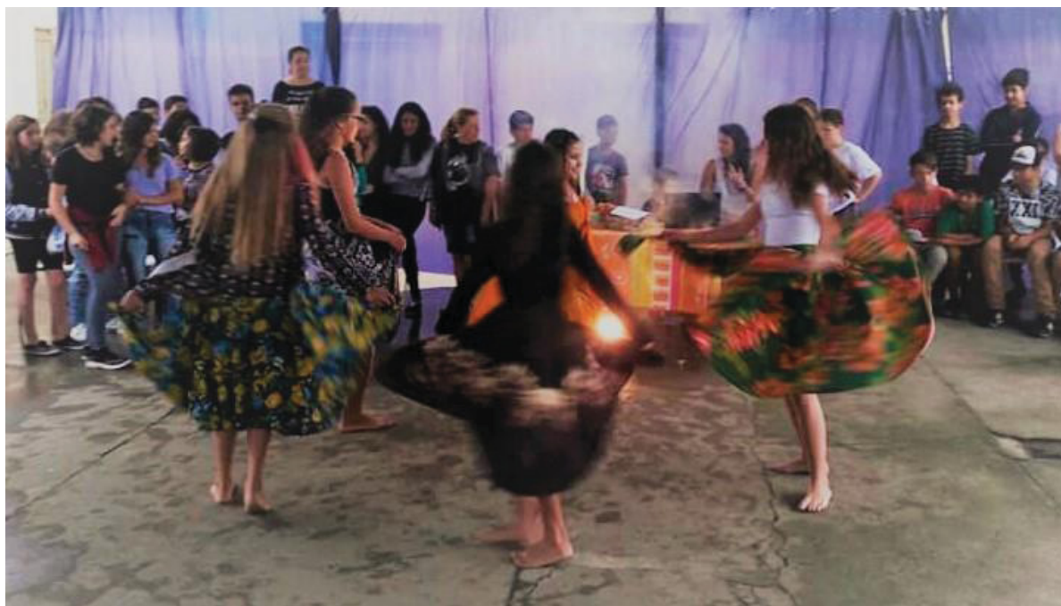
FIGURA 8 – MENINAS DANÇANDO CARIMBÓ