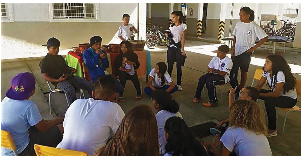
FIGURA 11 - RODA DE CONVERSA – INTERCÂMBIO CULTURAL

Essas ações contribuem no combate aos preconceitos e pré-julgamentos contra os povos indígenas, como diz Paulo Freire (1996, p.60) “Qualquer discriminação é imoral e lutar contra ela é um dever por mais que se reconheça a força dos condicionamentos a enfrentar.”