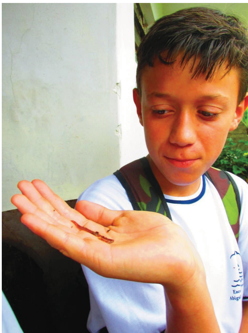
FIGURA 3 - AULA DE CAMPO ESPAÇO FRANCISCO AMARO, ESTUDANTE MOSTRANDO A MINHOCA QUE PRODUZ ADUBO.