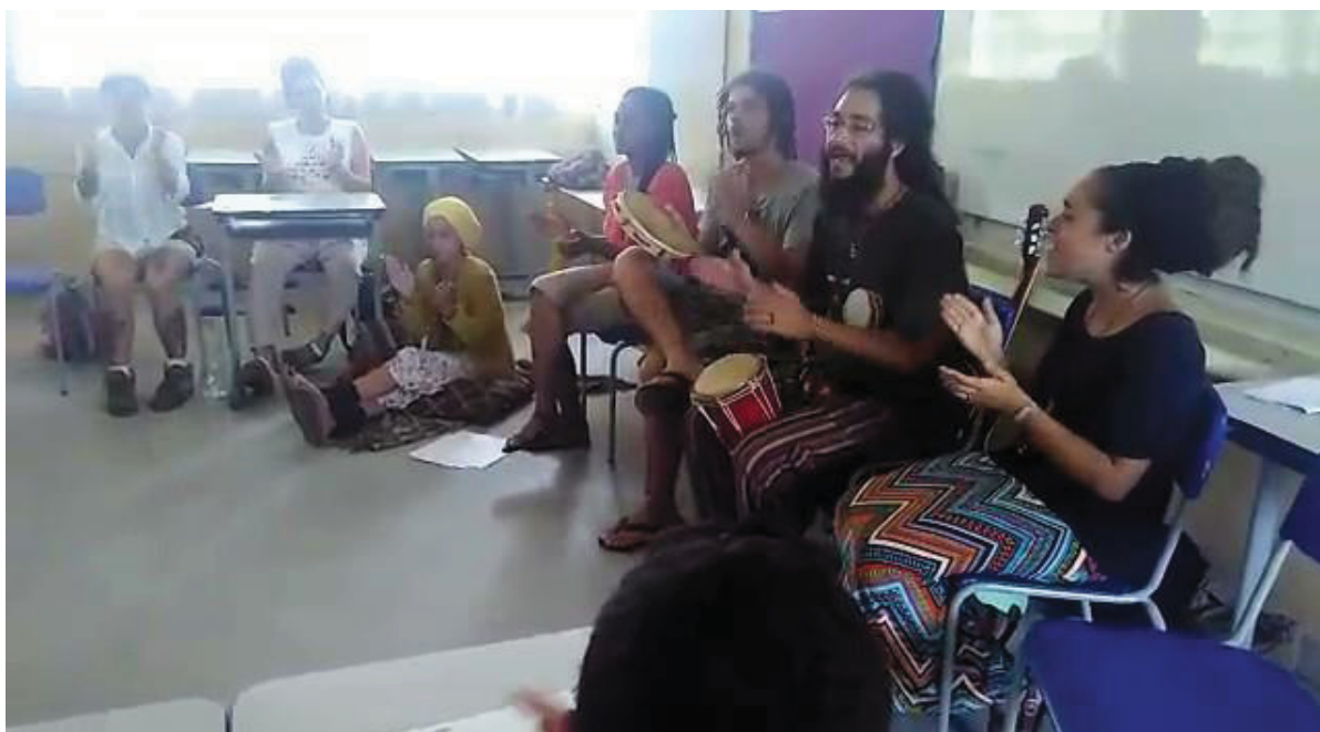
FIGURA 9 - DESCONSTRUINDO PRECONCEITOS ATRAVÉS DA MÚSICA REGGAE