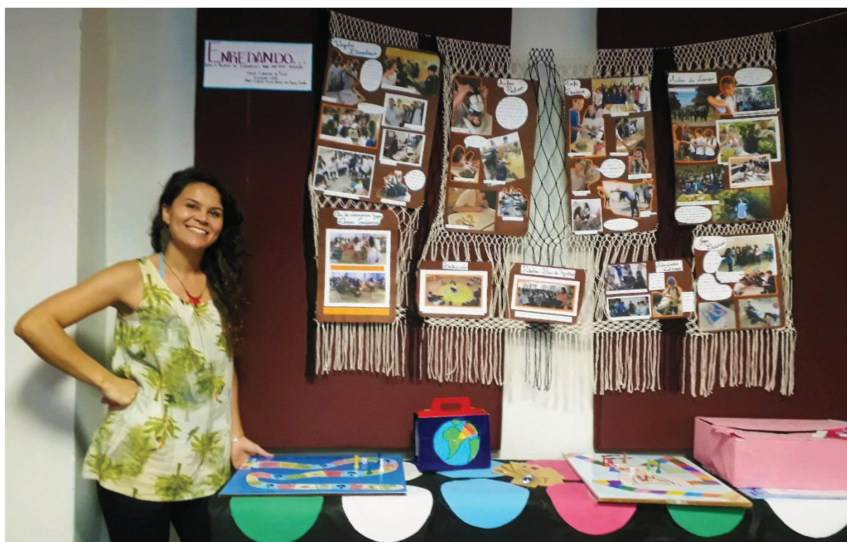
FIGURA 12 – PAINEL PARA II CONANE CAIÇARA

composição dessa apresentação foi uma ferramenta de reflexão e significação do meu trabalho, agregando, inclusive, para a descrição deste memorial. Nesse sentido, apresentar o painel foi natural pois estava integrada a ele. Chamei-o: “ENREDANDO – Unindo elos de Alternativas para uma Nova Educação”.