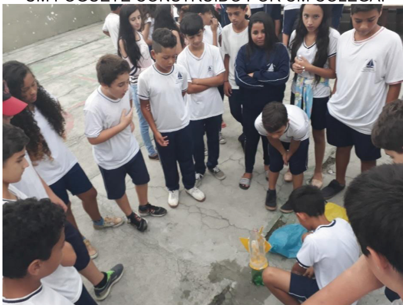
FIGURA 2 – ESTUDANTES DE 6 o E 7 o ANOS PARTICIPANDO DO LANÇAMENTO DE UM FOGUETE CONSTRUÍDO POR UM COLEGA.

A principal adaptação no momento é estudar formas de incluir no cronograma um 5 o Momento, no qual faremos uma análise em forma de conversa e autoavaliação do aprendizado teórico e empírico envolvido no processo de construção projeto.