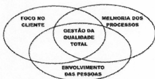
Gestão da qualidade total – (Figura 1)

Então se verifica que a qualidade é o resultado dos processos de produção dos produtos e serviços, bem como dos processos de apoio que suportam e complementam os processos de produção, como compras, treinamento de funcionários, entre outros. Por mais que os processos sejam adequados, para existir bons resultados é importante que as pessoas se dediquem a operá-los e melhora-los. Devido a isso, existem três elementos fundamentais da gestão da qualidade total, que são: foco no cliente, melhoria dos processos e envolvimento das pessoas.