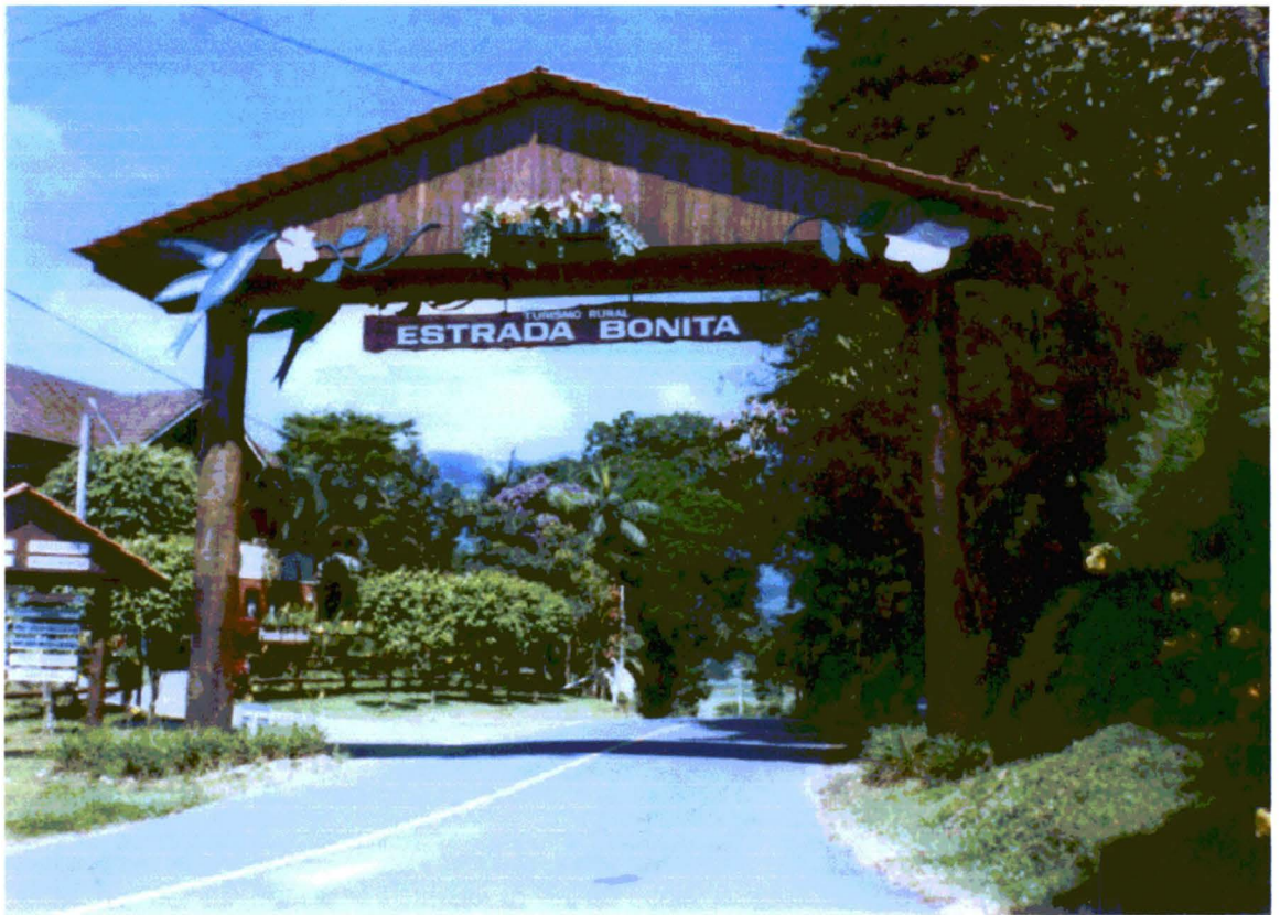
Figura 1: Portal da Estrada Bonita.