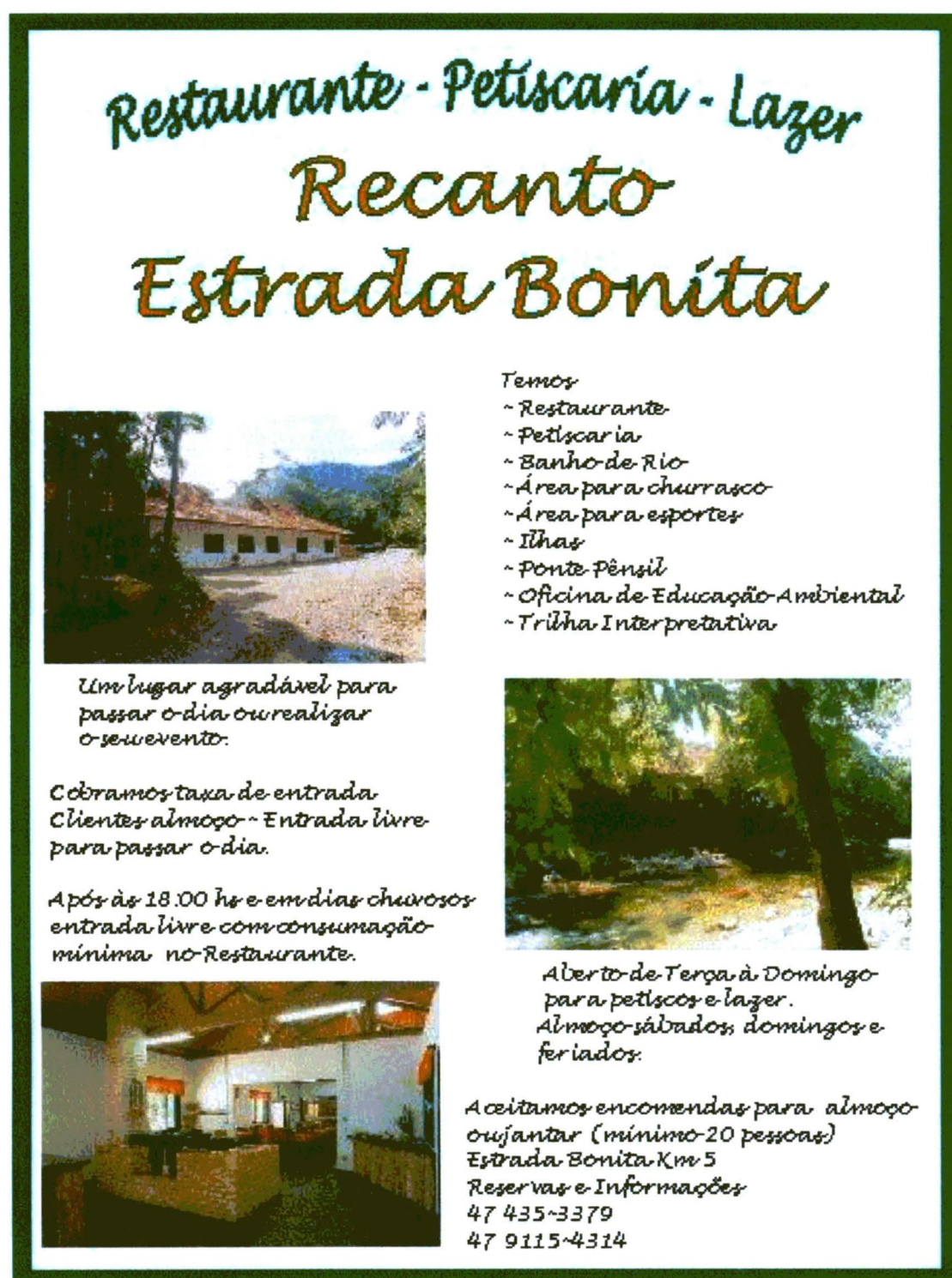
Figura 4 – Folder de divulgação Recanto Estrada Bonita.