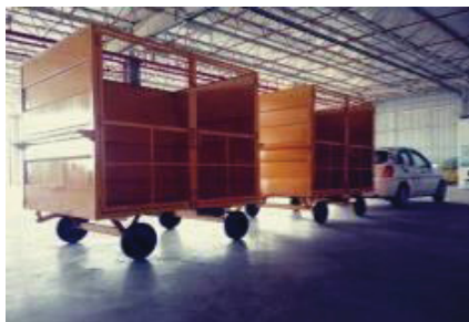
FIGURA 1 - Transferência do Lixo Comum para a Central de Armazenamento de Resíduos por meio de automóvel utilitário e gaiolas

Nesta etapa, os resíduos foram depositados em uma bancada de segregação, onde um colaborador separou-os manualmente segundo suas características, como por exemplo, papel/papelão, plástico, metal, resíduo orgânico e outros (Figura 2).