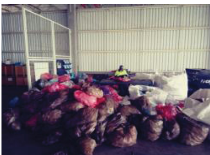
FIGURA 2 – Triagem do Lixo Comum na Central de Armazenamento de Resíduos

Nesta etapa, os resíduos foram depositados em uma bancada de segregação, onde um colaborador separou-os manualmente segundo suas características, como por exemplo, papel/papelão, plástico, metal, resíduo orgânico e outros (Figura 2).