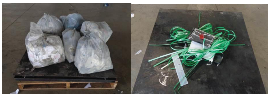
FIGURA 3a e b: Acondicionamento Lixo Comum por tipo para pesagem FONTE: O Autor (2017)

Os resíduos foram acondicionados por tipo em sacos plásticos, com capacidade de 100 L, ou sobre pallets de madeira, conforme figuras 3a e 3b, e em seguida pesados.