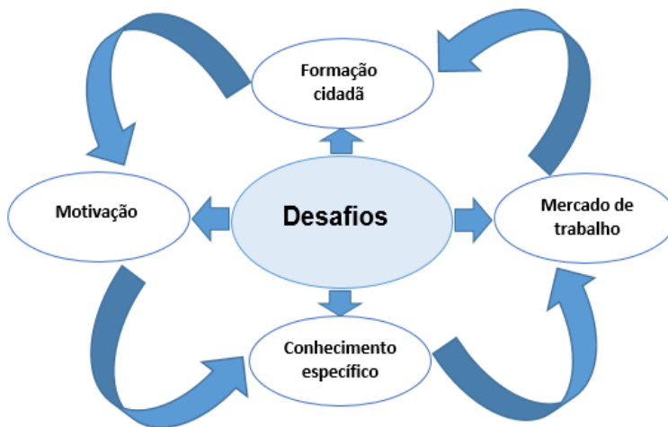
Figura 3 - Desafios no Ensino de Engenharia

ensino de engenharia e como isso deve ser motivado para que ocorra a aquisição do conhecimento específico, que será utilizado na atuação no mercado de trabalho e neste cenário, sendo um sujeito ativo na transformação social.