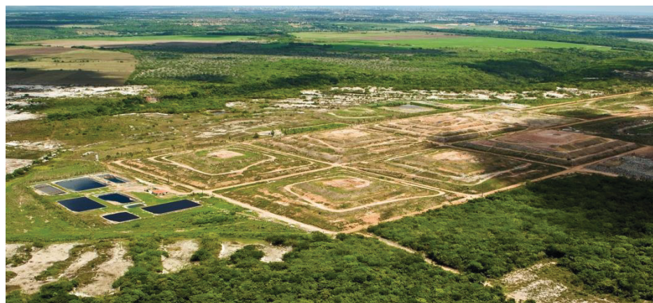
Figura 7 - Vista aérea das Células e do sistema de tratamento de chorume do ASMJP