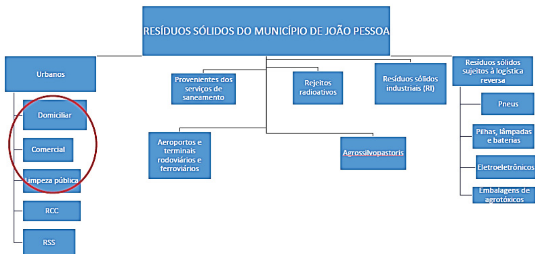
Figura 8 - Resíduos sólidos gerados em João Pessoa, com detalhe para os resíduos incluídos neste trabalho