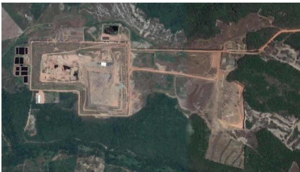
Figura 4 – Imagem de satélite do Aterro Sanitário Metropolitano de João Pessoa/PB