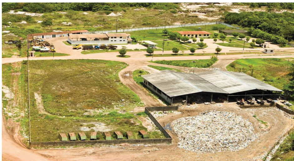
Figura 6 – Localização do Núcleo de triagem do ASMJP

A Figura 6 mostra o Galpão de Triagem do Aterro, os escritórios, algumas vias de acesso, laboratório, alojamentos, e a oficina.