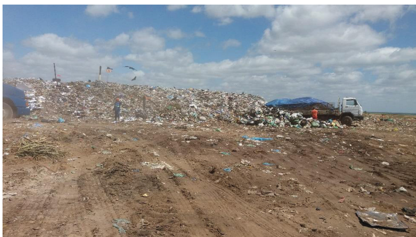
Figura 5 - Imagem da operação da Célula C25A de RSU do Aterro Sanitário Metropolitano de João Pessoa