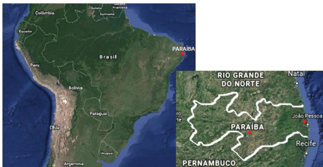
Figura 1 – Localização do estado da Paraíba no território brasileiro

A Figura 1 mostra a Localização do estado da Paraíba, dentro do território brasileiro, destacando o município de João Pessoa.