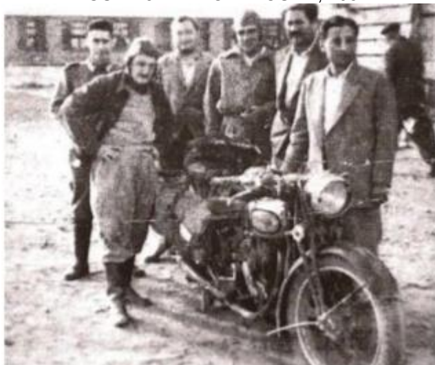
FIGURA 5 - LA PODEROSA II, 1952.

Um dos grandes registros do mototurismo foi realizado pelo ícone Che Guevara, em 1950 pelo território Andino e repetido no ano de 1952 com um amigo (Alberto Granado) desta vez de Buenos Aires a Caracas. Este segundo feito foi realizado numa velha Norton 500 cc, fabricada em 1939 e apelidada de "La Poderosa II" (FIGURA 5). A viagem tornou-se o livro "De moto pela América do Sul" que mais tarde deu origem ao filme, "Diários de Motocicleta" de Walter Salles, produzido no ano 2004 (A HISTÓRIA DO MOTOTURISMO, 2014, não paginado).