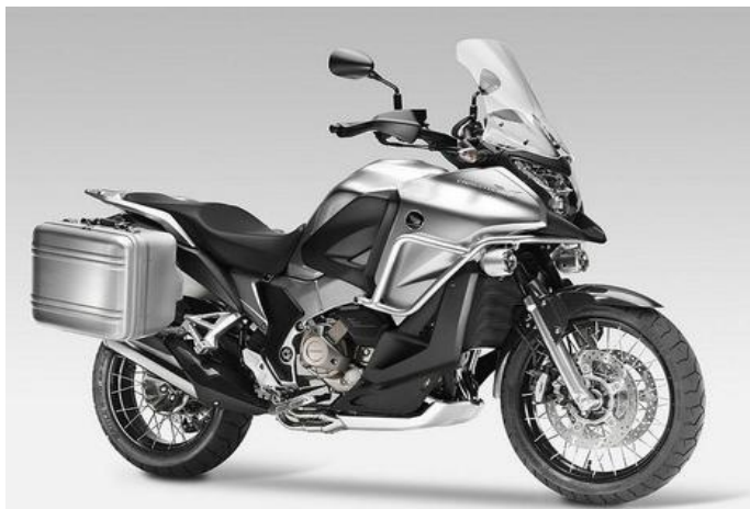
FIGURA 6 - Modelo para Mototurismo: Honda Crosstourer VFR 1200X.