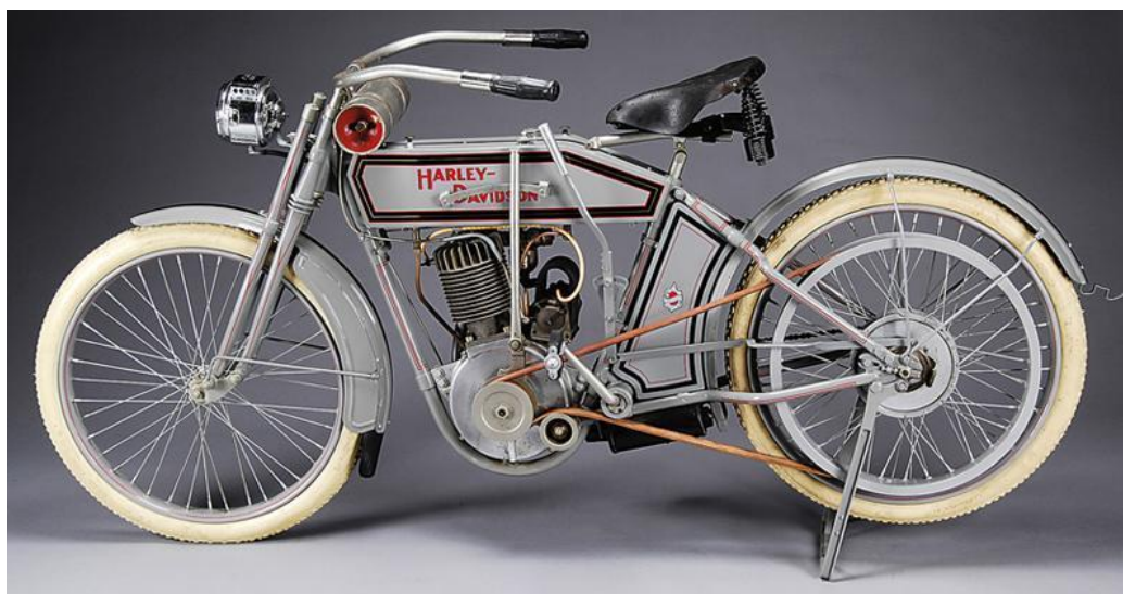
FIGURA 3 - SILENT GREY FELLOW, A PRIMEIRA HARLEY DAVIDSON