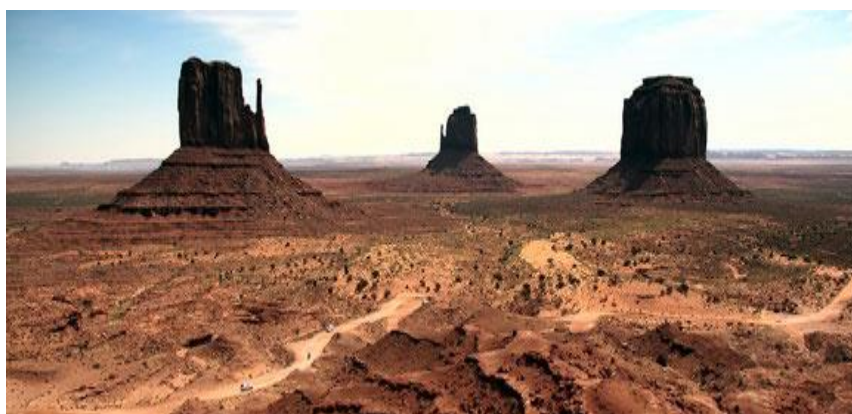
FIGURA 7 – Visão da rota 66

Um dos roteiros mais “cobiçados” pelos motociclistas de grande tradição na história das estradas é “Rota 66” (FIGURA 7), também conhecida como "mother road" ou "main street". Foi inaugurada em 1928 traz com ela a história de colonos e agricultores que durante a “grande depressão”, deixaram os estados da região conhecida como "Dust Bowl" (Kansas, Oklahoma, Texas e Colorado) para se estabelecer na Califórnia e durante este período, alguns destes agricultores foram se estabelecendo às margens da estrada. Foi declarada extinta em 1985, de forma que 217 rotas foram desviadas desta estrada, levando comércios ao esquecimento e à falência (ROUTE 66 – ROAD TRIP USA, 2014).