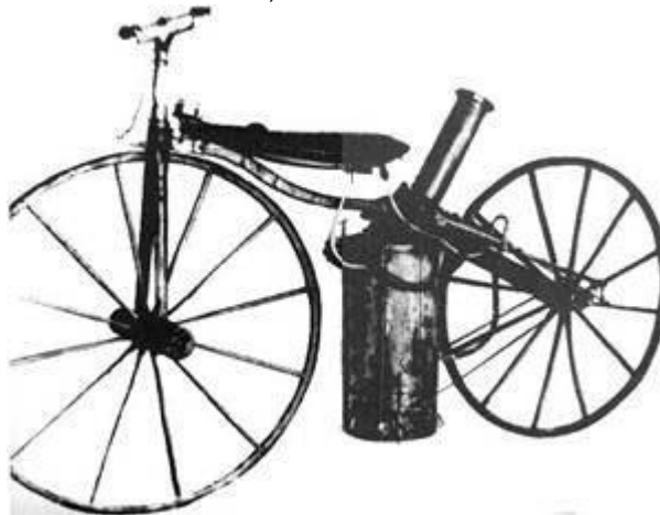
FIGURA 2 - ROVER, CRIADO POR J. J. STARLEY