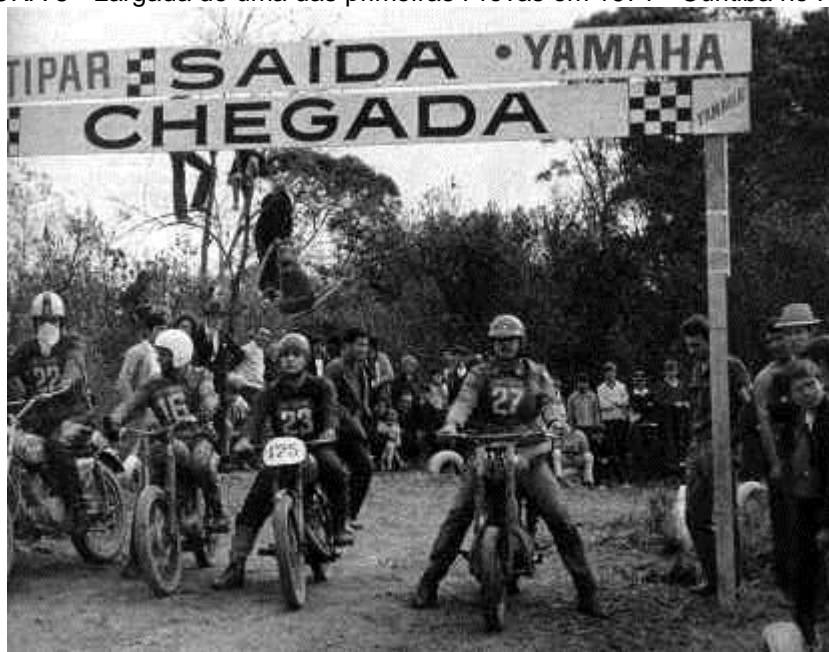
FIGURA 8 - Largada de uma das primeiras Provas em 1971 - Curitiba no Paraná