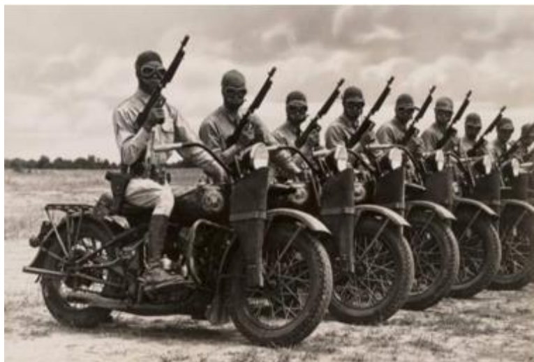
FIGURA 9 - Veteranos de guerra, em suas motocicletas na Califórnia.