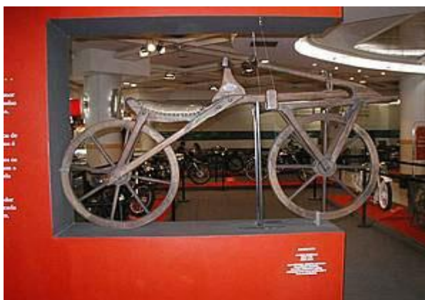
FIGURA 1 - MODELO CRIADO POR BARÃO DRAIS, CHAMADO DREISIENE

A história do motociclismo ganha forma a partir de 1790, quando Conde de Sivrac, um francês criativo e rico, utiliza a base de uma tábua de madeira para dar forma ao seu sonho, unindo duas rodas de mesmo tamanho com ela para que o condutor pudesse se sentar. O invento chamado de celerífero, logo se tornou popular entre os jovens (A HISTÓRIA DO MOTOCICLISMO, 2018).