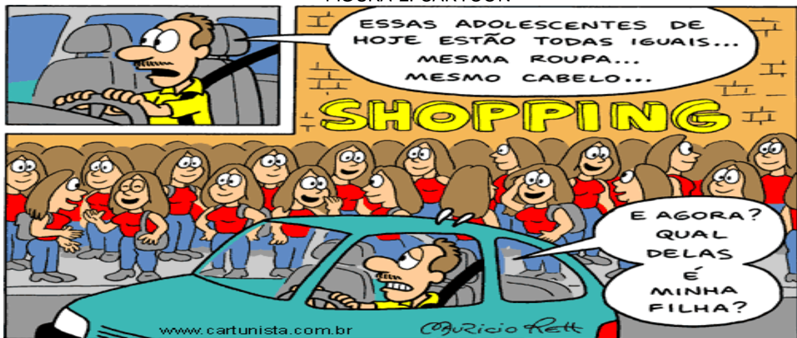
FIGURA 2: CARTOON

Na tirinha a seguir, veremos um exemplo dos impactos das instituições normativas nos comportamentos: