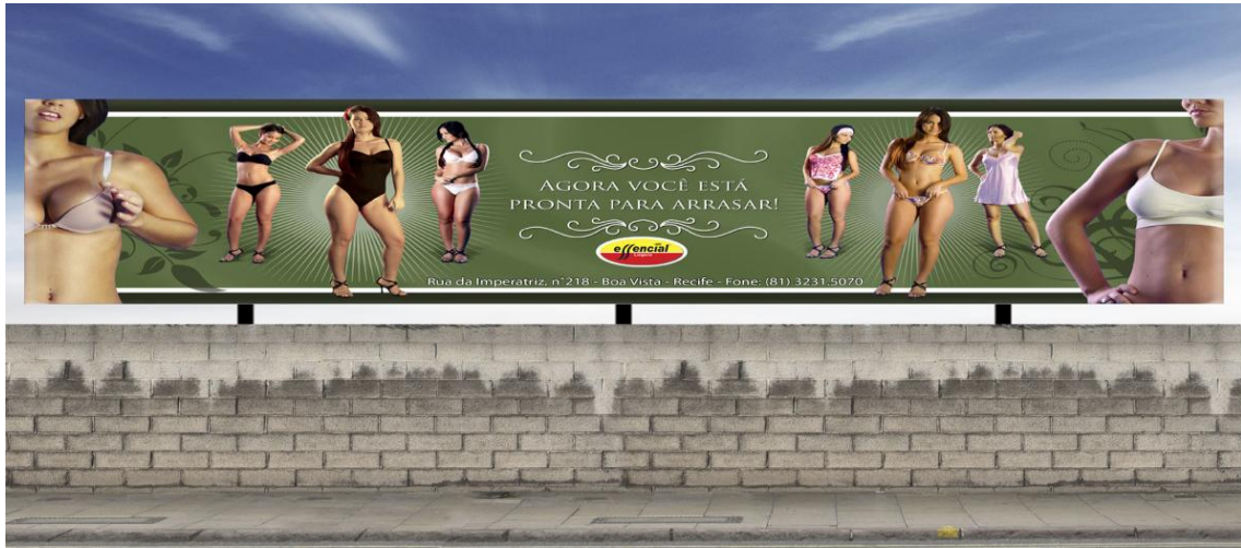
FIGURA 2: OUTDOOR