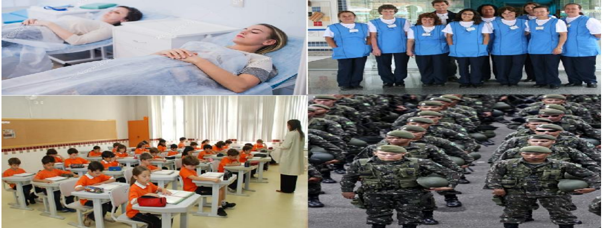
FIGURA 1: COLAGEM DE IMAGENS _ CORPOS INSTITUCIONALIZADOS

Apresentem aos(às) estudantes algumas imagens que ilustram a condição de institucionalização dos corpos e peça para que eles descrevam as características comuns a todas as representações: