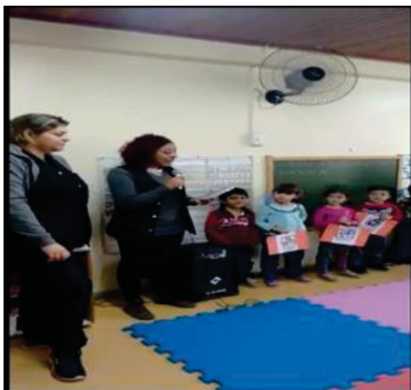
FIGURA 1 – PRÁTICA

Como mostram as figuras a seguir, Figura 1 e Figura 2, as crianças representando um trabalho feito para a prevenção à dengue.