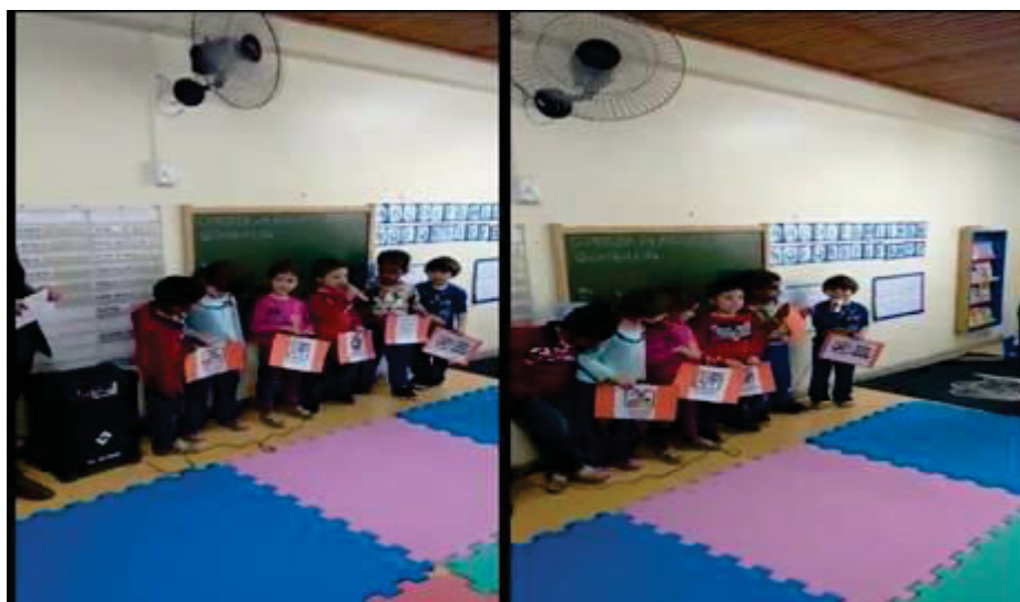
FIGURA 2 – PRÁTICA