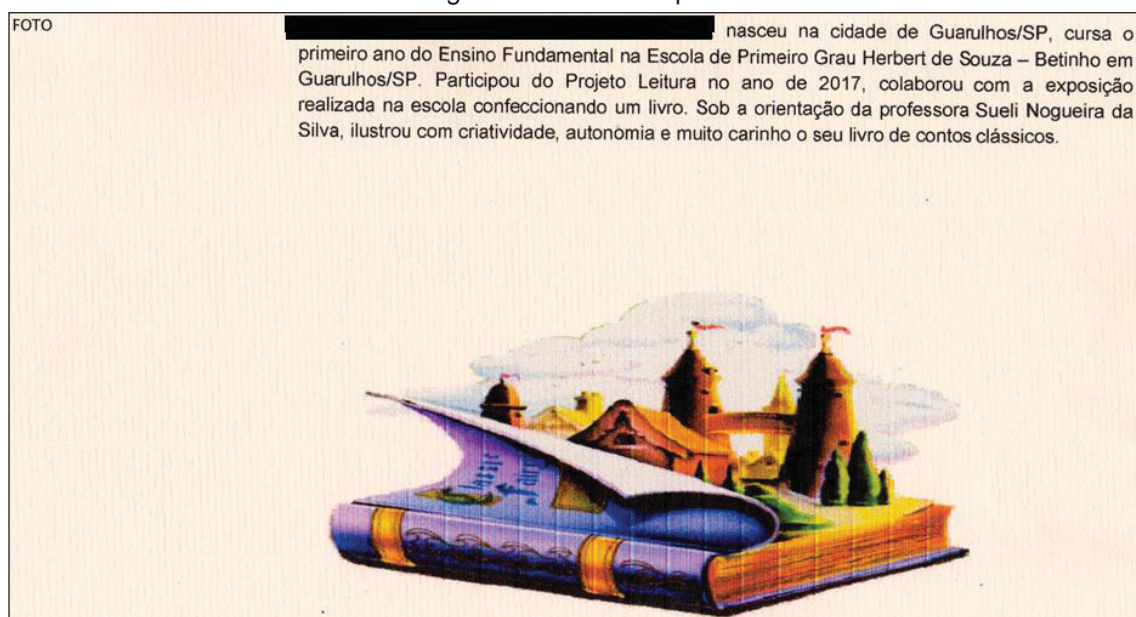
Figura 10 – Contracapa do livro

A professora foi com os alunos ao laboratório de informática da escola e, no editor de texto Word, confeccionou a contracapa do livro, que contém breve relato sobre a obra e autor do livro.