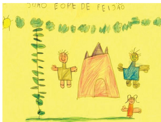
Figura 4 – Produção de aluno