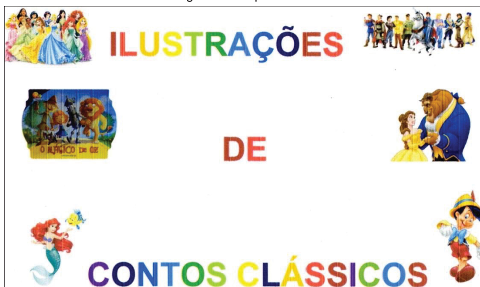
Figura 8 – Capa do livro

Foi realizada uma seleção de imagens, em sala de aula e com o auxílio do celular da professora responsável, em que os próprios alunos escolheram o que gostariam de inserir na capa do livro em questão. Logo após, a professora foi ao laboratório de informática, inseriu as imagens no editor de texto Word, montou a capa e a salvou no pen drive para imprimir em sua casa, uma vez que no laboratório de informática não havia impressora.