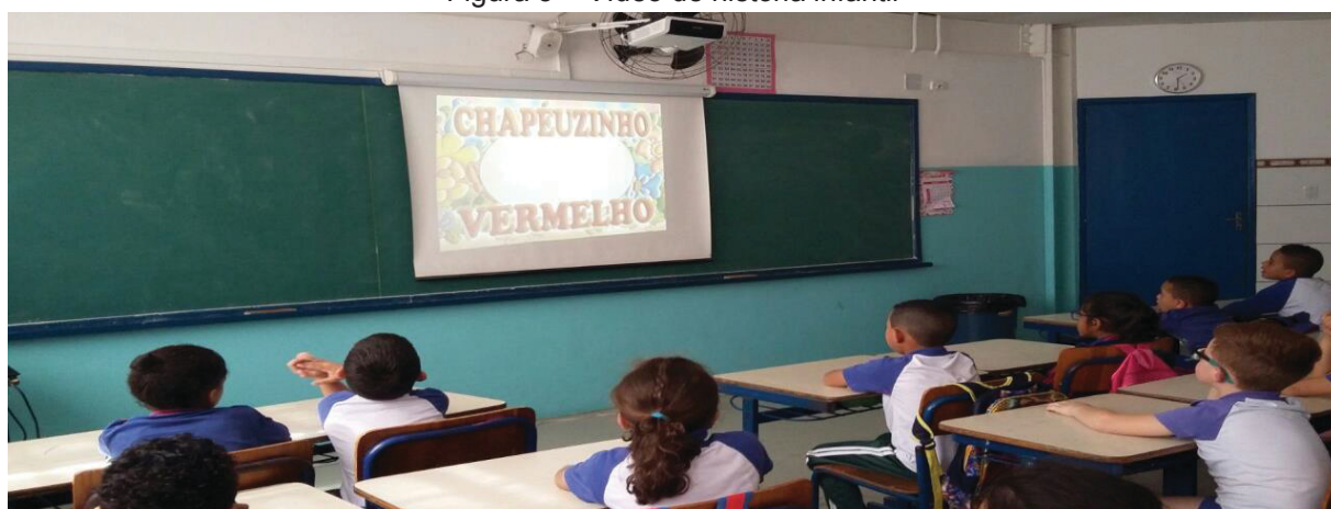
Figura 5 – Vídeo de história infantil

Durante a transmissão do vídeo, era possível notar o olhar fixo dos alunos nas cenas e nas falas dos personagens. Ao término da história, abria-se um diálogo entre a professora e os alunos, voltado à observação dos desenhos vistos no filme com o objetivo de facilitar a elaboração de cada parte da produção do livro.