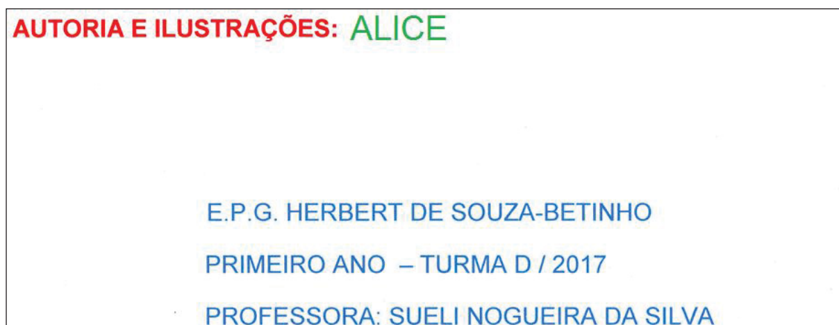
Figura 9 – Folha de rosto do livro

A professora foi com os alunos ao laboratório de informática da escola e, no editor de texto Word, confeccionou a folha de rosto do livro, que contém o nome do aluno, nome da escola, série, turma, ano e nome da professora.