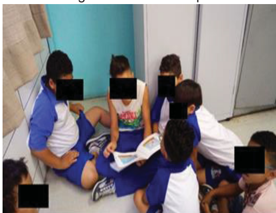
Figura 6 – Leitura no pátio

Durante o período de setembro a novembro, foi possível constatar que a atividade proposta superou as expectativas das professoras do 1º e do 5º ano. A experiência vivenciada motivou o hábito pela leitura, desenvolveu a capacidade de aprendizagem e valorizou os relacionamentos pessoais e sociais.