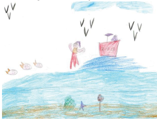
Figura 2 – Produção de aluno