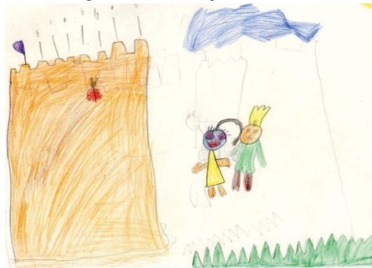
Figura 3 – Produção de aluno