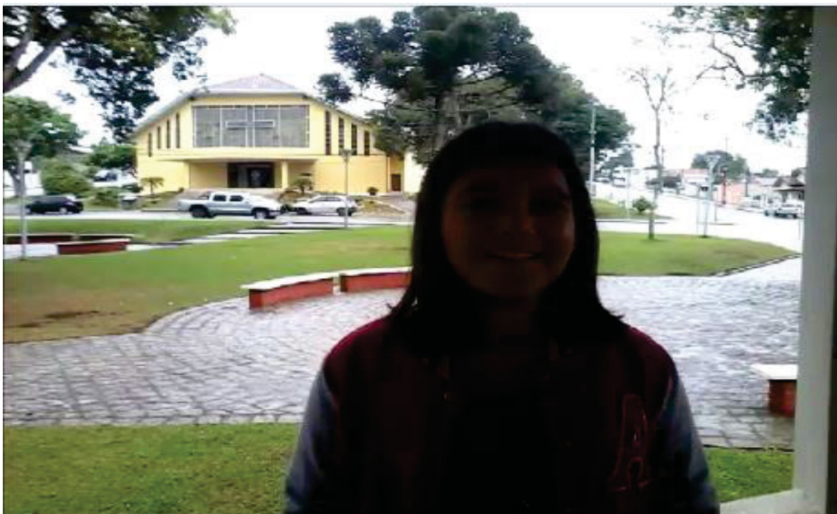
Aluna no momento das gravações, ao fundo a igreja Matriz São João Batis