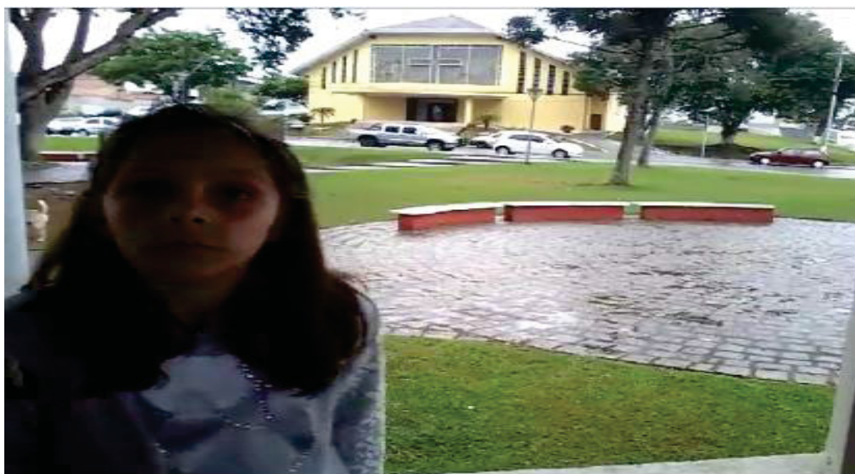
Aluna se preparando para as gravações, ao fundo a igreja Matriz São João Batista