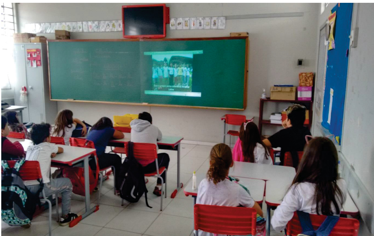
Análise das falas e cenas