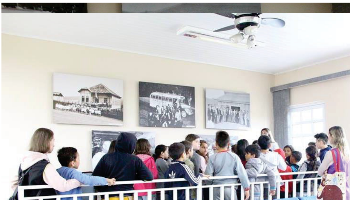
Alunos observando as fotos do município