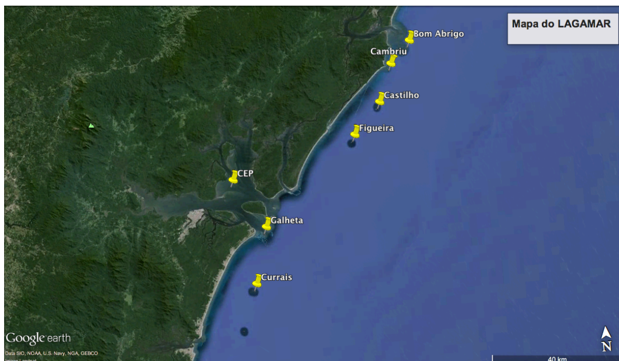
Figura 1. Mapa da região do LAGAMAR com a localização das ilhas costeiras e do CEP.

O estudo foi realizado na região do LAGAMAR, que engloba o Complexo Estuarino de Paranaguá (25°20'S - 25°35'S / 48°20'W - 48°45'W), e 5 ilhas costeiras: Bom Abrigo (25° 7'12.46"S / 47°51'21.78"W), Cambriú (25° 9'54.16"S / 47°54'41.38"W), Castilho (25°16'25.62"S / 47°57'19.36"W), Figueira (25°21'24.89"S / 48° 2'13.63"W) e Currais (25°44'5.46"S / 48°22'11.42"W) (Figura 1).