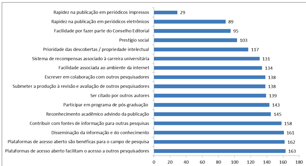
GRÁFICO 3 – MOTIVAÇÕES PARA PUBLICAR EM PERIÓDICO ACADÊMICO-CIENTÍFICO INTERDISCIPLINAR: PERCEPÇÃO DOS AUTORES- PESQUISADORES QUE PUBLICARAM NA ATOZ