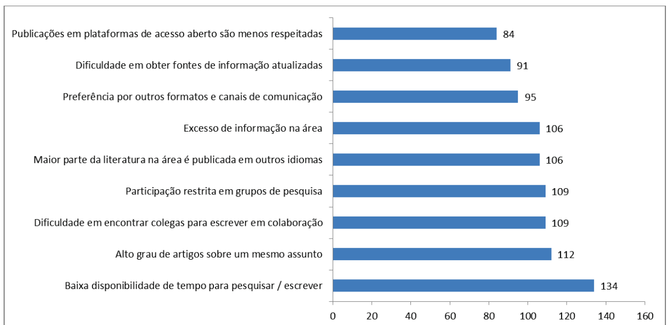
GRÁFICO 4 – DIFICULDADES PARA PUBLICAR EM PERIÓDICO ACADÊMICO-CIENTÍFICO INTERDISCIPLINAR: PERCEPÇÃO DOS AUTORES-PESQUISADORES QUE PUBLICARAM NA ATOZ